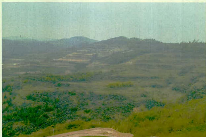
庞家河流域退耕还林