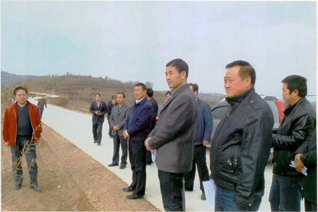
麦积区领导来大庄乡观摩地膜种植