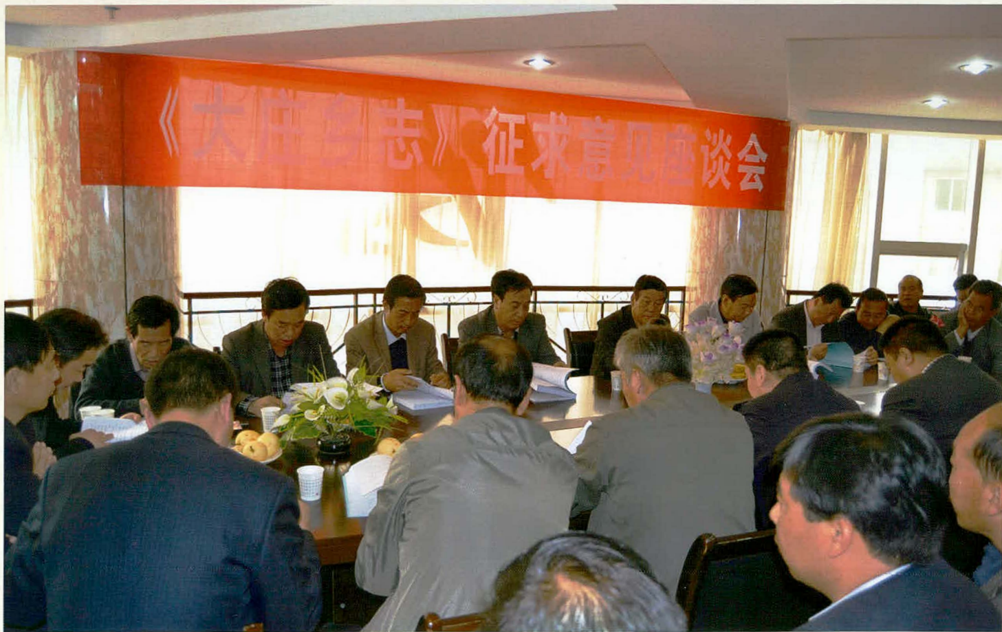
《大庄乡志》征求意见座谈会一角