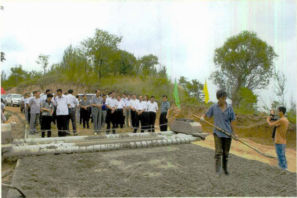
2012年大庄乡公路建设现场会