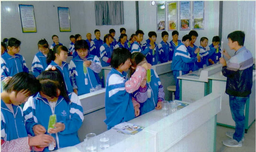
严肃认真的课堂教学