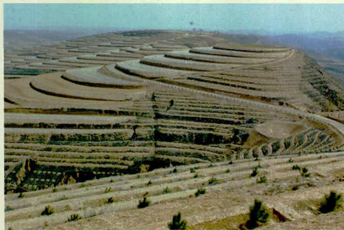
奇罗河流域万亩梯田