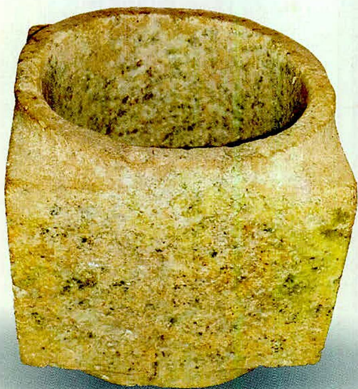
神蜂寺出土的玉琮