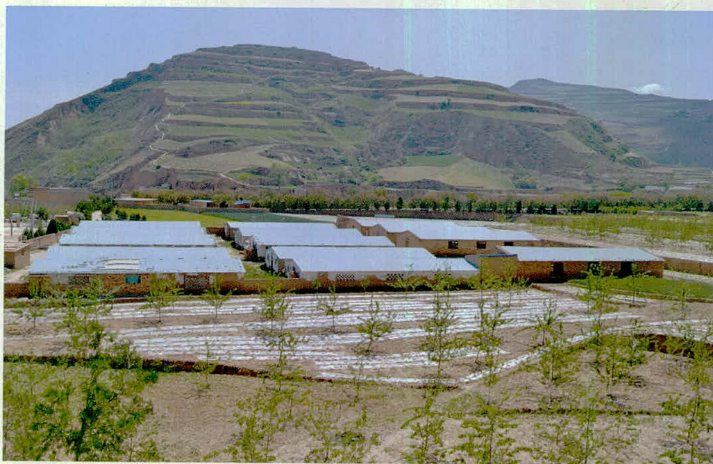
城子村规模养殖场