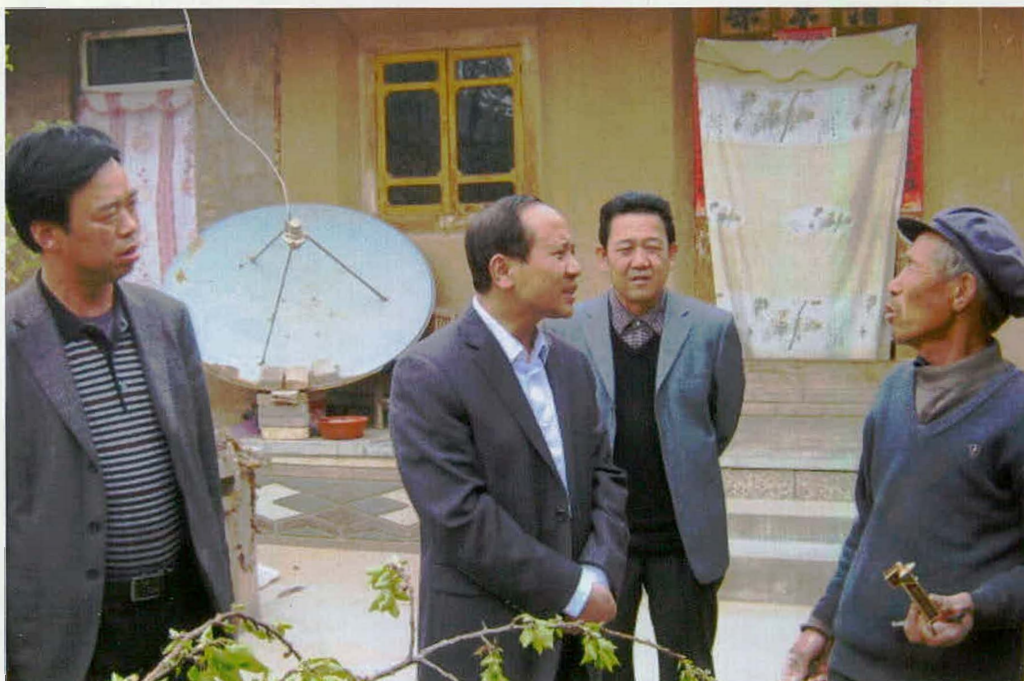
县委书记贾忠慧（左二）走访农户