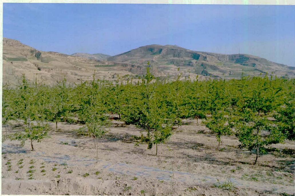
散渡河流域千亩果园