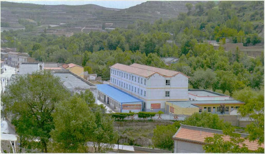
大庄初中学生公寓楼鸟瞰图