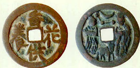
观音殿出土的铜钱