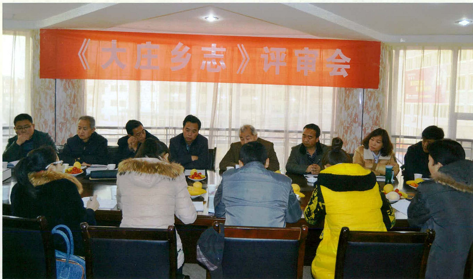
《大庄乡志》评审会一角