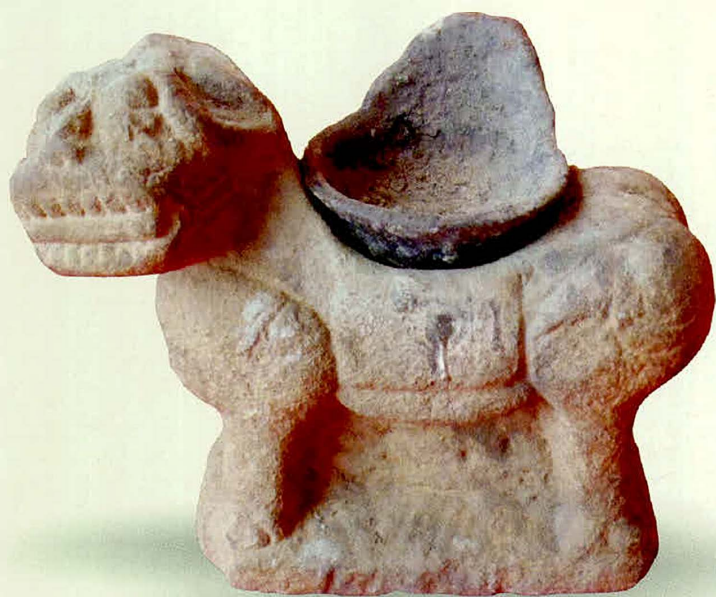
观音殿出土的石狮驮灯