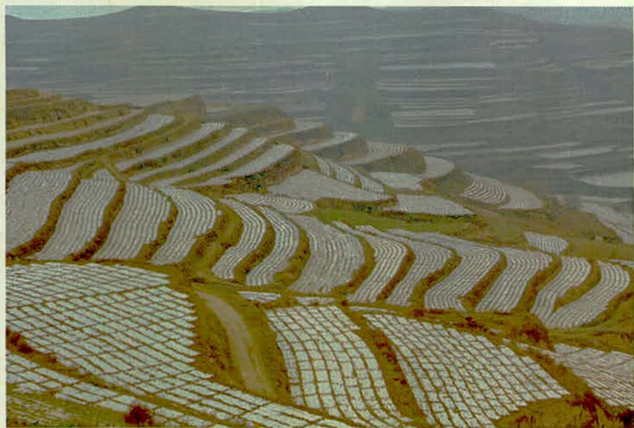
西小河流域全膜双垄沟栽培