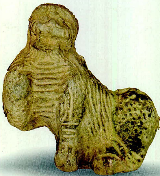
神蜂寺出土的石猴