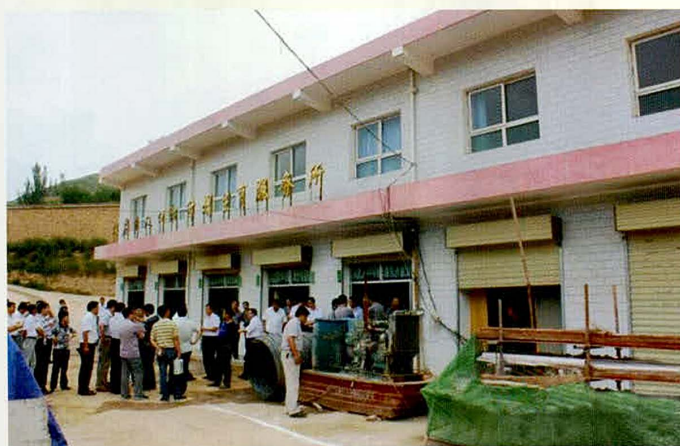
大庄乡计划生育服务中心