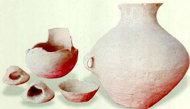
观音殿出土的陶器