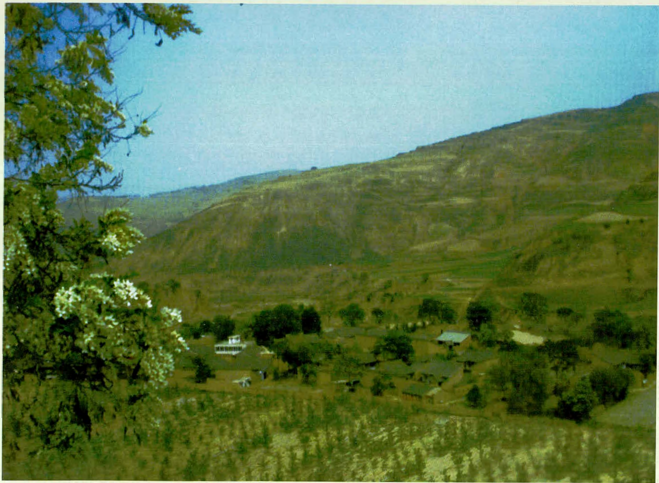
箎 箎 城 古 战 场 今 貌