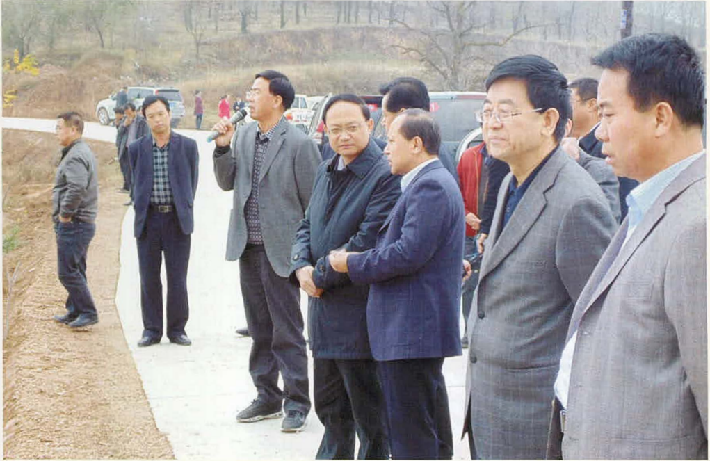
全市地膜种植现场会在西小河流域召开