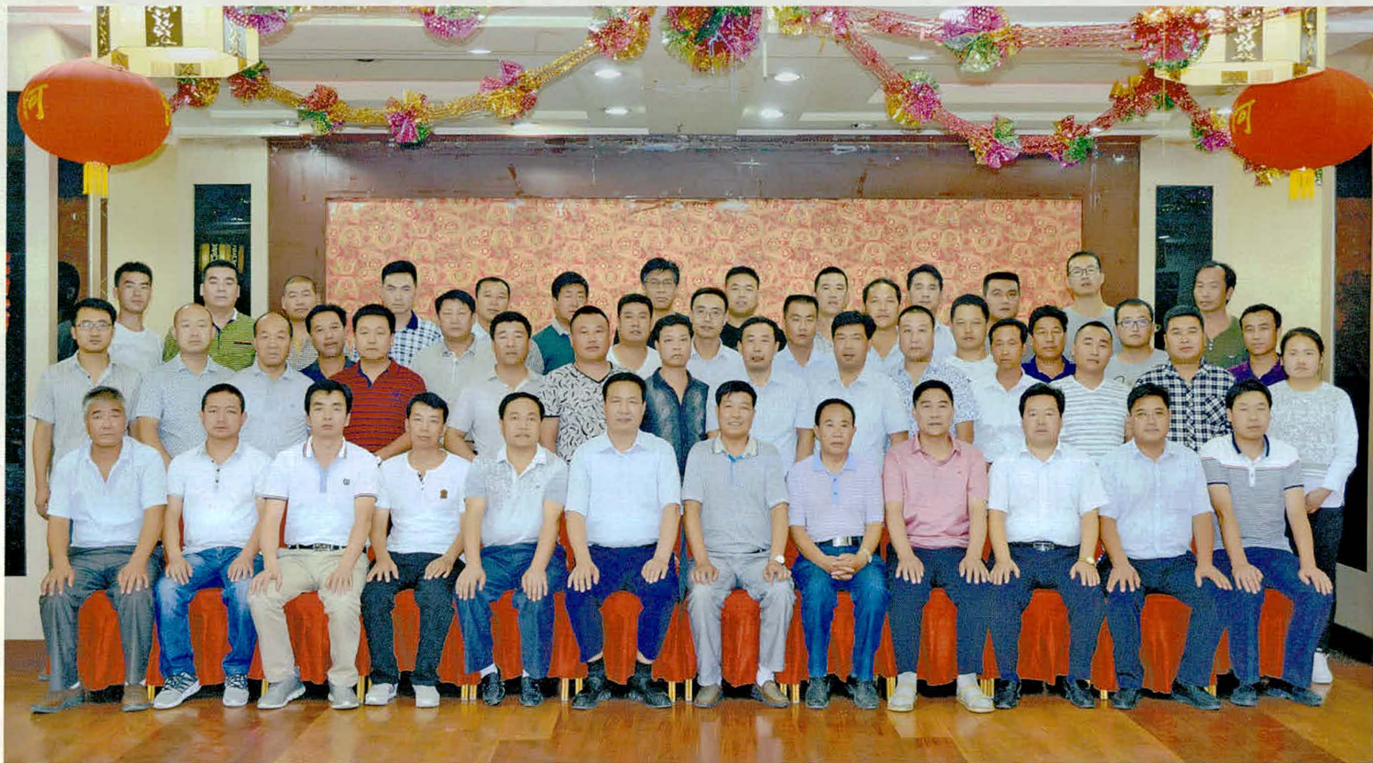
《大庄乡志》出版发行筹备座谈会合影