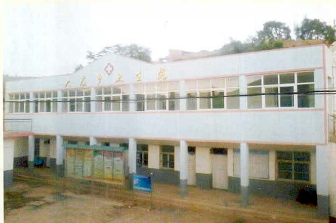
大庄乡卫生院门诊楼