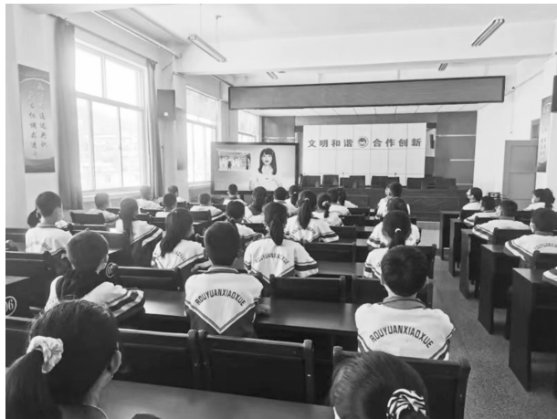
“生命教育讲堂”进学校活动

【应急救护培训】 打造“博爱陇原·救在身边”品牌，加强与公安、教育、应急、卫健等部门协作，开展红十字救护培训“五进”活动。贯彻执行《中国红十字会应急救护培训标准化工作手册》，面对疫情防控严峻形势，按照“救在身边·应急救护服务平台”管理要求，采取互联网+培训模式，实现学员线上理论学习考试，线下实操培训考核，做到统一教学、统一教材、统一质量标准、统一考核发证“四统一”，在学校、消防队开展救护员培训，完成应急救护知识普及3200人。