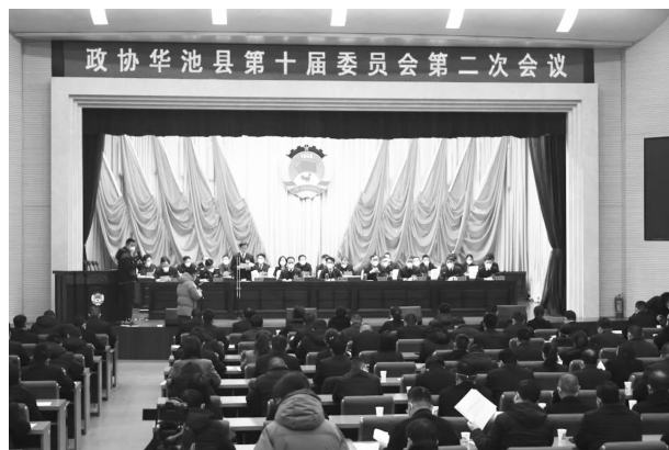
政协华池县第十届委员会第二次会议召开

审议通过了《政协华池县委员会关于高质量推进招商引资工作专题调研的报告》《政协华池县委员会关于现代化农业产业体系建设专项视察的报告》。