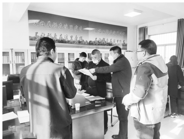
国有资产查验现场

【国有资产】 本局承担全县行政事业单位国有资产统一管理、清产核资，调剂、处置和有偿使用工作，管理县级经营性国有资产收益。全年共计审核（批）报废、评估、拍卖、调拨资产 79 宗，残值收入 744852 元。按照《关于进一步加强全县行政事业国有资产管理工作的通知》，为组织部、信访局、人社局等 16 个单位审批资产配置，价值约 303337 元。对本县 9 处经营性资产通过评估、公开、透明的方式进行招租，进一步盘活经营性国有资产收益，实现非税收入 391264 元。全面落实稳经济一揽子政策，为承担的 8 家企业和个体户减免房租 3 个月，共计 95950 元。为县民政局、退伍军人事务管理局、信访局、综治中心等 10 余家单位解决办公用房刚性需求约 2000 平方米，保障办公用房科学、高效使用。