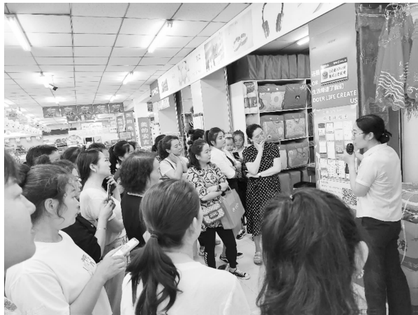
7 月 16 日，开展“百万巨惠·乐享华池” 线上线下融合促消费活动

种。联合春秋航空股份有限公司在庆阳机场举办“华池县农特产品主题推介活动”，期间实现销售额 2.7 万元；与采油二厂签订消费帮扶额 100 万元。