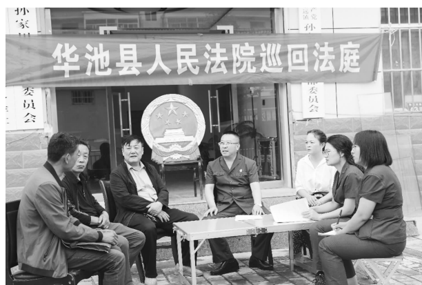
7 月 19 日，巡回法庭开庭审理案件

2973 案，邀请人大代表、政协委员、群众代表旁听庭审、监督执行、征询意见 3 次，以公开倒逼公正，审判机制更加科学合理透明。升级智慧法院。全年跨域立案 4 件、网上立案 190 件、网上交费 1794 件、电子送达 820 件，处理“12368”热线工单 90 余条，在线审理案件 168 件，远程提讯 37 件，音视频调解 150 件，让数据多跑路，让当事人少跑腿，实现司法便民措施信息化。拓宽服务渠道。成立司法和人民专业调解团队，诉前调解婚姻家庭、民间借贷、物业服务等各类纠纷 275 件；延伸诉讼服务中心服务职能，提供“一窗、一网、一号、一次”通办等诉讼服务，当场立案率 100%；为困难群众减缓诉讼费用 14 案 23.5 万元，发放司法救助金 6 万元。