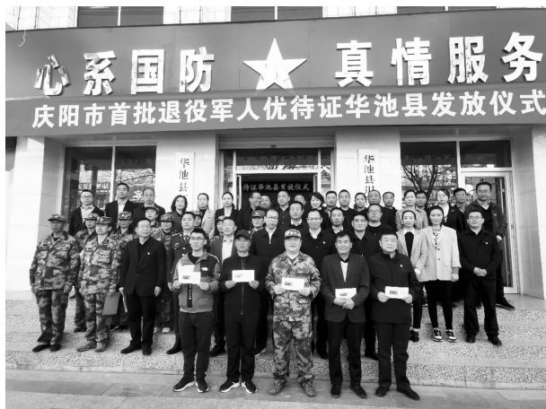
庆阳市首批退役军人优待证发放仪式

金 4.5 万元。4 月 8 日，全市首批退役军人优待证发放仪式在华池举行，已完成申领 2100 人，申领完成率达 75%，成功发放优待证 1920 个。配套落实免费乘坐公交和快递邮寄、机动车加油等优待证专属优惠政策。“八一”建军节前夕，举办全县退役军人及其他优抚对象代表座谈会和参战参试老兵座谈会，为参会退役军人及其他优抚对象代表发放价值 3 万余元的慰问品。在新兵入伍、老兵退役之际举办欢送仪式，赠送水杯、书籍等纪念品 50 余份，为入伍新兵家属颁发“光荣之家”牌匾 42 面。为 38 名立功受奖官兵家庭送去立功喜报，发放慰问金（品）1.1 万元。