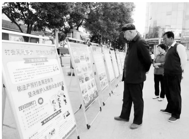
开展法治宣传活动

疫情防控工作方案，将城区125个小区303栋楼划分成23个责任片区，落实县级领导包抓责任，全面掌握片区内人口、自建户等信息，提升城乡社区疫情管控水平。对不良贷款进行难易分类，精准制定“一户一策”方案，实现以点带面，整体推进，共清收处置不良资产10499.35万元，完成当年计划的118.23%，累计完成总计划的45.94%。