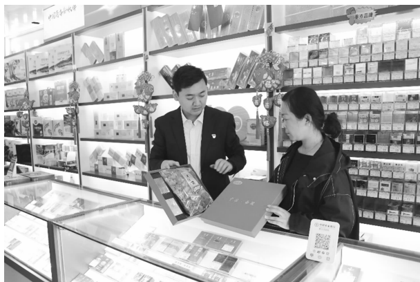
在“红色先锋”党建实践点指导零售客户 推荐南梁特产

【专卖管理】 坚持专销协同，强化市场监管工作。查获各类涉烟违法案件76起，完成任务的100%；查获数量62.20万支，查获案值46.63万元，收缴罚没款8.4696万元，查处5万元以上案件2起。查获假冒走私卷烟案件20起，数量0.544万支。保持卷烟打假打私工作高压态势。认真落实“建机制、堵源头、打团伙、管市场”的打假打私工作方针，开展“全员专卖”工作，要