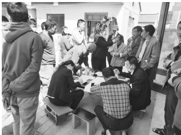
上门为甘肃路桥项目部工人办理陇明公卡

络安全宣传周和“3·15”金融消费者权益日等宣传活动，普及金融知识，切实维护好人民群众的合法利益。为行动不便的客户金融上门服务，其中开立银行卡1张，办理密码重置1笔；为甘肃路桥公路工程项目工地工人上门开立陇明公卡1539张；为县第一中学、县职业中等专业学校、县实验幼儿园提供上门收款服务，切实解决客户难题。