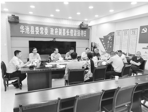
5 月 27 日，信访工作联席会议召开

【信访积案化解】 全力化解上级交办信访积案。全年国家信访局共交办华池重复信访积案 5 件，市信访工作联席会议交办重点信访事项 12 件，全部实行县级领导包案，均按期办结。开展“大督查大接访大调研”专项活动。聚焦乡村振兴、社会治理、拆迁安置、扶贫领域项目缺口资金核查、国有土地已售城镇住宅“登记难”等重点领域信访问题，划定“责任田”，守好“主阵地”，推进党员干部亲自“接”、主动“约”、定期“下”，主动往“矛盾窝”里钻，真正变“上访”为“下访”，坚持啃“硬骨头”，有效化解各类信访积案 43 件。强化重点突出信访问题排查力度。充分发挥信访联席会议机制作用，对特殊疑难复杂信访问题和重大事项，提级办理，牵头协调处理，在最短时间内将问题成功化解处置到位、将风险隐患消除在萌芽状态，避免舆论事件和社会负面影响。全年牵头化解陕西志丹县杨某非正常死亡、新堡“6·2”安全事故等 15 件突发事件引发的重点信访问题，有效预防越级上访和缠访闹访问题的发生。