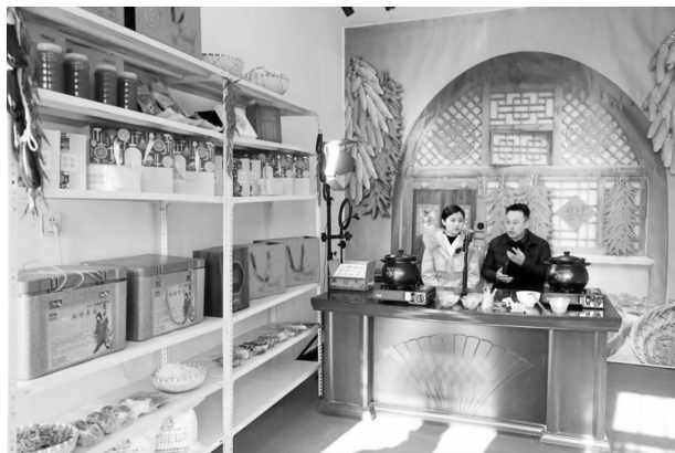
华池县融媒体中心田庄村电商驿站

和《党的二十大期间安全播出专项督查方案》，结合实际完善《广播电视安全播出应急预案》和《网络安全应急预案》，从 5 月开始，定期组织专业技术人员对白露山差转台、紫坊畔差转台及五蛟、城壕无人值守站点等重点播出岗位开展安全隐患排查 21 人次，发现问题 4 处，现场完成整改 3 处，安装远程监控系统 1 套，对重点岗位实现 24 小时、无死角监督管理，加强安全传输、播出系统和技术设备的检测监管。做到人员到位、责任到位、能力到位、应急准备到位，在安全播出上实现“零事故”“零插播”“零中断”。聚力乡村振兴，发挥融媒体服务功能。筹资 1 万元用于购买玉米套种大豆种子，助力村级产业发展。筹资 2000 余元慰问帮扶村柔远镇田庄村“三类户”。发挥“媒体+商务”平台作用，以“柔远电商驿站”、县融媒体中心下设甘肃融联传媒有限公司为基础平台，配合镇村电商负责人开通抖音、快手账号，加挂农产品销售“小黄车”，长期为柔远镇及县域周边助农直播带货服务。优化机关面貌，提升媒体融合影响力。筹资 2 万余元对办公楼楼道文化墙进行更新，总结提炼媒体融合“123456”工作法上墙展示，为县委组织部、统战部、宣传部等单位提供观摩点，市委组织部、合水、宁县融媒体中心等单位来华池融媒体中心参观学习。