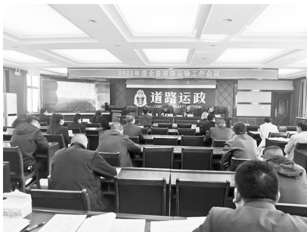
2022年度全县道路运输工作会议

通过入户走访、电话询问等方式进行信息比对6次，全面了解和掌握本县道路货运领域经营业户、从业人员和党员货车司机等现状，健全完善5本台账（道路货运领域经营业户台账、货运司机台账、党员货运司机台账、驾驶员反映问题和诉求受理台账、货运司机关心关爱台账），华池现有货车司机107名，党员货车司机10名；在庆祝中国共产党成立101周年之际，中共华池县交通运输行业委员会在全县道路货运领域开展以“喜迎二十大，建功新时代”为主题的系列活动。开展“走基层、听民声、送温暖”活动、开展党支部书记为党员货车司机讲“微党课”活动、开展货车司机心理健康关爱活动、开展“我为货车司机办实事”活动，完善加水点基础设施建设，为党员送去党的关怀和温暖；建设党群服务阵地情况，在县运管局建成“司机之家”1个、活动阵地1处（篮球场1个、羽毛球配套设施1套、活动健身体育器材6个、简易厕所1处）、货车司机免费加水点1处、澡堂1个、厨房1个、休息室1个。