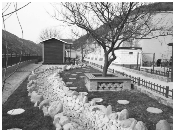
庄科村人居环境改造

补贴 400 人 43.27 万元；经济困难老年人 198 人 24.96 万元；孤儿 13 人 16.85 万元；事实无人抚养儿童 13 人 16.09 万元；临时救助 217 户 808 人 136.62 万元；实现应保尽保、应救尽救。落实“雨露计划”132 人 39.6 万元，“六一”儿童节开展爱心捐赠折合资金 1.95 万元，中化集团捐赠图书 2100 册价值 10 万元。扎实做好稳岗就业工作。开发公益性岗位 482 个，增设食用菌采摘岗 400 个，开展就业技能培训 2 期 150 人次。