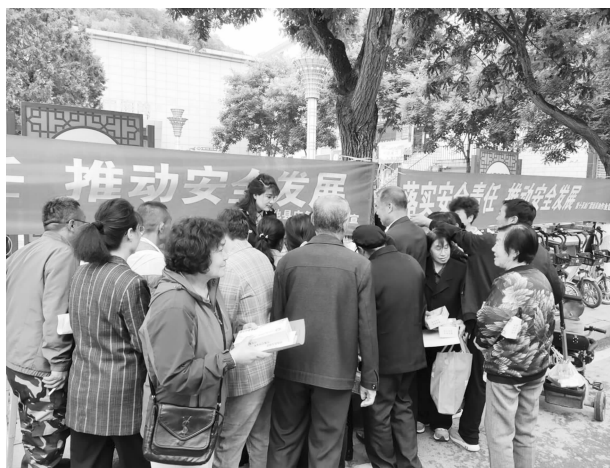
应急管理和安全生产宣传

【宣传教育培训】 在宣传、教育、培训上下功夫，推动应急管理和安全生产工作从“事后救援”向“事前防范”转变。持续推进“用好一个平台、送四类书、培训三类人员”行动，引导广大居民群众增强安全意识、提高应急避险能力。全年通过“两微一端”信息平台，向全县手机用户发送安全生产提示、预警信息、气象信息等累计4000多条；累计投入15万元，印制《安全知识读本》《护林防火手册》《应急避险知识读本》《突发事件总体应急预案、生产安全事故、森林草原防火、防汛抗洪四部应急预案简明手册》以及玻璃水杯、纸杯、手提袋、围裙、宣传画等各类宣传资料3.1万份（册），切实做到安全生产、应急管理、防灾减灾、森林草原防灭火等领域宣传教育全覆盖。组织县、乡镇应急管理人员、安委会成员单位安全监管人员和企事业单位员工360人次，开展安全生产、灾害员信息报送专题培训、节后企业复产复工、企业主体责任落实、“遵守安全生产法、当好第一责任人”等培训活动；组织开展重点直管企业负责人和管理人员培训3期，培训210人次，提升员工安全意识，强化企业安全生产管理基础。