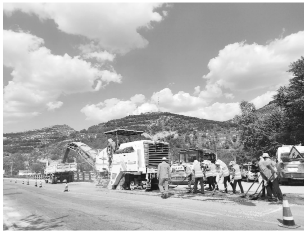
余家坪大桥桥面铺装施工

【亮点工作】 非现场执法。制定非现场执法工作方案，探索、总结、改进工作方法和流程，谋划破解非现场执法推进工作瓶颈，全力维护路产路权及养护成果，形成成熟工作流程，与日常养护工作有效融合。创建示范路桥隧。全面落实示范创建工作任务，筹备谋划，制定工作方案，细化工作措施，分别于7月底、10月底、11月底完成示范桥、示范路、示范隧创建任务，整体创建工作进展顺利，效果显著，为过往旅客营造“畅洁舒美安”的通行环境。