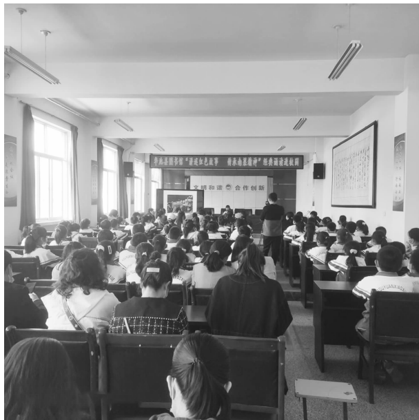
“讲述红色故事 传承南梁精神”

阅读爱好者参与,营造“爱读书、读好书、善读书”的文化县城氛围。坚持周开馆不少于 56 小时,实现无障碍、零门槛进入,为读者提供免费借阅、咨询服务。