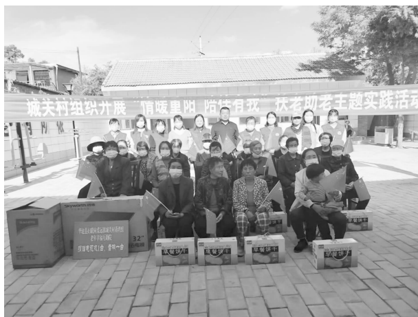
在城关村幸福互助院开展扶老助老主题实践活动

“六心南关”（党员引领聚民心、提升服务得民心、网格走访知民心、扶危济困暖民心、深入群众贴民心、多彩活动悦民心）党建品牌。