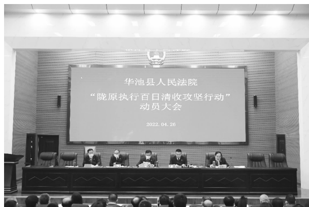
4月26日，召开“陇原执行百日清收攻坚行动”动员大会

2.5万余元棉被、米面等慰问物资；筹资2.5万元为齐庄子村委会添置办公桌椅、维修文化站等，改善驻村工作环境；将45万元村集体发展资金入股种养殖农民专业合作社，创建务工平台，帮销农副产品，促进村民创收增收。优化营商环境。开启中小微企业涉案绿色通道，制定便捷诉讼服务措施12条，实行“一站式”诉讼服务，实现立审执无缝衔接；成立审理破产、执行合同专项小组，审结金融类、票据类案件308件，执结105件，实际执行到位1955.22万元，保障中小企业合法权益。传承司法经典。创立“行走法庭”“集市法庭”“小院法庭”“云上法庭”等司法为民平台，全年开展巡回审判60余场次，普法宣传20余场次，法官干警深入案发地调查取证、庭前调解、现场执行等2200余次，全院案件就地调处率、普法宣传率从55%提升到71%。