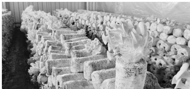
华池县现代农业菌光互补产业园

内苗木腾退1490亩；整治撂荒地3036亩。对于因劳动力短缺和在外务工无人耕种耕地，实行农业托管项目代种代管，确保良田种粮、应种尽种。新建标准化养殖小区1个，发展家庭农场48个，新建标准化牛羊棚圈59座，带动全镇养殖肉羊446户2.65万只，养殖肉牛396户3207只。通过培育发展，全镇产业不断转型，向农业现代化推进。优化食用菌产业布局，完成光伏板下地栽黑木耳400亩460万棒，年产干品黑木耳250吨，产值达2800万元。