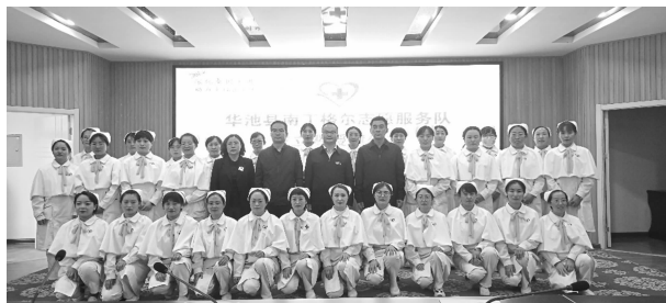
华池县南丁格尔志愿服务队成立

【志愿服务】 创建志愿服务工作新机制，建立红十字志愿者之家，完善志愿服务管理、培训、保障、激励机制。完善志愿服务规范化管理，成立由县人民医院、县中医院、各基层卫生院优秀护理人员组成的华池县南丁格尔志愿服务队。开展公益义诊、健康知识普及、投身抗“疫”一线等红十字特色志愿服务活动40余次，组织志愿者发放应急救护普及、防灾减灾、疫情防控、无偿献血、造血干细胞、遗体器官捐献等宣传资料2万份。