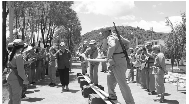
纳新党员赴南梁开展党性锤炼活动

【党建引领作用发挥】 结合全县“两型”机关创建工作，制定印发《县直机关创建“服务型效能型”党组织实施方案》《世界读书日致全党向党员干部倡议书》，号召各级党组织通过支部联建、开展党内关怀、建立“书香型机关”等措施，增强机关干部服务意识，提高服务群众的质量和水平。全面落实“双报到双服务”要求，设立党员先锋岗，1413名党员分别到3个社区进行报到，单独或联合在乡村振兴、疫情防控、扶危救困、防汛救灾、社会治理、环境卫生整治等方面开展志愿服务活动110余次。推荐二十大党代表和省十四大代表各18名；春节和七一期间慰问困难党员、老党员44人，送去慰问金27900元；七一期间，组织73名老党员在南梁开展党性锤炼主题运动会，并向9名符合条件的老党员颁发“光荣在党50年”纪念章。印发《2022年县直机关党组织“喜迎二十大 建功新时代”系列主题活动清单》，县直各级党组织结合工作实际开展岗位大练兵、读书征文、开展热议二十大报告、党组织书记讲党课等活动。