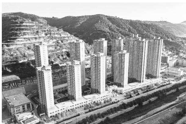
延庆山水国际商住小区建设项目一期

【重点项目建设】 全年实施城镇老旧小区改造、城区道路、停车场、管网改造等重点项目 20 个。列入地方政府专项债券项目 5 个，落实资金 15600 万元。包抓实施重点项目 10 项，当年竣工 5 项，在建 5 项，累计完成投资 19059 万元。引进华池县西和佳慧商贸综合体建设项目，该项目总投资 5.2 亿元。8 月完成项目签约，占签约任务 2.0 亿元的 260%。