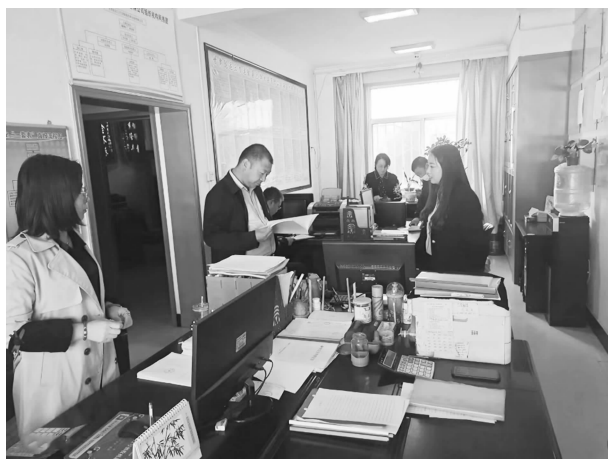
开展安全生产检查

能型”机关工作作为2022重点工作，围绕省、市、县关于优化营商环境的部署要求，召开专题会议，制定印发《关于进一步优化营商环境创建“服务型效能型”机关工作的实施方案》，成立工作领导小组，明确亮牌服务、持证上岗、首问负责、限时办结、群众评价、责任追究”六大类工作和“安排部署、推动落实、巩固提升、长期坚持”四个阶段任务；与全体干部职工签订《创建“服务型效能型”机关干部承诺承诺书》并开展“干部扪心自问、股室问题自查、部门作风自改”活动，建立问题清单和整改台账，聚焦突出问题，全面自查自改，扎实改进干部工作作风，持续优化办事程序，切实提升服务效能，不断推动全局优化营商环境工作走深走实。