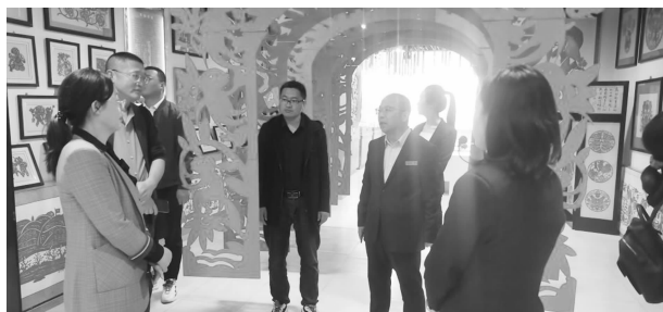
甘肃省文化和旅游厅工作组验收省级非遗项目—镇庄兽

位设计、高标推进、高效运营”的总体思路，推进南梁红色旅游5A级景区创建工作。制定《关于南梁红色旅游景区申报创建国家5A级旅游景区工作方案》，已完成景观质量报告计划本，并实施南梁红色民俗村和“一街八坊”项目，开展驻点演出，提升景区娱乐性。完成无偿资金争取400万元，抓好体育项目支持，建好体育场地，建设文正体育休闲公园，完成全县体育场地普查，对全县全民健身场地进行普查登记上报，普查新增场地总面积22909平方米；申报乡镇社区多功能体育运动场2处，对全县全民健身广场体育设施进行维修。