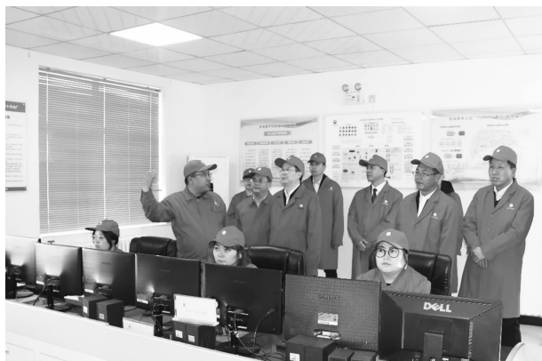
甘肃省检察院调研组在华池开展生态环境 保护公益诉讼工作督导调研

【未成年人司法保护工作】 开展“检爱同行 共护未来”未成年人保护法律监督专项行动，对成年人侵害未成年人犯罪“零容忍”，批捕3人，起诉5人。对未成年人犯罪坚持打击、保护、挽救并重，对情节严重的批捕2人，起诉2人，对情节轻微且有悔罪表现的不批捕4人、不起诉6人，附条件不起诉5人。持续抓好“一号检察建议”的落实，会同教育、公安等部门落实入职查询和强制报告制度，做到教职人员全覆盖。联合教育、妇联等部门对6名涉罪未成年人开展帮教，助其早日回归学校、回归家庭。创新实施被性侵未成年人异地医学检查、异地转学安置等措施，最大限度保护未成年人隐私。开展法治进校园活动，选派9名检察官担任12所学校的法治副校长，开展校园法治宣传活动12场次，发放视频、音频等宣传资料120余份。