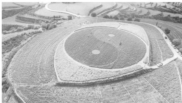
孙家川万亩药源基地

2850 吨，实现产值 8000 万元，带动 530 户农户增收致富，产品出口日本、加拿大等国家，创汇 20 万美元，实现对外贸易“零的突破”。