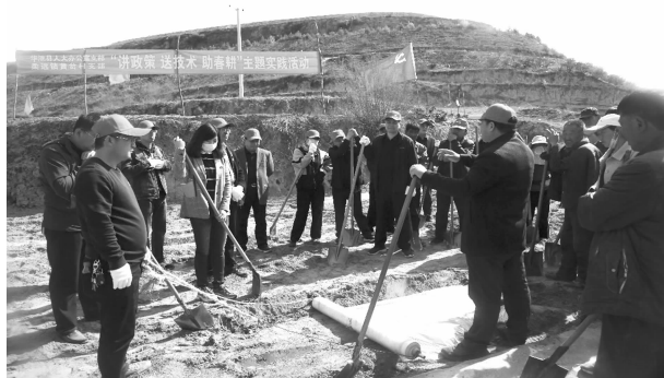
4 月 19 日，华池县人大常委会机关党支部与柔远镇黄岔村党支部联合开展“讲政策、送技术、助春耕”支部共建实践活动

【参与全县中心工作】 坚持围绕中心、服务大局，认真落实县委工作部署，围绕包抓企业、项目建设、乡村振兴、营商环境、疫情防控等重点工作，深入一线督查调研、破解难题，全面展现人大担当。结合全县“百名干部帮百企”行动，深入企业化解困难 15 项，着力提振企业的发展信心。在巩固拓展脱贫攻坚成果同乡村振兴有效衔接工作中，严格按照“四不摘”要求，紧扣乡村振兴联乡帮扶任务，认真落实包抓任务，解决基层的一些实际困难和问题。在疫情防控期间，动员各级人大代表累计捐款捐物折合人民币 130 多万元。在驻村帮扶工作中，针对产业发展、基础设施建设等弱项短板，累计协调帮扶资金 940 余万元，引导柔远镇黄岔村发展沙棘、核桃、花椒、大豆—玉米带状套种等特色产业，改善村组道路，夯实村级阵地。