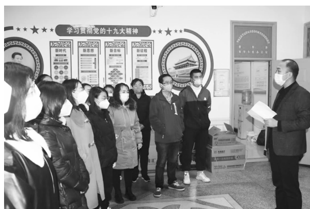
医务人员支援兰州新区方舱医院

疗服务，通过华池县人民医院服务号、“健康甘肃”APP 实现分时段预约诊疗和线上问诊服务。为 PCR 实验室增加 32 孔全自动核酸提取仪 2 台、荧光定量 PCR 仪 3 台、微孔板振荡器 4 台、移液器 20 把、八道移液器 3 把、迷你离心机（32 孔）10 台、台式自动脱帽离心机 2 台，增加实验室服务能力，日单管检查能力提升到 2208 人份，年内完成核酸采集及检测 136 万人份。先后派出 142 人次支援天水、镇原、宁县、兰州等地疫情防控工作，均圆满完成支援任务。