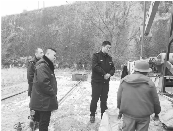
开展油区环境安全执法检查

发环境事件应急处置能力。加强环境信访问题办理，受理办结群众信访举报案件 13 起，并向投诉者及时反馈办理结果。