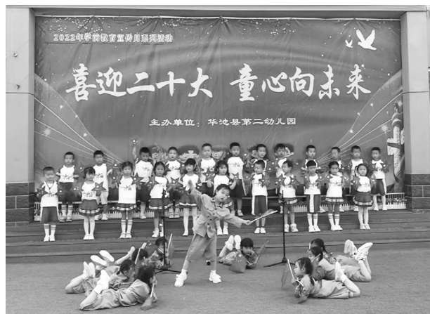
“喜迎二十大 童心向未来”红歌比赛

儿爬、钻、平衡、攀爬等各种基本动作，又把红色文化教育理念渗透到孩子幼小的心灵。晨、午接待时间，各班老师带领孩子们开展学唱《童心向党》《红星闪闪》等红歌活动。以国庆节、喜迎二十大为契机，开展“喜迎二十大 童心向未来”红歌比赛等系列主题活动，培养幼儿爱党、爱祖国的真情实感和民族自豪感。讲红色故事，演红色剧本，接力红色之使命。党员带动年轻教师每人精心准备一个经典的红色故事，每周三下午的阅读时间轮流走进各班教室，给全国孩子们讲述《鸡毛信》《小萝卜头》《刘胡兰》《一件棉衣》等经典红色故事。