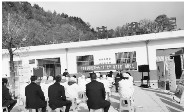
建行华池支行在五蛟镇举行“建行大学·裕农学堂”揭牌仪式

开放母婴室，方便母婴群体灵活使用。筹措资金、物资开展助学防疫捐赠活动，本年度为县第一中学学生累计发放奖学金 51000 元；通过县红十字会向县公安局、柔远镇捐献防疫物资 30000 元。