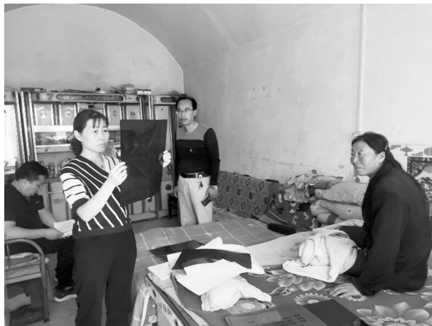
组织县评残委员会医师为重度残疾人上门办证

证残疾人基本状况调查培训班，培训乡镇（社区）数据录入人员 34 名，乡镇培训村级数据录入人员 111 名。全县共调查残疾人 6785 人，其中完成动态数据录入 6671 人，查无此人 0 人，已搬迁 22 人，空挂户 0 人，外出 57 人，注销 35 人，迁移 0 人。入户采集 6464 人，电话采集 207 人，入户率为 96.9%。召开“华池县残联第七届主席团第五次会议”，增补主席团委员 4 名、调整县残联第七届主席团主席、副主席、推举产生县残联主席团执行理事会理事长，确定新一届县残联领导集体。为夯实乡镇、村社区残疾人组织，对 5 名不适应岗位要求的乡镇、村社区部分残疾人专职委员进行更换，利用网络平台开展残疾人专职委员业务培训，提高专职委员业务水平与基础设施建设。争取资金 41.31 万元，对办公楼暖气管网、对外服务大厅、办公室、档案室等办公设施进行升级改造，建立视频会议室。讨论形成华池县“十四五”残疾人保障和发展规划初稿，向各乡镇人民政府、县残工委各成员单位发放征求意见稿 43 份，收到意见建议 40 条，采纳 15 条。完成华池县“十四五”残疾人保障和发展规划（审议稿），5 月 31 日经十九届华池县人民政府第 10 次常务会议审议通过印发。制定出台《华池县残疾预防行动计划（2021—2025 年）》，为残疾人事业有序推进奠定坚实的基础。助残日宣传文体活动。举办第三十二次“全国助残日”活动，为康复防疫器具、生活用品和临时救助受捐赠对象发放康复物资，提升残疾人事业在社会的影响力。举行残疾人政策宣传活动，联合县残工委 10 个成员单位通过悬挂横幅、设立宣传台等方式，发放残疾人政策宣传单 500 余份。利用“爱耳日”“爱眼日”“残疾预防日”等残疾人重大节日，开展残疾人优惠政策和残疾预防知识宣传，发放宣传手册和传单 1000 多份。组织 7 名残疾人运动员参加“甘肃省第十一届残疾人运动会”，喜获金牌 9 枚，银牌 8 枚，铜牌 2 枚。