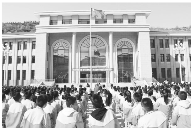
首届亲子阅读活动

举行学生才艺大赛，给学生提供展示自我、展现才艺的舞台；开展“我爱南梁”“寻年味”等活动，让生活进入课程，让课程回归生活。亲子阅读、读书漂流、童话乐园等阅读课程丰富学生精神生活；举行“习爷爷教导记心间，争做新时代好队员”主题队会；结合课程特点，化学教师举行禁毒知识进课堂，生物教师组织食品安全讲座，学生策划，自我展示；开展“大手拉小手”科学实验教学活动，中小學生同坐一室，让学生人人为师，个个可学。在教学实践与创新中，打破学科壁垒，丰富课程内涵，开发出科学素养、人文素养、身心健康、生活实践、拓展延伸五大类29种课程，形成“1+5”课程体系。