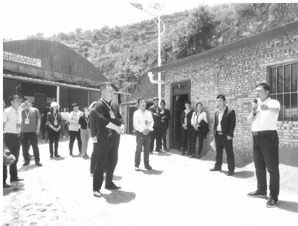
开展“助力乡村振兴·人大代表在行动” 专项调研活动

【廉政建设】 坚持以“六项活动”为抓手，以“两型机关”创建和优化营商环境为契机，深入推进干部作风整改，年内共学习党风廉政建设相关内容6次、党委书记讲授党风廉政建设党课1次，召开干部警示教育大会2次，职工集体学习党风廉政建设内容8次，干部廉政法规知识测试1次，开展集体廉政谈话2场次，提醒约谈9次，工作约谈35次，开展重点工作专项监督检查10次，交叉检查2次，组织乡村组干部收看警示教育片《零容忍》《心存侥幸“赌”人生 监管缺失“责”难逃》《变质的一线总指挥》3场次，整改督查反馈的问题10个。依托“百名干部帮百企”行动，为企业帮办实事26件，接访解决群众反映问题45个。