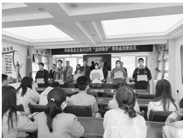
华池县总工会 2022 年“金秋助学”资助金发放仪式

学校 124 名困难职工子女，送去价值 1.86 万元的书包、钢笔、跳绳等学习用品。5 月初，向华池一中、县职业中专及企事业单位下发《关于做好 2022 年“金秋助学”活动的通知》，并在县总工会公众号转发，年内救助困难职工子女 120 名，资助资金已全部发放到位。开展“夏送清凉”慰问活动。对 1200 余名县城环卫工、交巡警、新就业形态中的大货车司机、快递员、外卖送餐员，承担省、市重大项目等户外一线职工进行慰问，送去白糖、菊花茶、绿茶、口罩等价值 12 万余元的防暑降温及防疫用品。