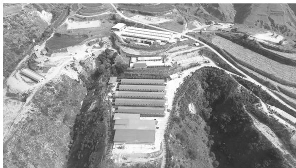
华池县天云农业发展有限公司

农业保险任务，扎实推进农业保险“增品、扩面、提标、降费”。全县签单实施12个保险品种，投保农户2.27万户，实现签单保费2326.18万元，建立由农业专家、保险机构、县乡政府、村组干部组成的高效理赔机制，科学评估、合理定损，理赔1640.82万元，受益农户2550户。争取省级农业发展（救灾）资金290万元，分配到五蛟镇、城壕镇等受灾乡镇，由乡镇采购物资发放到受灾农户和合作社，支持其恢复农业生产，确保不发生因灾返贫。