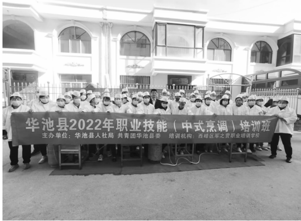
2022 年青年职业技能提升培训班开班

【志愿服务】 携手长庆油田采油二厂在南梁举行“地企青年志愿行，青春建功二十大”学雷锋志愿服务活动，动员 100 多名志愿者开展创卫文明进景区、志愿服务一条街、雷锋精神进校园服务活动；开展“守护家园践初心 青年先行担使命”志愿服务活动，带领团员青年进社区、走卡点，下发防疫知识传单 5800 余份，卡点志愿服务 38 次，核酸检测点服务 80 余次。招募储备青年志愿者 5000 余人，发动 3000 余名青年志愿者组建 16 支青年突击队，116 支青年志愿者队伍开展常态化疫情防控工作，累计志愿服务时长超过 12000 小时，向全社会募集物资 38 万余元，用于助力全县常态化疫情防控工作；组织志愿者开展新春送对联活动，向余家台易地搬迁小区群众送去春联 200 余副、福字 100 余张，窗花 50 余张；开展“爱心助力高考，提升服务效能”阳光送考活动，为考生免费提供纯净水、文具，组织 30 多辆免费接送车辆，设立“圆梦大学”助学资金咨询点，解决困难家庭子女入学问题；争取油田资金 20 万元，为全县 460 名困难老人购买“温暖包”，450 名留守儿童购买“爱心包”，450 名留守妇女购买“温暖包”，用实际行动关爱弱势群体；开展“青联委