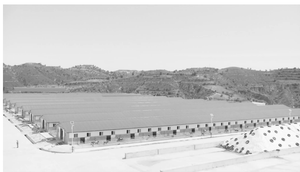
城壕镇太阳村黑山羊保种育种基地养殖棚圈 (彩票公益金项目)

7111 人，持续提升农村供水保障水平。兜底保障。严格执行社会救助兜底保障政策，适度扩大城乡低保、特困供养等政策覆盖范围，确保困难群众基本生活保障到位。累计发放各类救助资金 9821.18 万元，保障农村低保对象 3923 户 11094 人、特困供养 574 户 712 人、孤儿 68 人、事实无人抚养儿童 162 人、残疾人“两项补贴”4185 人次、实施临时救助 11065 人次。光伏帮扶。全力做好村级电站及户用电站收益分配结转工作，建立部门监管、专业维护、日常管护“三位一体”的运行管理模式，村级电站结转收益资金 1979.55 万元，其中发电收入 760.68 万元，财政补贴资金 1218.87 万元，除去各项税费、土地流转费及运维管理费外，已拨付到 56 个确权村 1174.62 万元。改建户用光伏联建电站 170 户，设置光伏扶贫项目公益性岗位 1016 个，累计发放公益性岗位工资 479.58 万元。小额信贷。持续推进小额信贷政策落地落细，截至年底，累计发放脱贫人口小额信贷 4176 户 1.7986 亿元（2022 年发放 2603 户 1.081 亿元），贷款余额户数占脱贫户和边缘易致贫户数的 45.1%。