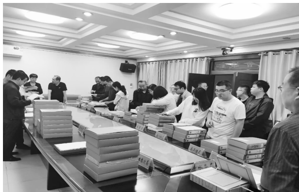
7月22日，市人大常委会执法检查组检查全县《中华人民共和国乡村振兴促进法》贯彻落实情况

询、医疗服务、就业培训、产业开发等活动共32场次，帮助困难群众解决实际问题，助力全县乡村振兴。采取专题培训、以会代训、寄送资料等方式，不断提升代表参政议政的能力和水平。针对疫情对代表培训工作的不利影响，印发《关于对各级人大代表开展分散培训的通知》，组织各级人大代表依托乡镇“人大代表之家”、村级“人大代表工作站”和代表活动小组等采取分片观摩、组织调研、学习研讨等方式开展培训。年内累计开展各类学习培训45场次，培训代表800多人次。为代表订阅《人民之声报》，配发《地方组织法、选举法、代表法导读与释义》《新时代人大代表履职手册》等学习资料1100余本，让代表在“干什么、怎么干”上去思索、去实践，激发代表履职尽责的积极性和主动性。