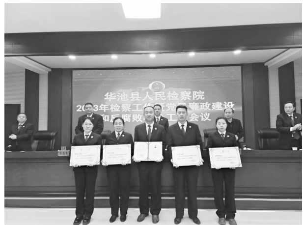
2022 年度全市检察工作先进个人颁奖现场

落实廉政制度的检查、督促，从严防控司法办案廉政风险。开展“服务型效能型”机关创建工作，提升检察服务效能。狠抓“三个规定”落实，记录报告 19 件，“逢问必录”的政治自觉正在形成。密切与人大代表、政协委员联系，建立走访联络机制，集中走访各级代表委员 27 人次，接受调研视察、案件听证、庭审观摩 11 人次。切实强化检务公开，完成检察听证室建设，选聘听证员和特邀检察官助理 26 人，依法公开听证案件 87 件。在各类媒体上刊发宣传稿件 112 篇，“两微一端”推送检察信息 523 条，以公开倒逼公正，不断提高检察工作开放度和透明度。深化能力素质建设，开展网络培训 235 人次，选派 1 名检察官到国家检察官学院培训，4 名检察官助理到县法院跟班学习，实行外出培训人员上讲台制度，达到“一人培训、全院学习”的目的。