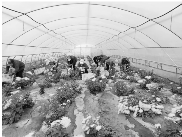
工人采摘金丝皇菊

79 户 173.94 万元，办理续贷 41 户 111.6 万元。村集体经济收入。荔园堡村村集体收入 23.02 万元，高台村 36.83 万元，白马庙村 5.08 万元。项目库建设情况。按照“村申报、乡审核、县审定”的流程和“县级巩固拓展脱贫攻坚成果和乡村振兴项目库建设流程图”进行项目库申报。对 2022 年巩固拓展脱贫攻坚项目库进行调整完善，涉及农业、畜牧、基础设施建设等四方面 20 项内容，衔接项目资金 3634 万元，所有项目均如期开工实施，资金支付进度 100%。帮扶项目资产登记管理。对 2021—2022 年各类帮扶项目资产进行确权登记，签订《资产移交书》，建立帮扶资产管理制度，明确镇村“第一责任人”职责。建立帮扶项目资产管理台账，由专人负责登记，防止村级资产流失。乡村建设情况。全镇 3 个村全部为省级乡村建设示范村，建有生活垃圾填埋场 1 处、生活污水处理站 1 座。紧盯三大类 23 项指标，补齐农村基础设施短板。扎实开展“543”人居环境提升行动和红色民居改造行动，在白马庙村和高台村实施“543”农村人居环境改造提升 200 户，落实补助资金 556 万元，在荔园堡村实施红色民居改造 122 户，落实补助资金 610 万元。开展厕所、垃圾、风貌“三大革命”和全域无垃圾专项整治行动，对庄前屋后“三堆五乱”“乱堆乱放”进行集中清理整治。年内清理垃圾 85.7 吨，整理柴垛 345 个，清洁道路 32.5 公里、河道 40 公里，回收废旧地膜 32 吨。生态护林员。对全镇公益性岗位进行全面摸排，对于不符合要求的及时更换，真正发挥就业一人、脱贫一户、带动一方的辐射作用。全镇现有生态护林员 80 人，年稳定增收 8000 元。“岗位大练兵、业务大比武”活动。年内集中开展理论知识学习 20 余次。组建参赛队伍 4 支，开展“岗位大练兵、业务大比武”活动 1 次。农村留守老人妇女儿童和特困群众关爱服务行动。组织镇村组干部、志愿服务队，参与农村“三留守”人员和特困群众关爱服务活动 21 余人次。