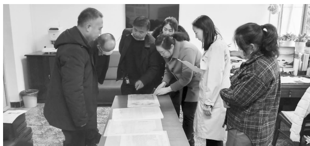
县档案馆档案鉴定小组接收红色档案

筹库房、清查库存、重排柜架等措施挤出库容，接收进馆司法公证档案、统战档案及党史学习教育档案等共计3000余卷件。抓好“两类档案”归集。在全面完成脱贫攻坚档案归集的基础上，部署“回头看”进行检查问效，督促重点部门做好常态化疫情防控档案的收集工作，年内共接收30余个县直单位和乡镇“两类档案”电子目录，并建立目录数据库，实现文件级目录快速检索。加强档案征集编研。针对干部人事任免、调动等群众利用率高的档案，进行复制整理、编印成册，不断提高档案社会利用率。先后征集到老县城掠影等珍贵照片档案4386张、解放前陕甘宁边区政府土地证、通令等红色实物档案4件，制作和打造党的十九大代表、抗疫英雄个人荣誉展柜2个。持续推进档案数字化。依托兰州四方同创科技公司软件平台及技术指导，提升档案数字化水平，通过外包扫描、著录等工作，年内完成档案扫描15万余幅，挂接8000余条。