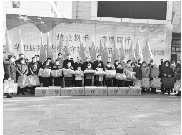
举办“地企携手 志愿同行”关爱农村留守老人妇女儿童和特困群众服务活动

员走基层 学习宣传贯彻二十大”关爱行动，向山庄小学、乔川杨湾湾小学困难学生捐赠了书包、彩笔等学习文体用品；开展“传递爱心 情暖六一”系列慰问活动，赴杜右手小学、温台小学、上堡子小学、刘家畔小学开展慰问，送去校服、文具、图书等物品；开展“团县委党支部关爱行动”，为全县快递企业捐赠 1.5 万元物资，慰问快递从业人员。