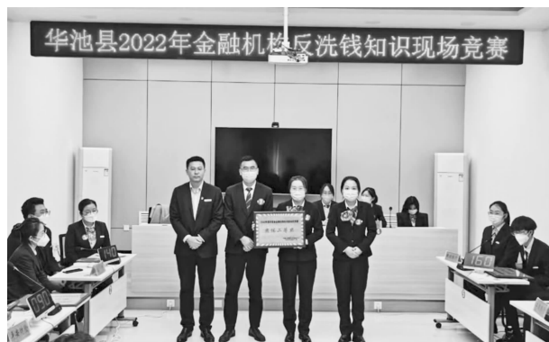
华池县 2022 年金融机构反洗钱知识现场竞赛

履行党员义务，落实党员责任，带头开展不良贷款清收工作。发挥党支部战斗堡垒作用和党员先锋模范作用，推动党建业务融合互促。全年共组织党员开展集中学习研讨 12 次，讲授专题党课 4 次，交流心得体会 2 次，开展主题党日 12 次，知识竞赛 1 次，组织生活会 1 次，民主评议党员 1 次。