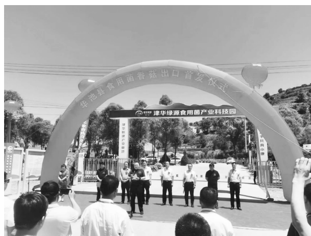
6月14日，食用菌香菇出口首发仪式

APP平台并上架各类组合套餐，引导群众线上下单，线下配送，提高物资供应效率。疫情期间，各类外卖平台配送7315单。对县城23个片区建立熟食保供微信群，制作线上配送流程图，全力服务疫情一线工作人员，保障隔离点居民生活正常有序。启动生活必需品日报制度，对县城10户保供企业，实行领导分户包抓制，每日对市场供给情况进行直观监测和预警，防止出现突发情况对本县生活必需品市场供给产生冲击和影响，确保群众生活必需品保质保量供应。