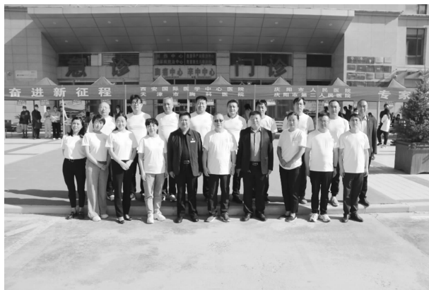
西安国际医学中心医院专家团队在 县人民医院开展义诊活动

【公益行动】 北京韩红爱心慈善基金会联合陕西省眼科医院，组织开展白内障复明手术53例；组织院内专家团队赴南梁、王咀子、上里塬、社区开展义诊活动4次，累计看诊患者800余人。