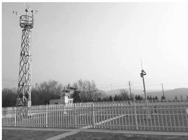
华池县国家气象观测站

气象监测站点（13套单雨量站，3套两要素区域自动气象站，2套四要素站，2套六要素站，8套国家自动站，1套土壤水分站，1套人影站，1套农田小气候仪），基本实现网格化布局，结合中国局的气象卫星、省市及周边市县多普勒雷达资料，对华池县境内天气实况及演变实现全方位监控，为县委、县政府及相关部门防灾减灾提供决策依据。