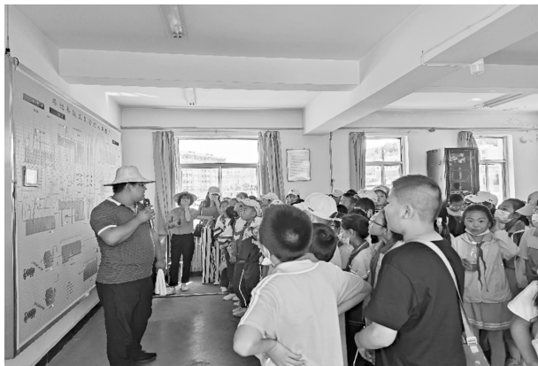
华池县污水处理厂开展环保设施向公众“开放周”活动

【生态环保宣传教育】 结合第 51 个“6·5”环境日宣传活动，围绕“共建清洁美丽世界”开展宣传纪念活动，设置咨询宣传台 2 处，现场发放《环保宣传手册》《环保生活小常识》《大气污染防治手册》《低碳生活宣传册》《中华人民共和国民法典》1000 余份。联合县污水处理厂开展环保设施向公众“开放周”活动，向公众宣传城市污水处理知识，提升公民的环保意识。拍摄制作“子午岭一物种的基因库，共建地球生命共同体”生物多样性保护主题宣传片。利用华池环保微信公