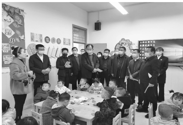
3月15日，市人大常委会调研组调研全县学前教育工作情况

文化资源保护和发展、全县“河长制”工作落实、监察监督全覆盖等工作情况开展专题调研，部分意见建议被省、市人大采纳。