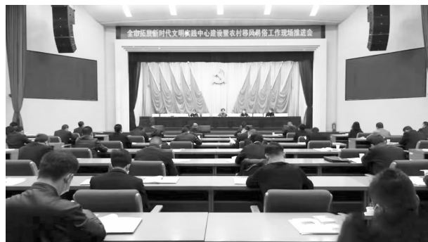
全市拓展新时代文明实践中心建设暨农村移风易俗工作现场推进会议在华池召开

化宣传长廊，设置大型户外宣传牌 38 个，景观小品 9 组 23 个，灯杆道旗 500 面，公交站亭宣传橱窗 52 个。深入开展身边好人、道德模范、新时代好少年等典型培育选树活动，建立全县 120 名先进模范人物典型库，推荐 4 人参加第八届甘肃省道德模范、13 人参加“庆阳好人”、6 人参加“新时代好少年”等先进典型评选，推出“中国好人”杜克宽、赵元瑞、李晓梅，甘肃省道德模范譙显明等先进典型，成为新时代华池人民崇德向善的重要典范。深化拓展新时代文明实践中心建设。深入贯彻中央、省、市有关精神，坚持全局谋划、分层推动，制定印发《华池县深化拓展新时代文明实践中心建设实施方案》《华池县新时代文明实践所（站）建设工作评估办法》等文件，整合项目资金，建成多功能、综合性、占地达 5700 平方米的县新时代文明实践中心，并以此为示范，推动乡、村以及企业学习新时代文明实践所站、基地建设，全县建成新时代文明实践中心 1 处、实践所 15 处、实践站 116 处、实践点 22 处。打造“红色文化型”南梁镇荔园堡村文明实践站、“工艺创作型”乔河乡文明实践所和“现代文化型”山庄乡文明实践所，实现新时代文明实践“一乡一特色、一村一品牌”，承办全市拓展新时代文明实践中心建设暨农村移风易俗工作现场推进会议。深入推进移风易俗破除陈规陋习。制定出台《华池县推动移风易俗树立文明乡风的指导意见》《华池县治理高价彩礼推动移风易俗考核办法》等文件，对婚嫁彩礼、礼金、宴席、烟酒等作出量化“限高”，组织党员干部带头签订《婚丧喜庆事宜新办简办承诺书》5000 多份，报备婚丧事 282 件。在“魅力华池”APP 开设文明华池专栏，宣传家教家风，抵制高价彩礼。指导 111 个行政村修订完善《村规民约》，完善村级协商民主议事“一约五会三榜两站”治理机制，采取“积分制+红黑榜+积分超市”，实行动态管理，带动民风社风转变，推动文明乡风建设。