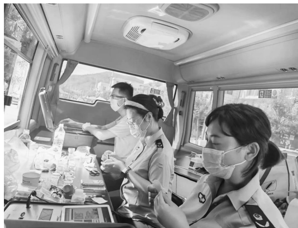
食品药品检验检测中心开展流动式食品检验工作

【食品安全监管】 遵循“四个最严”要求，严格落实“党政同责”，大力推进“食安华池”建设攻坚行动，严守冷链食品安全防线，全面推进省级食品安全示范城市创建。全面落实日常监管责任。出动执法人员 1600 余人次，检查食品生产经营主体 2500 余家次，对发现的问题全部督促整改到位。圆满完成“两会”、高考等 10 余次餐饮服务食品安全保障工作。完成食品及食用农产品抽检任务 380 批次，完成食品安全快速检测 6560 批次。严格校园及周边食品安全监管，检查中小学学校及幼儿园食堂 39 家 200 余户次，校园周边食品经营单位 60 家 500 余户次，当场发现问题 22 个，下发责令整改通知书 6 份。全县各乡镇共上报农村集体聚餐 80 起，流动厨师备案 46 人，对 300 余家食品经营单位负责人开展约谈。逐步推进“互联网+智慧监管”。年内，全县“互联网+”明厨亮灶、阳光仓储、透明车间加入单位分别达到 314、45、37 家。加强网上巡查和监督检查，网上巡查食品生产经营单位 1103 户次。强化专项整治。深入开展食品安全“守底线、查隐患、保安全”、侵害群众利益突出问题、校园及周边食品、农村集体聚餐、农家乐、农村假冒伪劣食品等多个专项整治行动，查办违法案件 9 起，收缴罚没款 2.2 万元，向公安部门移交案件 2 起。推进食品安全示范城市创建。分管副县长 2 次主持召开创建工作专题会议专题研究部署示范创建工作，县财政列支 30 万元全力保障食品安全创建工作经费。成立示范城市创建办公室，专门负责示范城市创建资料收集及审核上传工作。在辖区主干道、公交站台设置大型广告牌，普及发放宣传册，精心制作新媒体宣传视频，广泛开展宣传教育，有针对性地对经营单位进行全程指导，按照创建标准逐项规范，确定食品安全示范店 300 余户，食品安全示范城市创建工作已顺利通过省级评估验收。