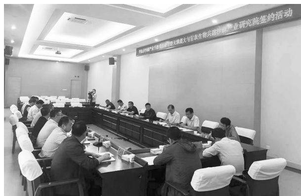
华池县沙棘产业升级项目研讨暨天津商业大学与甘农生物科技有限公司共建沙棘产业研究院签约

【科技合作交流】 促成沙棘产业升级项目研讨暨天津商业大学与甘农生物科技有限公司共建沙棘产业研究院签约，沙棘清汁项目在华池县落地生根；协调甘肃省农科院与华池恒烽中药材公司共建陇东（华池）中药材试验站；与天津北辰科技园区管理有限公司签订园区共建结对框架协议。