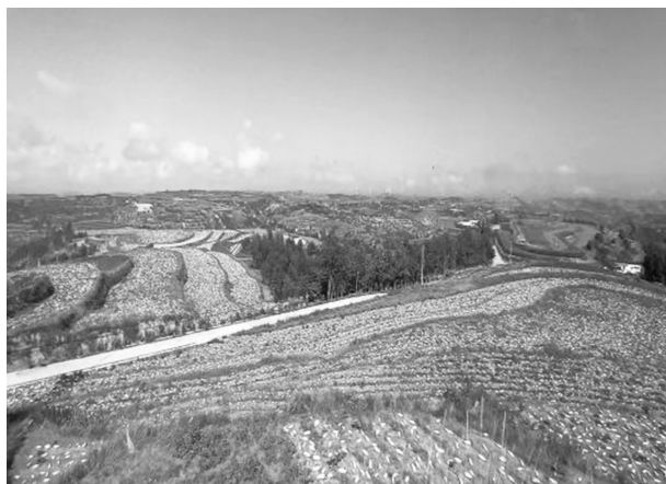
千亩白瓜籽种植示范点

棚圈25座。规范提升产业合作社4个，落实干部“一对一”机制，推动合作社进一步发展壮大，将80万元注入村内合作社、家庭农场，扩大养殖规模，年底按照股金的5%保底分红，壮大集体经济。