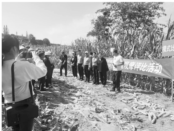
大豆—玉米套种观摩评比活动

圾分类屋 4 个，配套公交站台 1 处。利用中国化学工程第三建设有限公司捐赠 9.5 万元，为老年幸福互助院购买疗养器材 7 台，为柳湾中心学校学生购买校服 138 套；争取县人大办帮扶资金 35.5 万元，在黄岔村建成大豆—玉米套种示范点 1 处 500 亩，转移富余劳动力外出务工 241 人次；与县融媒体中心合作开展网络直播带货，累计销售农产品 18 万元；协调县科技局为张岭子村、黄岔村各落实 5 万元科技经费，为群众提供种养殖技术和就业技能培训 3 期 41 人次。