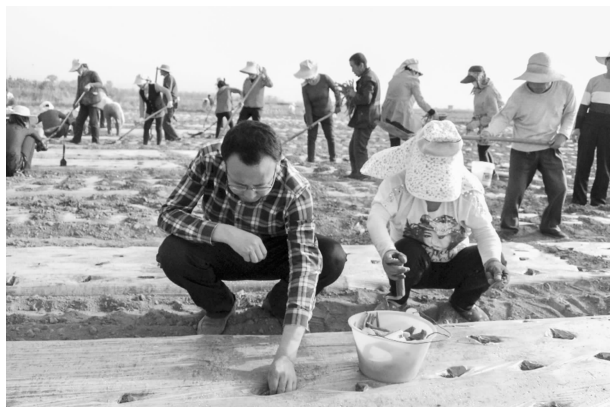
邀请农业科技技术员指导贫困户栽植中药材

业。新建养殖小区 2 处，新培育家庭农场和养殖大户 80 户，带动全镇羊只饲养量 3.2 万只。新增肉牛养殖户 20 户，带动全镇牛饲养量达到 2600 头。引进恒烽中药材公司，建成恒烽科研基地 1 处，打造杨岔万亩中药材种植基地 1 处，带动全镇种植中药材 26235 亩，在黄岔、张岭子等村种植大豆—玉米带状复合试验种植 1478 亩。全镇 21 个合作社完成分红 57.6 万元。