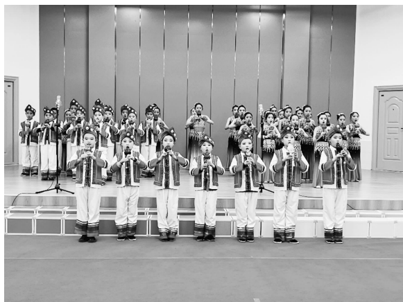
艺术类素拓课程（葫芦丝社团）

【学生社团】 不断丰富“品优艺术”素拓课程，促进学生全面个性发展。依据教师专业特长及学生兴趣爱好，为学生设计艺术、体育、语言三大类24门素拓课程，包含绘画、书法、沙画、手工、童泥、葫芦丝、口风琴、合唱、舞蹈、啦啦操等艺术类素拓课程，跳绳、篮球、足球、软式棒垒球等体育类素拓课程，朗诵、快板、英语情景剧、读书等语言类素拓课程，并开发素拓教材18本。学生自主选择素拓社团，参与率达到100%。