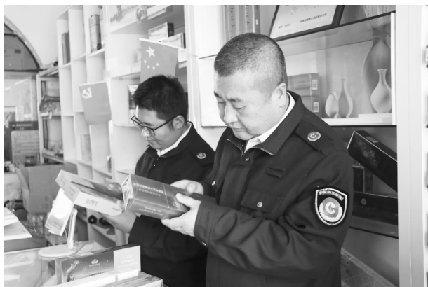
县烟草专卖局稽查人员检查市场

环境，县局联合教育、公安等部门贯彻落实校园及周边安全隐患排查整治工作，在县柔远初中、县第一中学开展“远离卷烟、电子烟，让校园更美好”的主体宣传活动，号召未成年人拒绝烟草、拥抱健康。