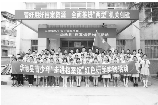
青少年“走进档案馆”红色研学实践活动

【党建工作】 以县委十八届第二轮巡察和学习贯彻党的二十大为着力点，牢固树立大抓党建的鲜明导向，坚持把党建作为“一把手”工程，落实党建主体责任，打造支部阵地。按照争创五星级党支部建设标准，查缺补漏，规范设置党员示范岗，发掘先进典型，推动党支部建设工作提速增质。创新挖掘功能定位，变“空白地”为“党建栏”，精心设计“小台阶大纪事”、心愿树、党员风采等红色资源文化宣传阵地。坚持请进来与走出去相结合，先后举办县委机关党委庆“三八”女职工爬山比赛、“档案馆开放日”“走进档案馆”“红色印记”档案展览等活动5场次，参与人数2000人次。