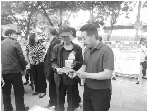
《信访工作条例》宣传

【信访基础业务规范化】 对照“六清六准”工作标准，认真做好信访事项受理、办理、督查督办、复查等各个环节工作，力求使每一个环节的工作都精准到位、经得起检验。落实首接首办责任制。推行信访事项谁接待、谁登记、谁办理的工作机制，及时登记、受理、协调办理群众反映诉求。实行信访事项分流办理。每周五汇总分析，重点信访事项落实转办、交办责任，同时对涉法涉诉信访问题、重大特殊疑难信访问题、反映强烈的群体性信访问题，召开信访工作联席会议，协调涉及单位及属地乡镇共同协调解决，推进信访事项高效化解。推行跟踪问效机制。接待受理、分流办理的信访问题，按照办理时限要求，由首次接待工作人员进行跟踪，督查督办室按期督办，准确把握办理情况及结果，及时答复信访人。规范信访事项复查程序。按照信访事项复查规定受理，强化对信访事项实体性的审查，及时监督纠错。加大法治宣传力度，宣传引导群众依法有序上访，形成依法办事、依法维权的良好氛围。