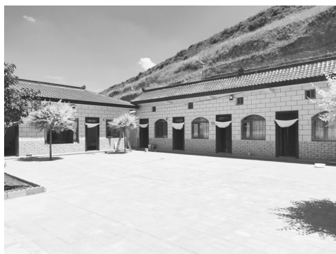
高庄组居民点人居环境改造

【乡村建设】 基础设施建设。建设示范村高庄村，硬化村户产业路0.9公里，砂石路4.2公里，新建污水二级管网125米，完成护坡611米，安全挡墙124米，新建应急避护场所1处，安装太阳能路灯206盏、卫生厕所38座。结合苗木清退工作，安装木质篱笆200余米。完成郭畔、店岷岷等20户集中沿线农户村容户貌提升。乡村治理。全面推行“411”议事法、“一约五会三榜两站”和网格化管理机制，建立“行政村党组织—网格（村民小组）党支部（党小组）—党员联系户”的三级网格化体系，聘用基础网格员71人，督促落实网格员“八大员”职责，提升乡村治理成效。人居环境整治。引导群众参与环境卫生整治，对绿化带杂草、房前屋后乱堆乱放进行清理，确保村容村貌干净、整洁、有序。全年共投劳580余人次，机械10台，清理生产生活垃圾42吨，拆除违规广告18处，拆除乱搭乱建棚架5个，整修涂白行道树50公里，回收废旧地膜10余吨。