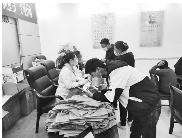
精神抑制类药物发放

项目。争取天津北辰区东西部协作残疾人帮扶资金20万元。为70名困难精神残疾人人均发放精神抑制类药物900元左右，价值6.36万元；为210户困难残疾人家庭每户发放康复防疫器具1套，价值8.862万；为乔川乡杨湾湾村、徐背台村21户困难残疾人家庭每户发放土蜂3箱、蜂箱1个、摇蜜器1台，价值4.778万元；受益残疾人301名。