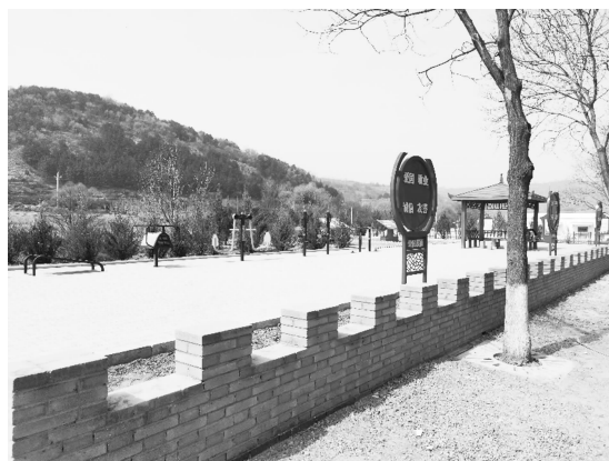
红色主题文化广场

【环境整治】 开展“三清二改一管护”村庄清洁行动，抢抓乡村建设风貌改造项目，动员农户实施“543”村容户貌提升项目，共实施“543”改造户122户、红色民宿改造户78户。召开会议专项部署全乡全域无垃圾专项治理工作，制定《林镇乡2022年全域无垃圾专项治理工作实施方案》。动员500多人、42辆机械参与全域无垃圾治理，共清理垃圾2200余吨，拉运污水2000余方。抓实省环保督察反馈问题长效整改，加强对辖区企业、工地、农田巡查检查，督促实施降尘、扬尘和还田控制；严格落实河（湖）长制，加强饮用水水源地规范化管理；严格管控垃圾、秸秆焚烧，空气环境质量优良。