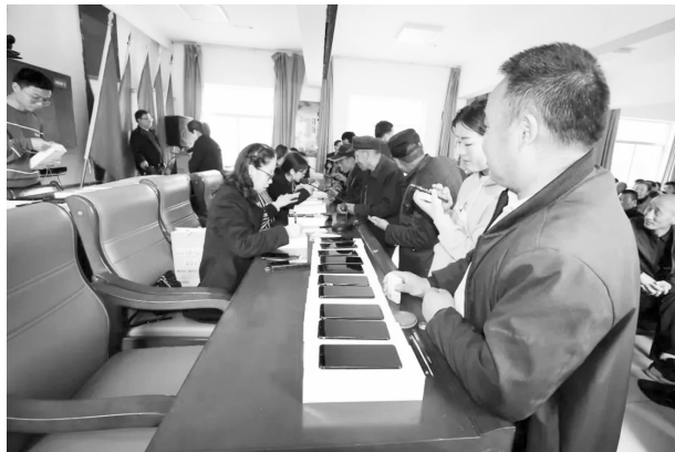
为网格员配发专用手机

力。完成市域社会治理云平台一期项目建设，整合部门信息资源，初步实现智慧小区、智慧治理、智慧网格等智能化服务管理，为“智慧华池”建设奠定坚实的基础。