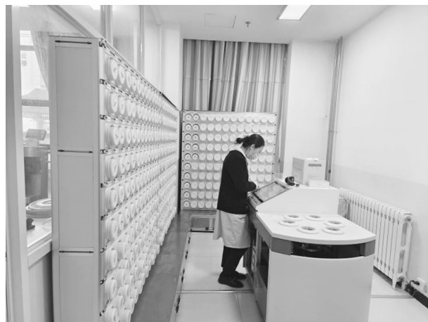
新中药制剂——中药颗粒剂膏方

【中医药工作】 按照市卫健委《关于印发2022年中医药传承创新建设工程项目实施方案的 通知》文件，实施针灸康复科创建省级中医药优势专科；老年病科、心病科创建市级中医药优势专科、建成曾明言名老中医传承工作室、骨伤、肛肠创建为市级重点中医药专科；建成全县中医药适宜技术推广中心，提升医院的中医药服务能力。各临床科室开展耳尖放血治疗高血压等50余项中医适宜技术的培训和推广工作。开展电针、平衡针、温针灸、小针刀等中医药特色诊疗服务技术50项。开展中医护理服务18项。推广国家中医药管理局制定的22个专业105种疾病的临床路径和诊疗方案。派出2名人员在天津市北辰医院、庆阳市中医医院进修针灸推拿专业技术，派出2名本科毕业生到省中医院参加住院医师规范化培训。开展中医治未病服务工作。销售全成分颗粒中药饮片、膏方颗粒剂328.2万元，提升中医药使用率，方便群众服用中药。非药物治疗人次占门诊人次的15%以上，门诊处方中药处方占比在60%以上，中药饮片处方占门诊处方的30%以上，中药饮片人次占门诊人次的50%以上。严格执行中药饮片采购、验收入库制度，合格率达到100%，每月集中开展1次中药饮片处方点评工作。开展中医药文化宣传，在康复科、门诊大厅宣传中医药文化知识，营造浓厚的中医药文化氛围。