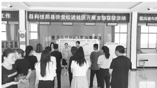
8月4日，县委党校进社区开展支部联建活动