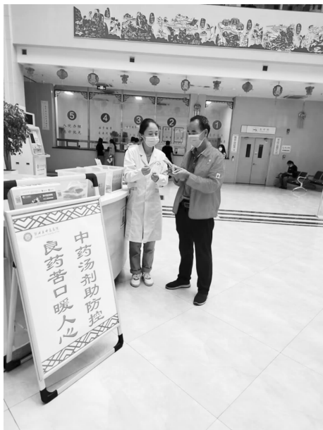
为患者发放预防治疗新冠甘肃方剂

【诊疗业务】 全年共收治住院病人 7014 例, 开展各类手术 741 例, 抢救疑难危重病人 73 例, 诊治门诊病人 9.4 万人次, 平均门诊费用 248.5 元, 平均住院费 2983.4 元。中医药使用率达到 98% 以上。