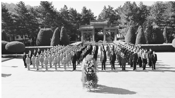
9 月 30 日烈士纪念日，在南梁革命烈士纪念碑前举行全县公祭仪式

【干部队伍能建设】 健全完善机关管理制度 34 项，坚持用制度管人管事，强化约束力，提高执行力，形成解决问题、推动发展的长效机制。组织开展理论学习中心组学习 12 次、集中学习 50 次，撰写心得体会 60 余篇、调研报告 8 篇，人均抄写学习笔记 5 万余字，召开“全面从严治党暨党风廉政建设工作”专题会议 3 次。结合“法律政策落实年”活动，开展“岗位练兵”，举办全县退役军人事务系统业务培训班 1 期，保密知识培训班 1 期，组织参加退役军人保障法知识竞赛和线上、线下保密知识竞赛、政治理论知识测试及学法培训考试 8 次。结合优化营商环境工作，深化“服务型效能型”机关创建，改进作风抓实效，坚决做好退役军人政策法规的贯彻落实工作，全力提高服务效能，优化退役军人服务领域营商环境，做到工作快部署、任务快落实、目标快完成。