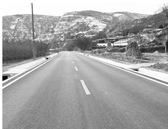
S506 线孙家湾至白马公路工程（华池段）

镇签订《2022 年度农村公路建设养护管理目标责任书》，靠实乡镇、村各级的养护责任。参与“7·15”抗洪救灾，针对强降雨水毁道路情况，成立专班开展灾害统计汇总、登记造册工作，通过核实水毁路线、桩号、类型、数量和水毁损失情况，按照“先重后轻，先通后畅，先干后支，远近结合”的原则，先后对悦阜、悦王等受灾比较严重的塌方、沉陷等水毁路段进行维修处治，确保群众出行畅通。全年投入养护维修资金 1820 万元，完成 8 条 196.4 公里县道的养护维修及应急抢险任务。按照《农村道路安全隐患突出路段治理重点攻坚项目实施方案》要求，抽调人员配合交警部门完成平交道口和 Y 型路口“五必上”、隐患路段“三必上”摸排任务，共排查道路隐患 28 处，已全部采取工程治理措施予以整治，消除道路安全隐患。