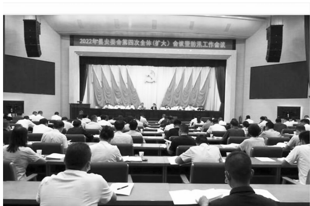
2022年县安委会第四次全体（扩大） 会议暨防汛工作会议

协调作用，紧扣安全生产运行季节规律，全面安排部署，针对重要节点提出具体要求，主动作为落实方案措施，检查全面深入，做到守土有责。年内先后开展“五一”、端午节、中秋节、国庆节等安全生产大检查7次，出动检查人员200余人次。深入推进行业领域专项整治。集中利用100天对重点行业领域开展一次专项整治活动。开展危化品除隐患保安全“百日攻坚”专项整治、大排查大整治“百日攻坚”、安全隐患排查整治“百日行动”等专项整治活动，集中对非煤矿山、危险化学品、道路交通、建筑施工、消防等重点行业领域进行整治，共排查出隐患685条，整改680条，正在整改5条，整改率99.2%，罚款8万元。严格落实重大安全隐患县级领导挂牌督办和交办部门整改制度，对上年度未完成整改及2022年新摸排出的26条（县级领导督办8条，交办部门整改18条）重大安全隐患和问题，以文件形式印发县级督办领导和交办部门。采取“双随机、一公开”方式，对华池县职业中等专业学校重大火灾隐患进行挂牌督办，已整改销案。