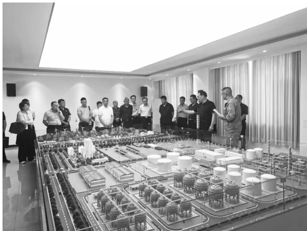
县政协调研组调研华池县绿源石油伴生气分离厂

【视察调研】 紧扣县委、县政府决策部署和全县中心工作，调查研究，务实协商建言。组织委员就现代农业产业体系建设、义务教育阶段学生营养改善及学前教育发展、医疗人才队伍建设、高质量推进招商引资工作等进行专题视察调研4次，调研报告均被县委、县政府主要领导批示采纳。配合市政协完成社区网格化管理、能源化工基地建设、“再造一个子午岭”提质增效行动、农业产业现代化建设视察调研4次。