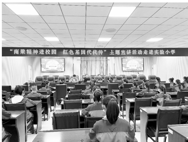
5 月 13 日，“南梁精神进校园 红色基因代代传”主题宣讲活动走进实验小学

战线政策提出 100 周年暨陕甘边革命根据地统战工作学术研讨会”筹备工作（已征集理论文章 113 篇），力争使文艺创作有内涵、接地气、出精品；紧扣市场需求，依托甘肃南梁红培旅游服务有限公司职能优势，与市、县邮政公司合作完成新馆原销售区改造提升，南梁红色主题邮局 6 月 20 日对外运营后累计推出特色产品 4 类 60 种，主要有纪念币、虎年生肖币、红色图书及特色文创产品等，与兰州大学深化校企合作，着力打造纪念馆特色 IP 形象。