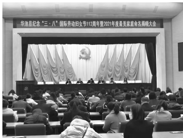
华池县纪念三八国际劳动妇女节112周年 暨2021年度最美家庭命名揭晓大会

成员5名、“移风易俗”最美家庭10户，争创省级示范“妇女之家”1个，推荐上报全市最美家政人3名、平安家庭示范户10户。推荐2022年度全省美丽庭院示范村1个、美丽庭院示范户8户，全市最美家庭5户、美丽庭院示范村1个、美丽庭院示范户20户，表彰2022年度“优秀巾帼志愿者”4名。组建华池县家庭教育宣讲团，线上开展家庭教育宣讲5场次，组织家长观看“家家幸福安康”公开课、“家风润陇原·幸福千万家”家庭教育公益巡讲、家庭教育公开课22场次，印发《家庭教育促进法》宣传册6000份。开展“推荐一本好书·打造书香家庭”线上读书分享交流活动8期，对参与活动的师生进行赠书，其中1户家庭作品在“少年儿童心向党·用心用情伴成长”甘肃省家庭亲子阅读大赛高年级组中获第4名。县教育局被评为“全省实施妇女儿童发展规划先进集体”。