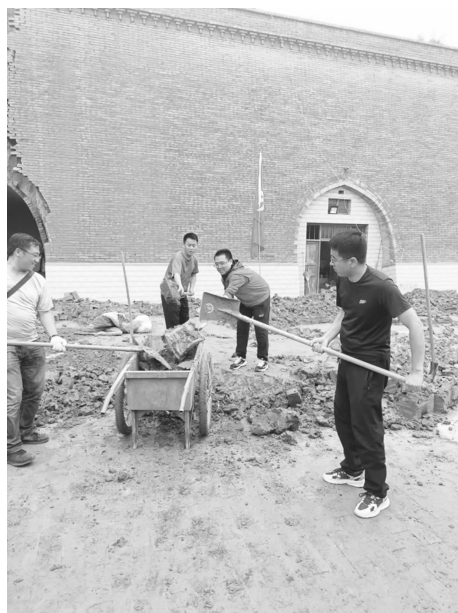
支行职工帮助受灾农户清理院内淤泥

分行员工合规承诺书；开展员工警示教育，观看《零容忍》《清廉文化建设警示案例展》等警示教育片，以案为鉴，引导全行员工牢固树立合规意识。年内未发生不合规案件。开展重点领域风险学习和检查，本年度未发生准风险事件和风险事件，未出现高风险柜员，未进入过高风险网点序列，上半年网点运营风险等级均为A-级。开展加强内部管理反思大讨论活动。通过学习、思考和讨论，进一步熟悉制度管理规定，强化员工的纪律合规意识。扎实做好安全保卫工作。加强全员安全教育，定期学习安全保卫制度和案例，牢固树立安全第一的意识；开展安全保卫履职和应急演练工作，提升员工安全防范意识和应急处置事件能力；对重点区域和重要设施进行日常安全排查，消除安全隐患，与全体员工签订安全生产暨安全保卫工作责任书，将安全责任落实到人，确保网点安全运营。