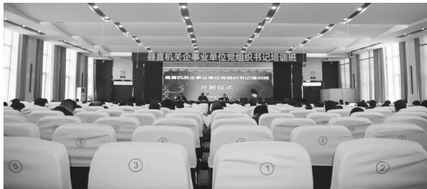
4月27日，县直机关企事业单位党组织书记培训班开班

施，持续开展跟踪问效。对县直机关党员入党问题开展专项核查，共审核党员档案982件，梳理整理出3个方面15项问题，指导各机关党委（党总支）开展复核和问题认定。开展清查整治突出问题规范党务工作，督促县直各级党组织对照文件中7个方面45项具体问题逐个认真清查，靠实责任，确保清查不留死角。