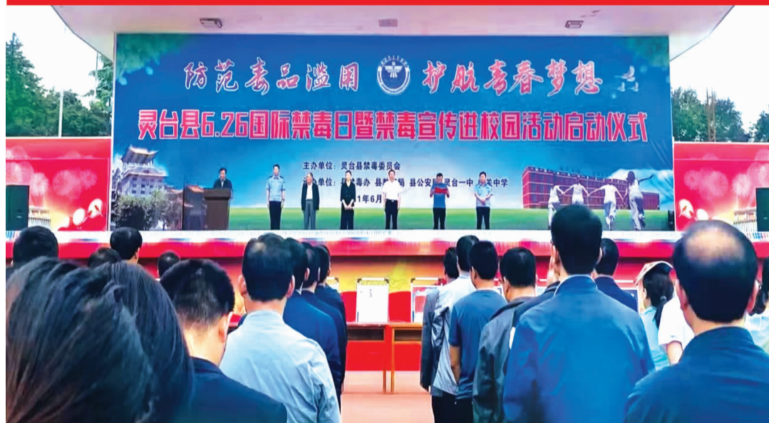
灵台县禁毒宣传进校园活动