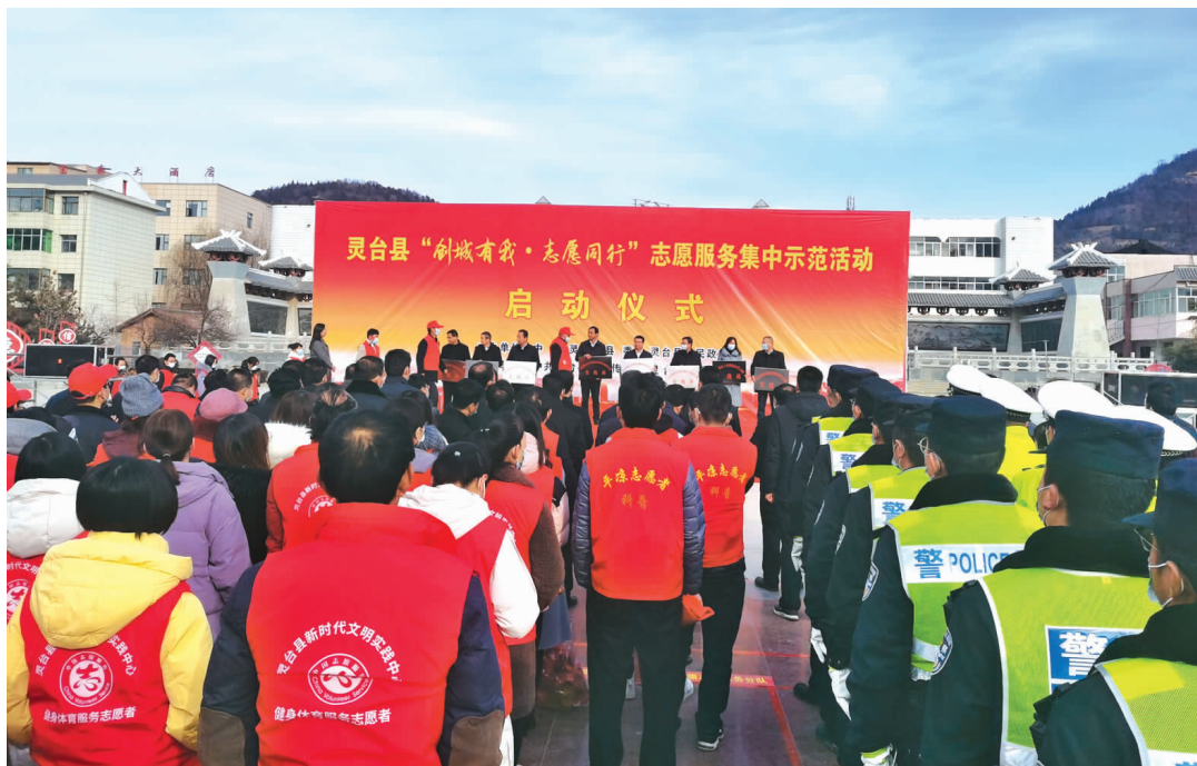
灵台县“创城有我·志愿同行”志愿服务活动