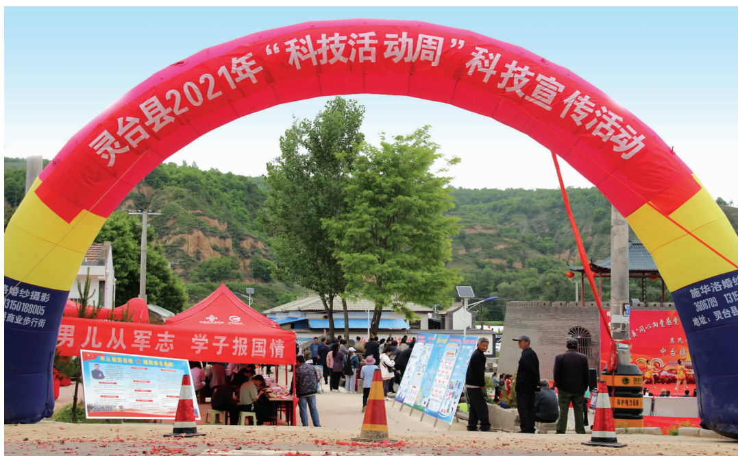
灵台县科技活动周宣传现场