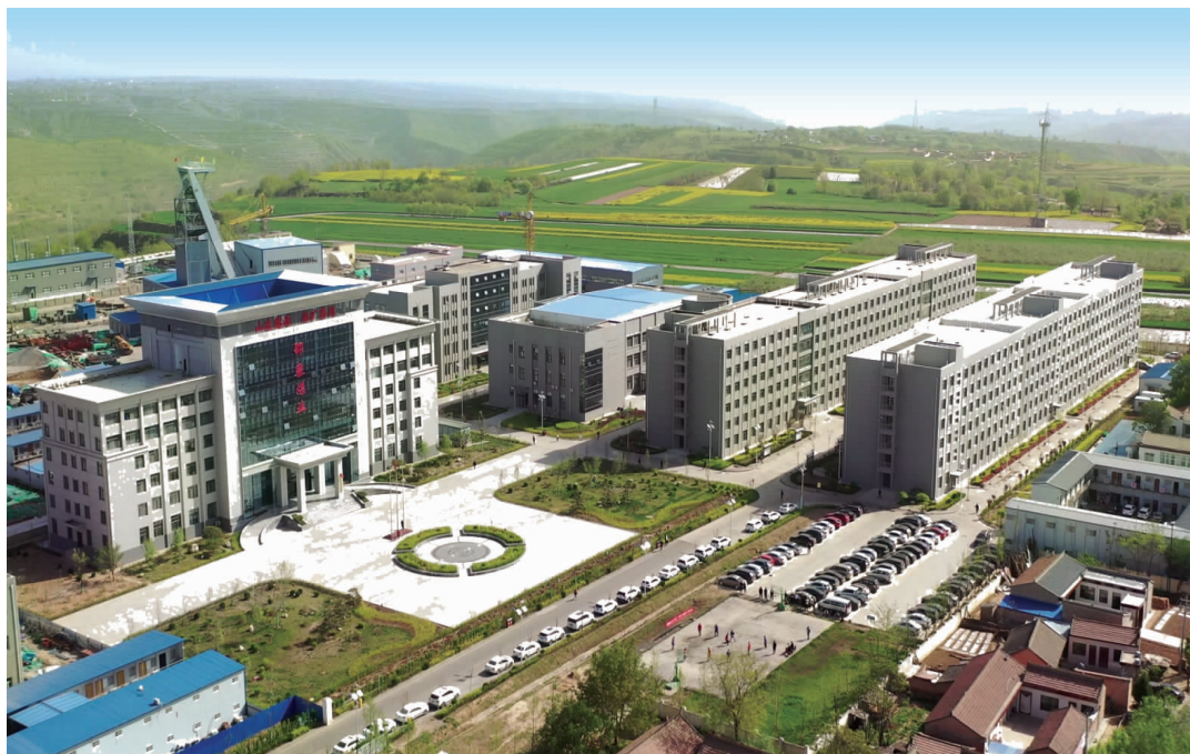
灵台县邵寨煤业办公生活区