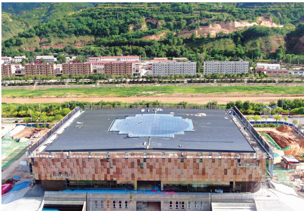
灵台县体育中心外观