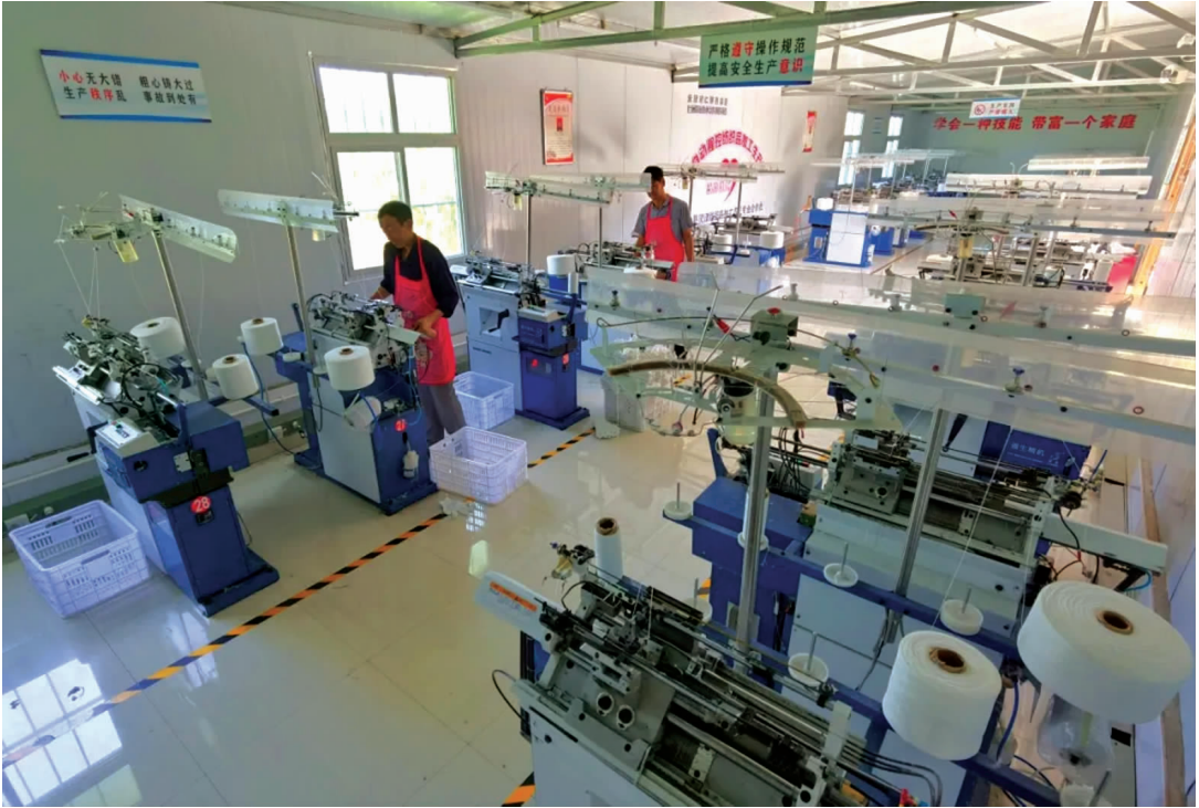
灵台县什字镇饮马咀村灵津纺织品就业帮扶车间