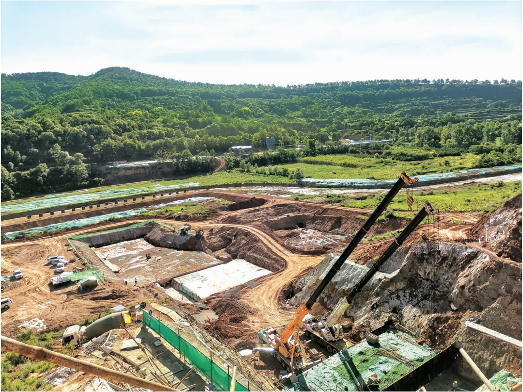
灵台县邓家川水库建设现场.