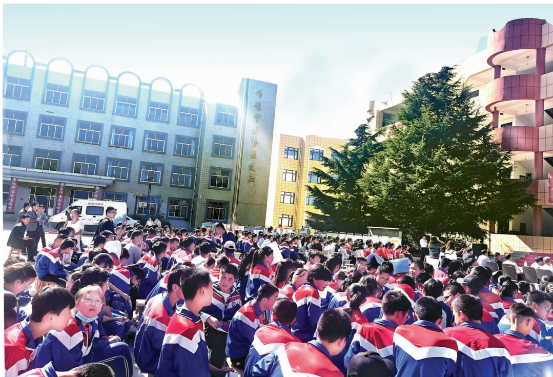
灵台县“红色百年路 科普万里行”庆祝建党 100 周年联合行动(进校园)