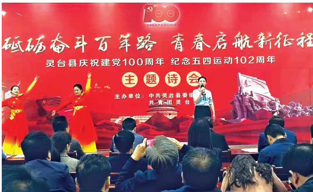
灵台县庆祝建党 100 周年主题诗会