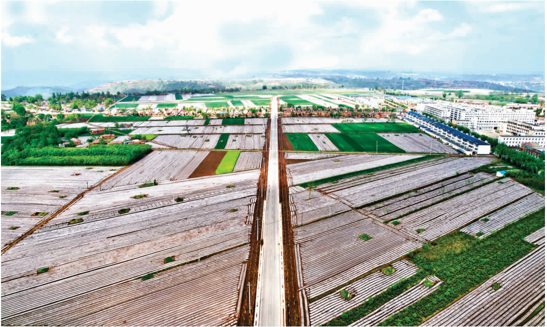
灵台县朝那镇镇村建设