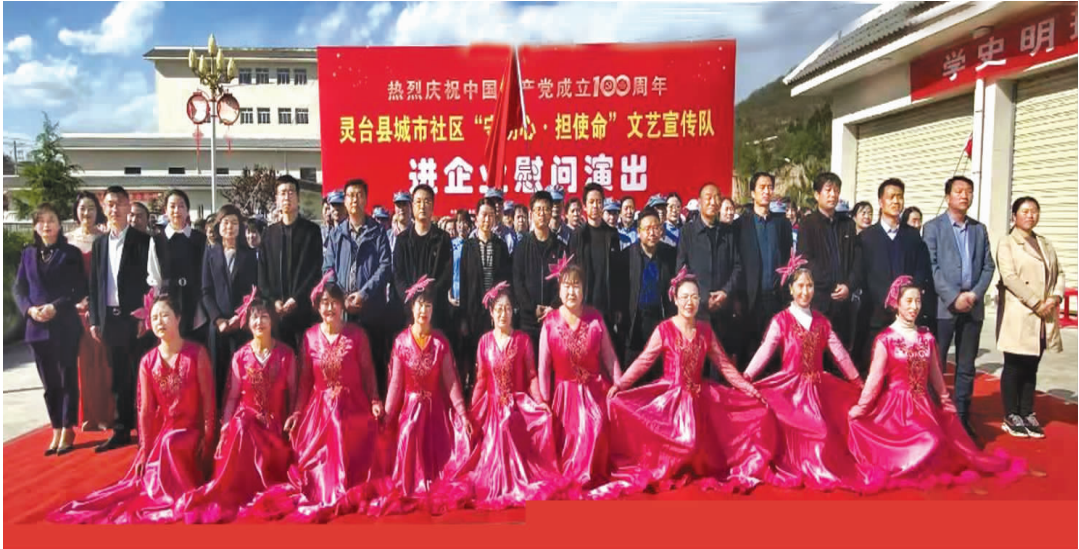
灵台县城市社区庆祝建党 100 周年慰问演出活动