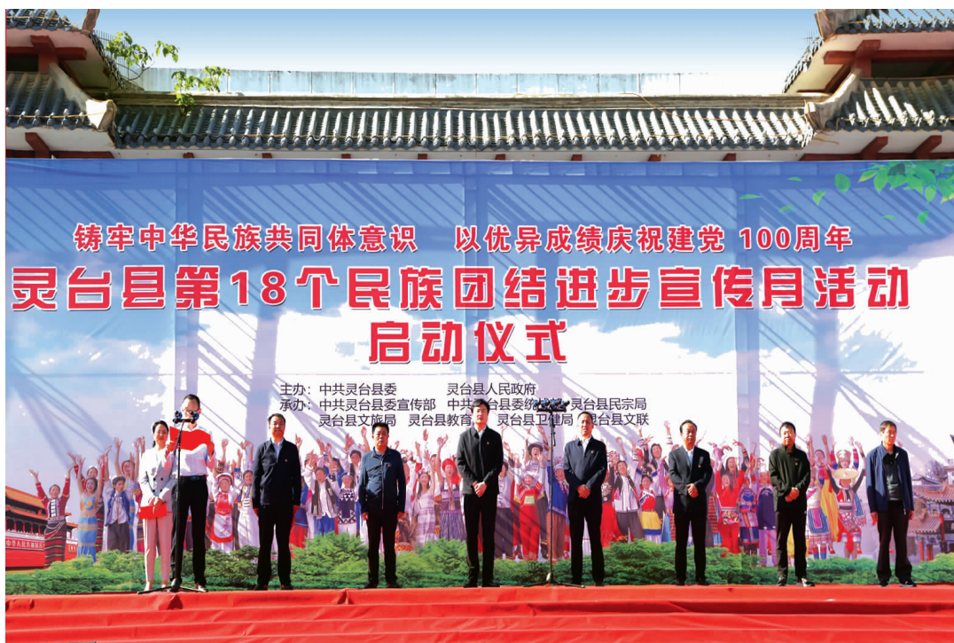
灵台县第 18 个民族团结进步宣传月活动启动仪式