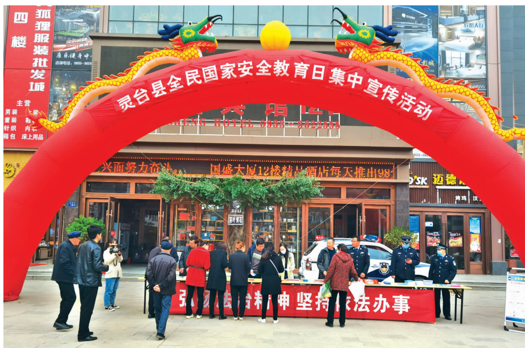
灵台县全民国家安全教育日宣传活动