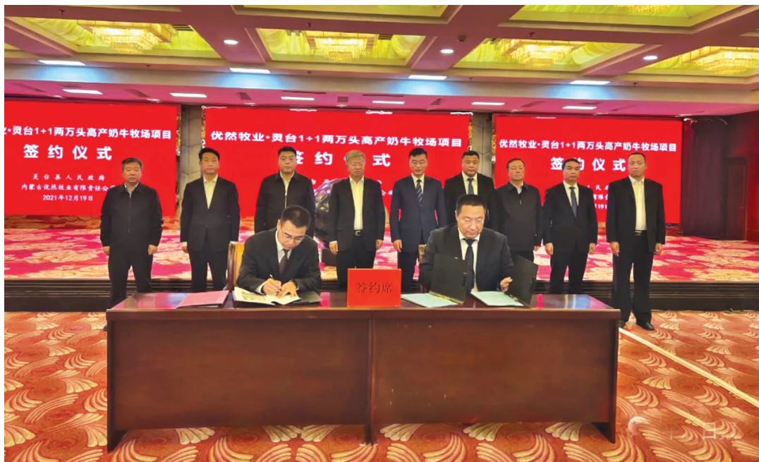
灵台县人民政府与内蒙古优然牧业有限责任公司签约仪式