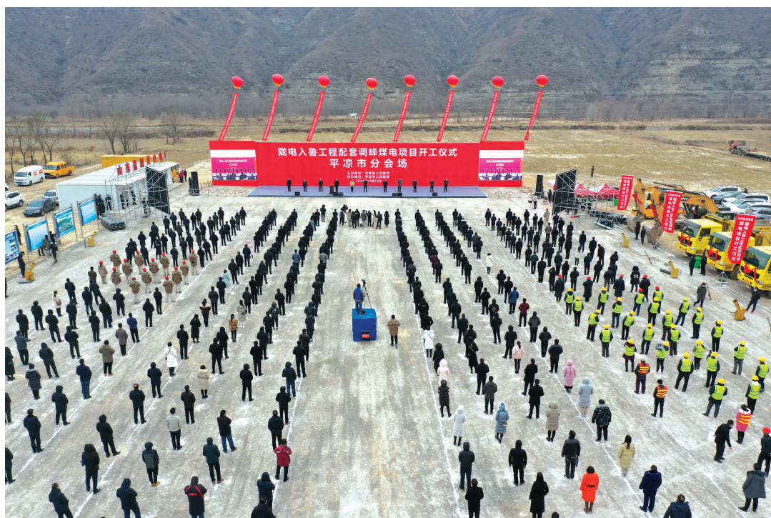
灵台电厂开工仪式