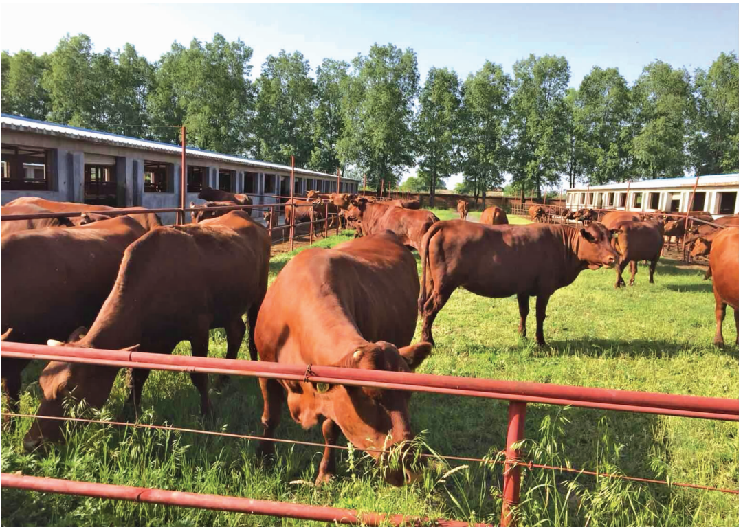
灵台县康庄牧业有限公司平凉红牛