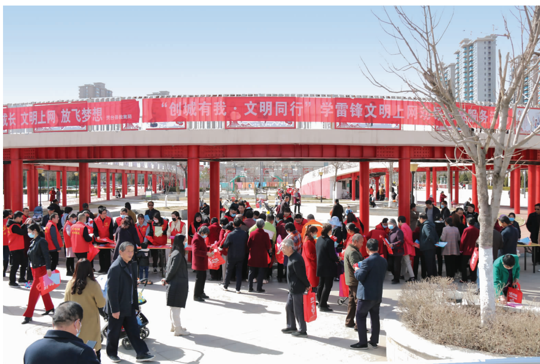
灵台县文明上网宣传活动