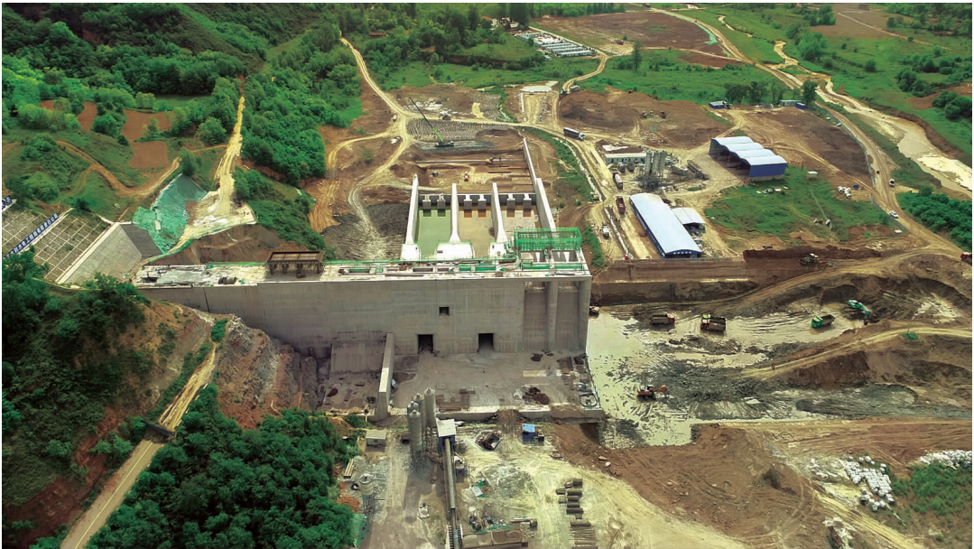
灵台县新集水库枢纽工程