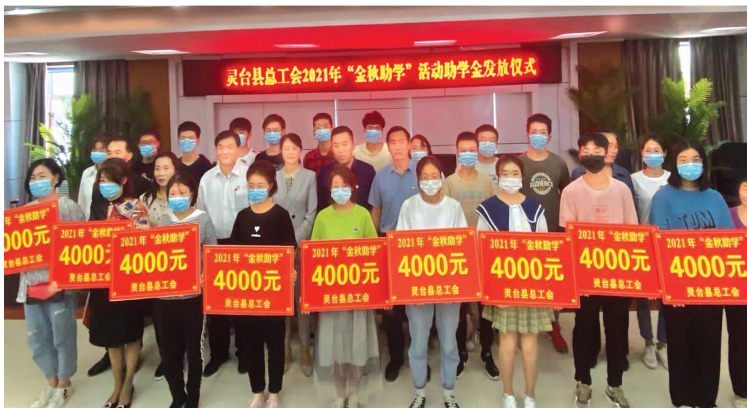
灵台县总工会 2021 年“金秋助学”活动助学金发放仪式