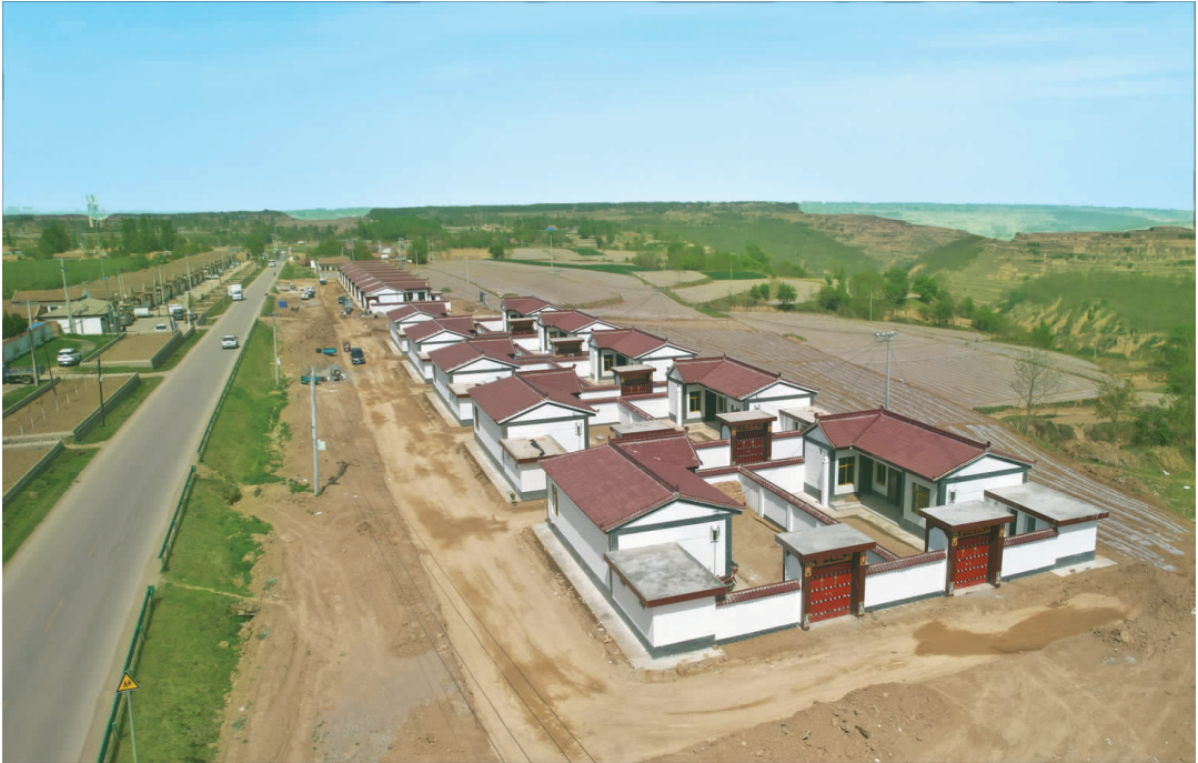
S28 灵华高速公路朝那镇西张村安置区