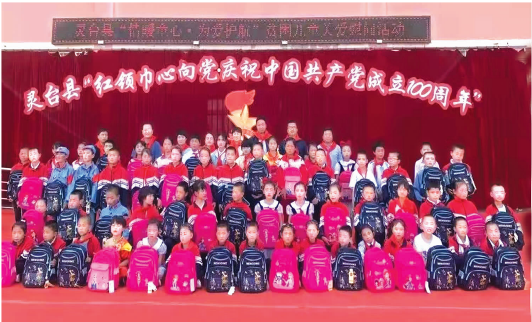
灵台县“红领中心向党庆祝中国共产党成立 100 周年”