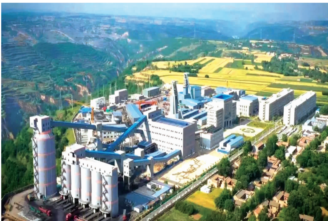
灵台县邵寨煤业公司全貌