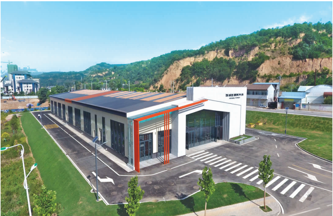
灵台县西城区便民市场