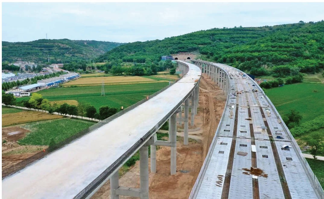
S28 灵台华亭高速公路黑河特大桥