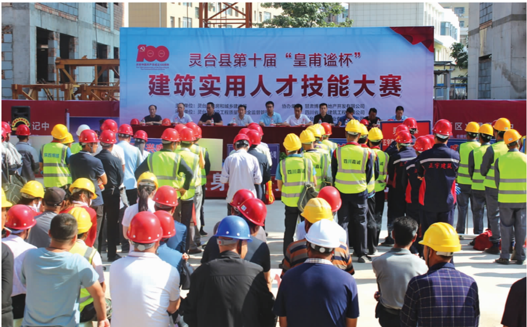
灵台县第十届“皇甫谧杯”实用人才技能大赛活动启动仪式