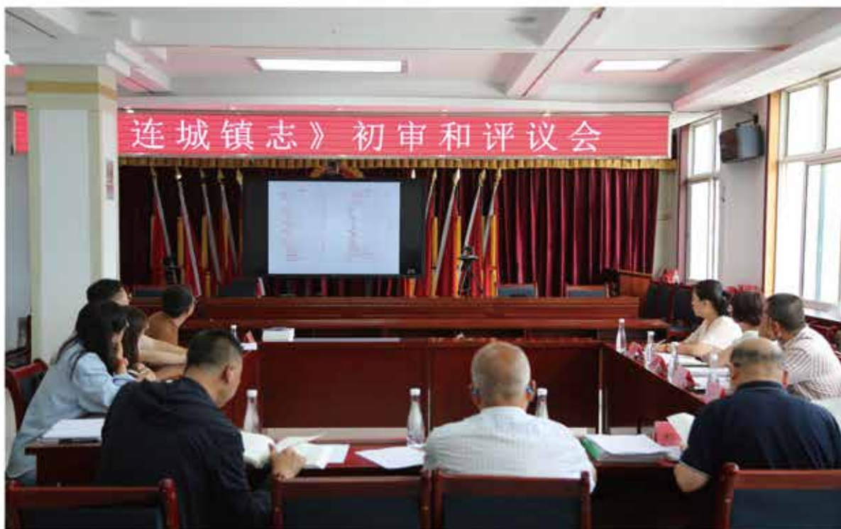
2024年7月26日，举办《连城镇志》评议和初审会