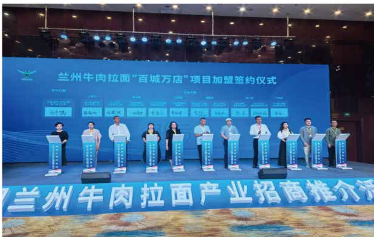
2024年8月28日，由兰州市商务局、永登县人民政府主办，永登县商务局和兰州树屏食品产业园承办的中国兰州牛肉拉面产业招商推介活动在兰州开幕