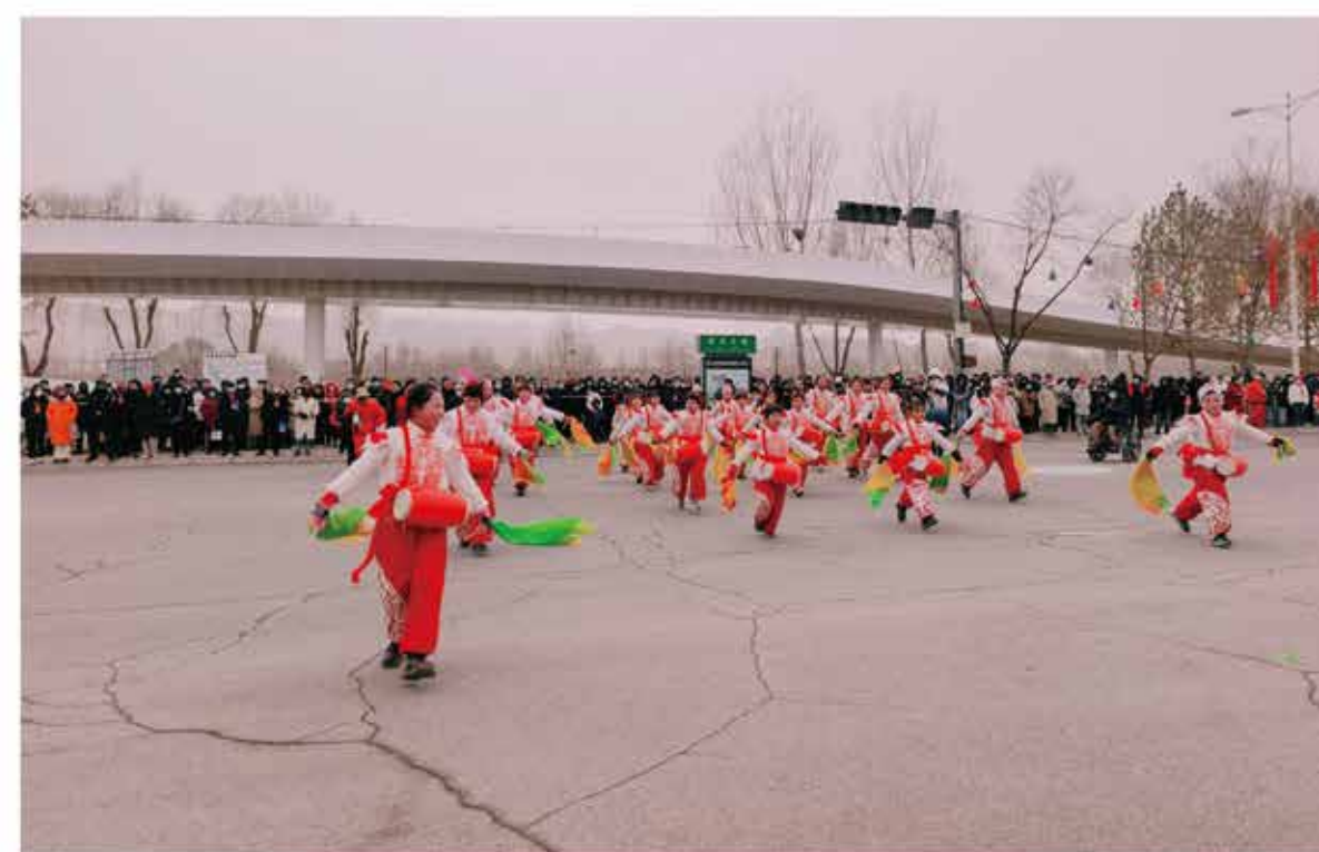
2024年社火进城展演活动