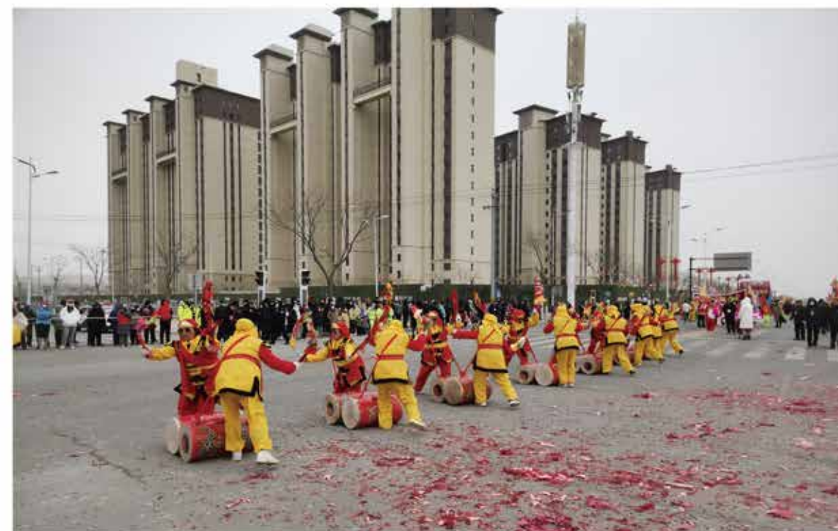
2024年社火进城展演活动