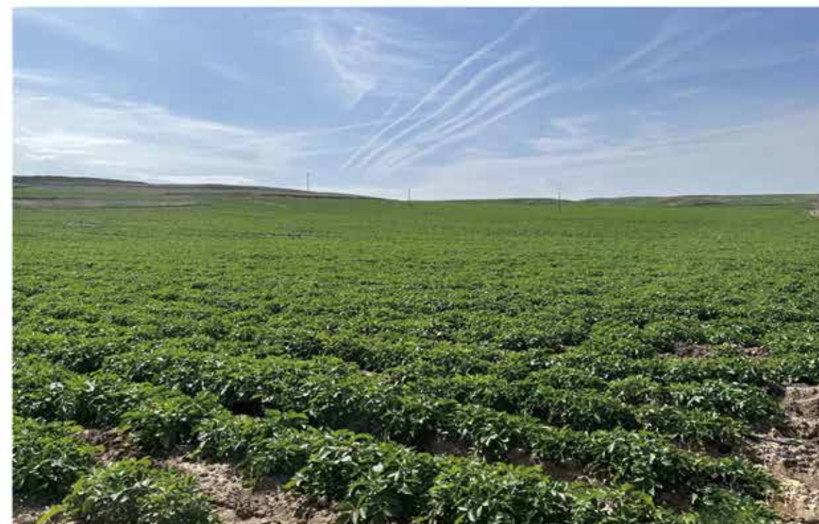
2024年8月，坪城乡万亩马铃薯基地