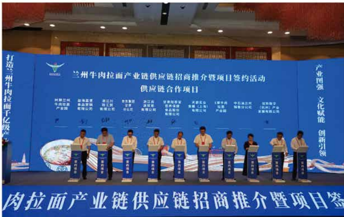
2024年7月8日，第三十届“兰洽会”——兰州牛肉拉面产业链供应链招商推介暨项目签约仪式举办（兰州树屏产业园区 提供）