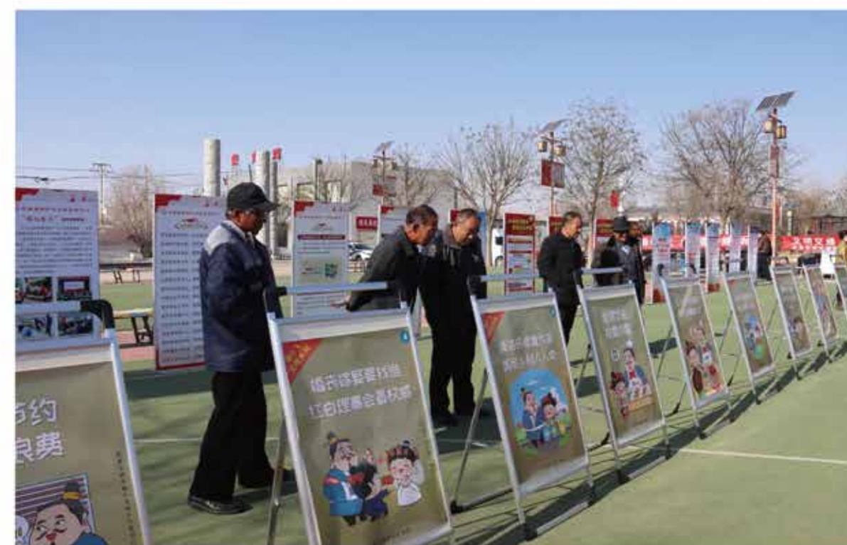
2024年12月6日，“推进移风易俗 培育文明乡村”在龙泉寺镇龙泉村举办