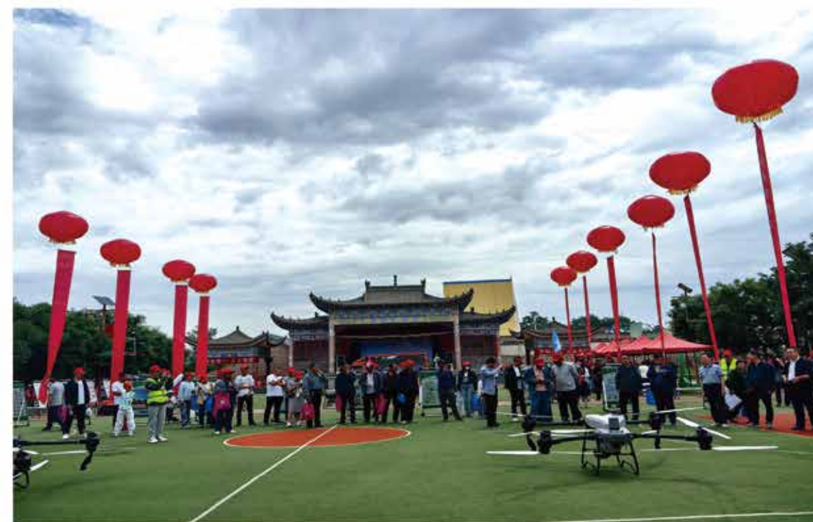
2024年7月，永登县新农机示范推广活动