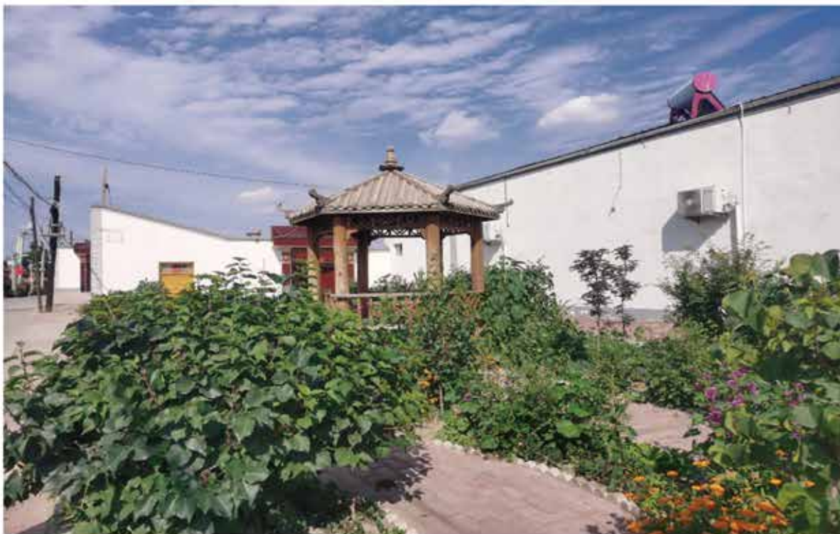
2024年柳树镇牌路村人居环境改造工程——小游园