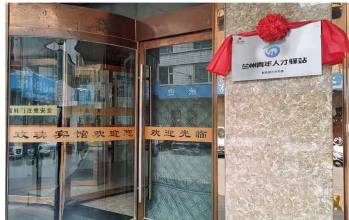
2024年11月19日，永登县首家“青年人才驿站”揭牌成立