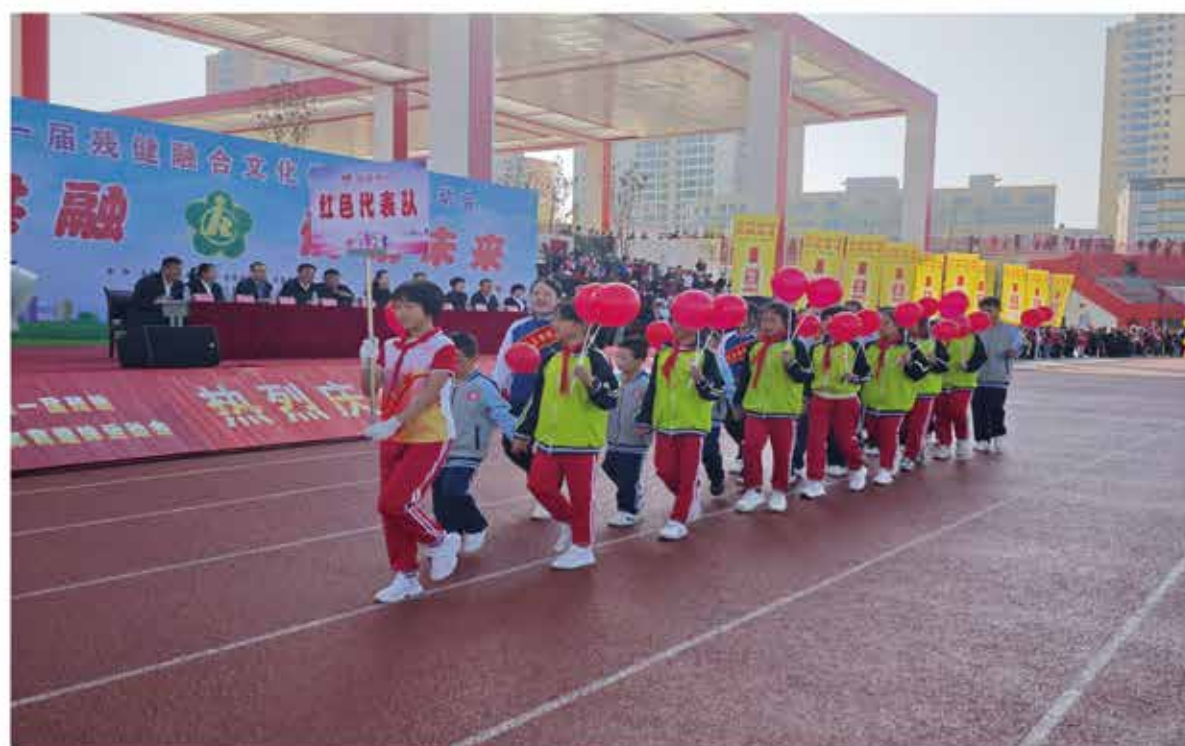
2024年9月25日，永登县第一届残健融合文化体育趣味运动会