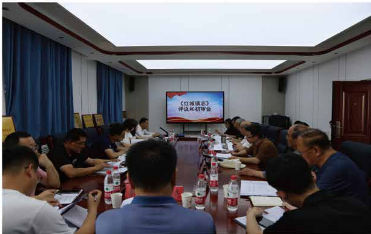
2024年7月3日，举办《红城镇志》评议和初审会