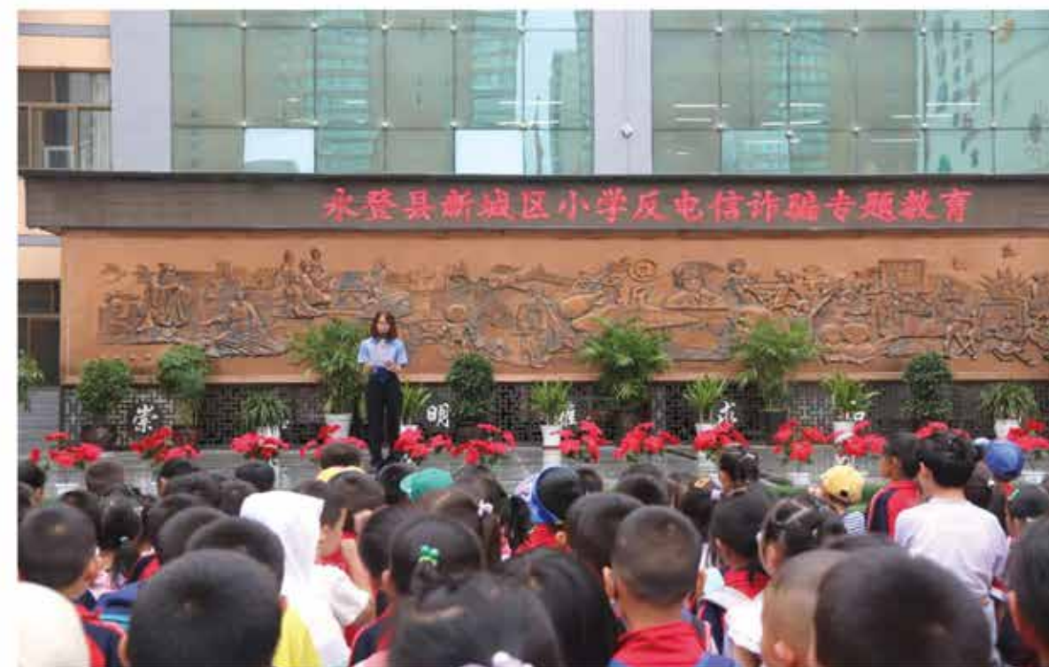
2024年6月，反电信诈骗专题教育进校园