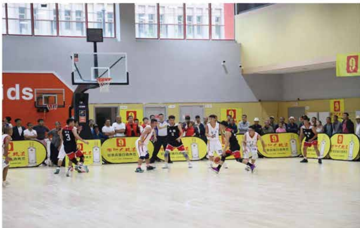
2024年8月8-11日，兰州市首届“滨河九粮液杯”和美乡村篮球大赛（村BA）在永登举办