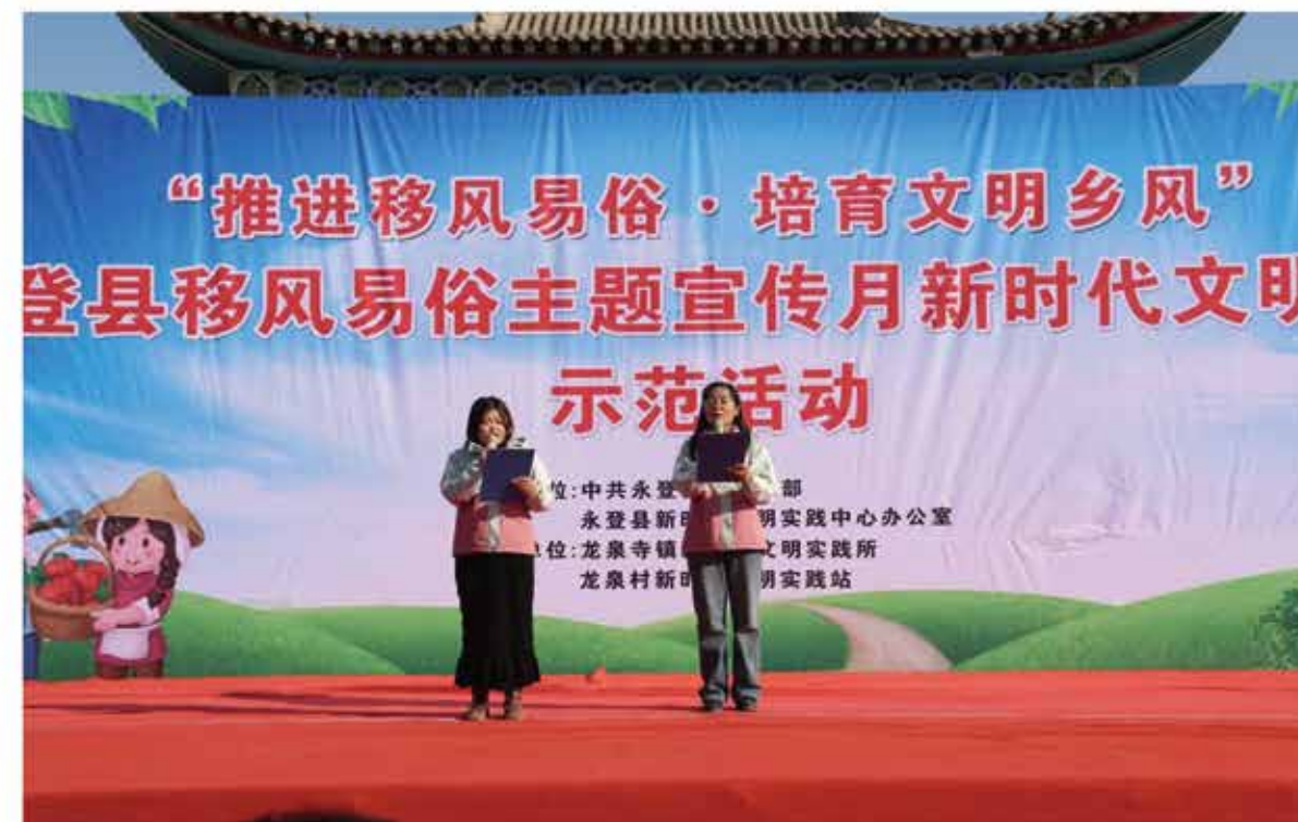
2024年12月6日，“推进移风易俗 培育文明乡村”在龙泉寺镇龙泉村举办