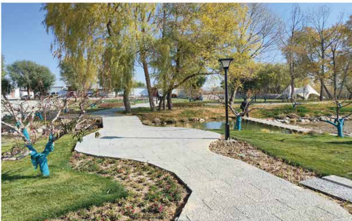
2024年大同镇郭家墩和美乡村建设