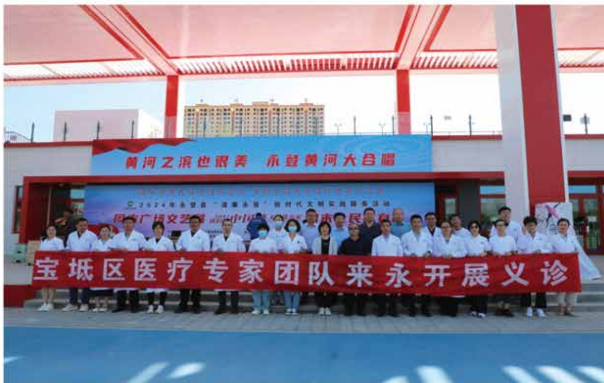
2024年7月19日，天津市宝坻区卫健委来永开展义诊活动