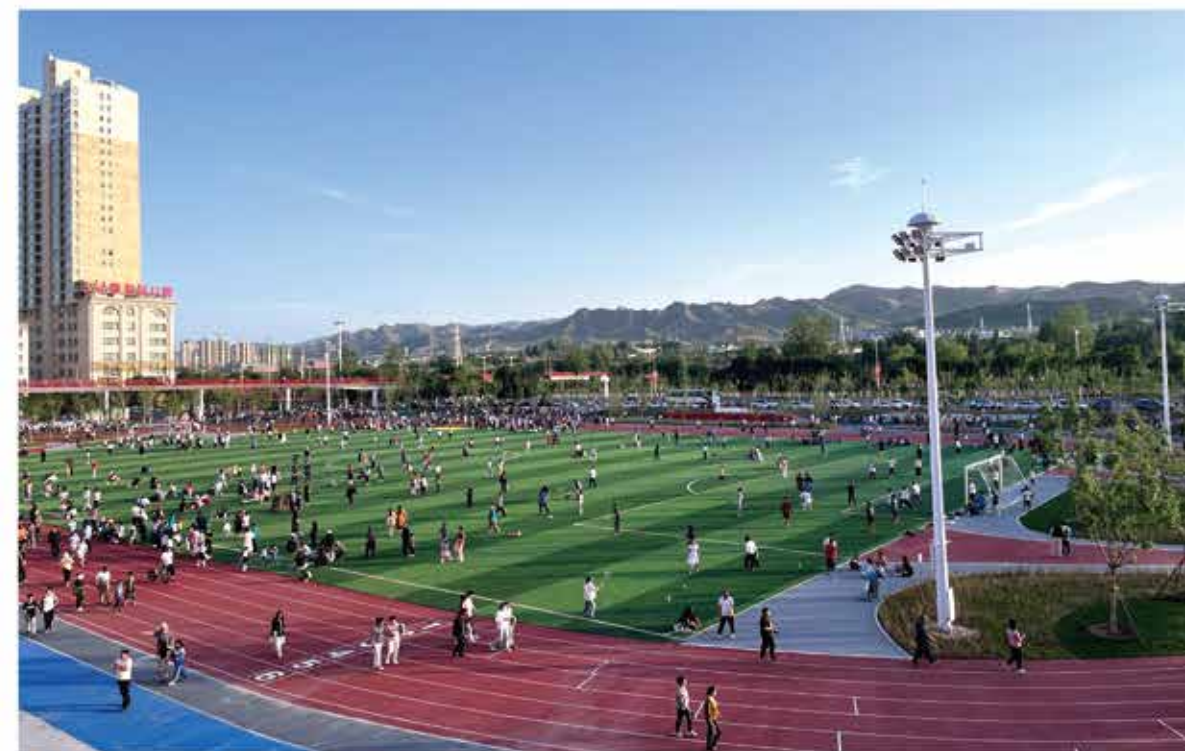
2024年7月，永登县全民健身中心投入使用