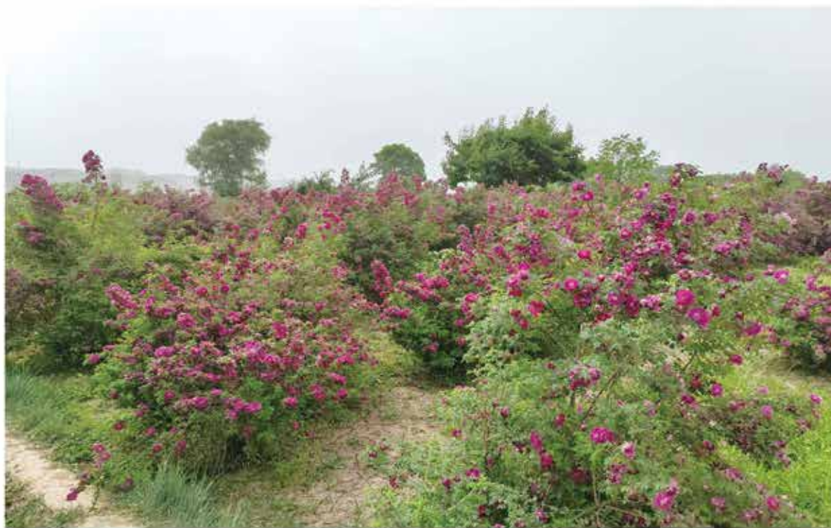
2024年6月，苦水玫瑰种植基地丰收