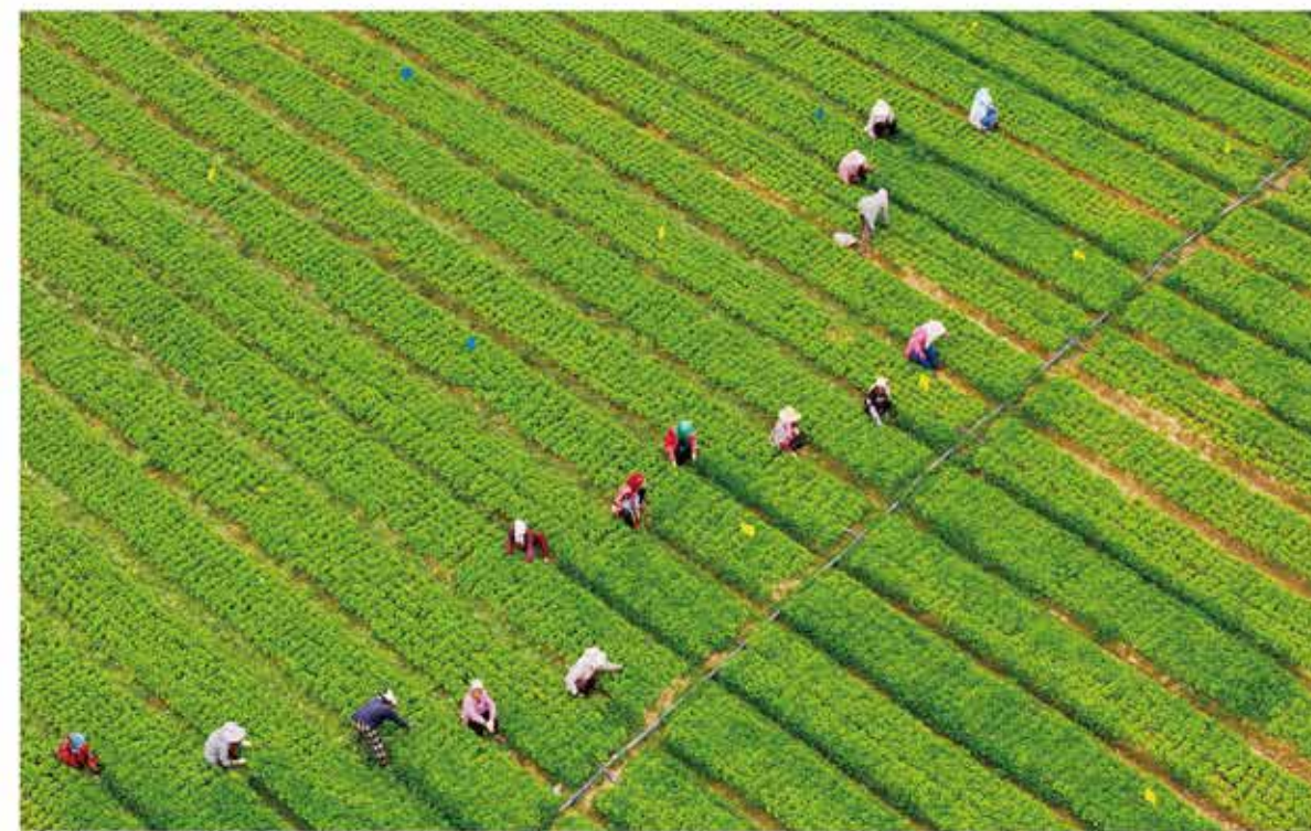
2024年，永登县高标准农田建设