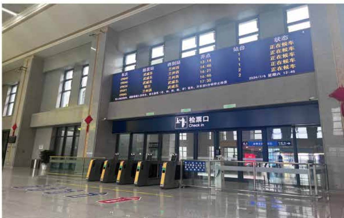
2024年6月29日，兰张高铁兰武段正式运营，永登北站启用