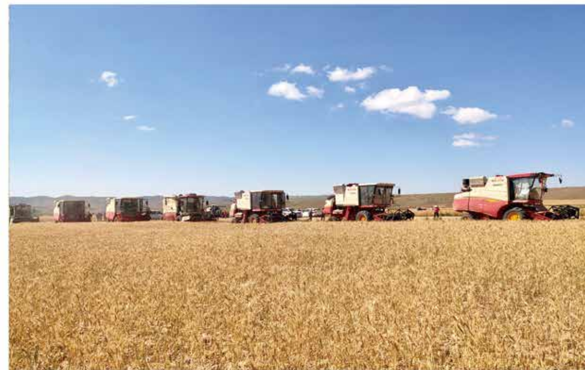
2024年8月，柳树镇小麦进入收割季