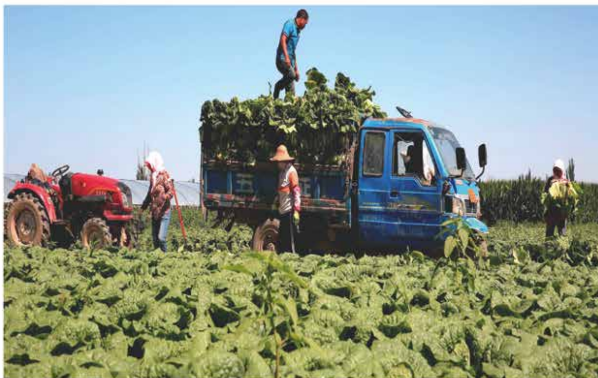
2024年6月，永登县高原夏菜进入采收月