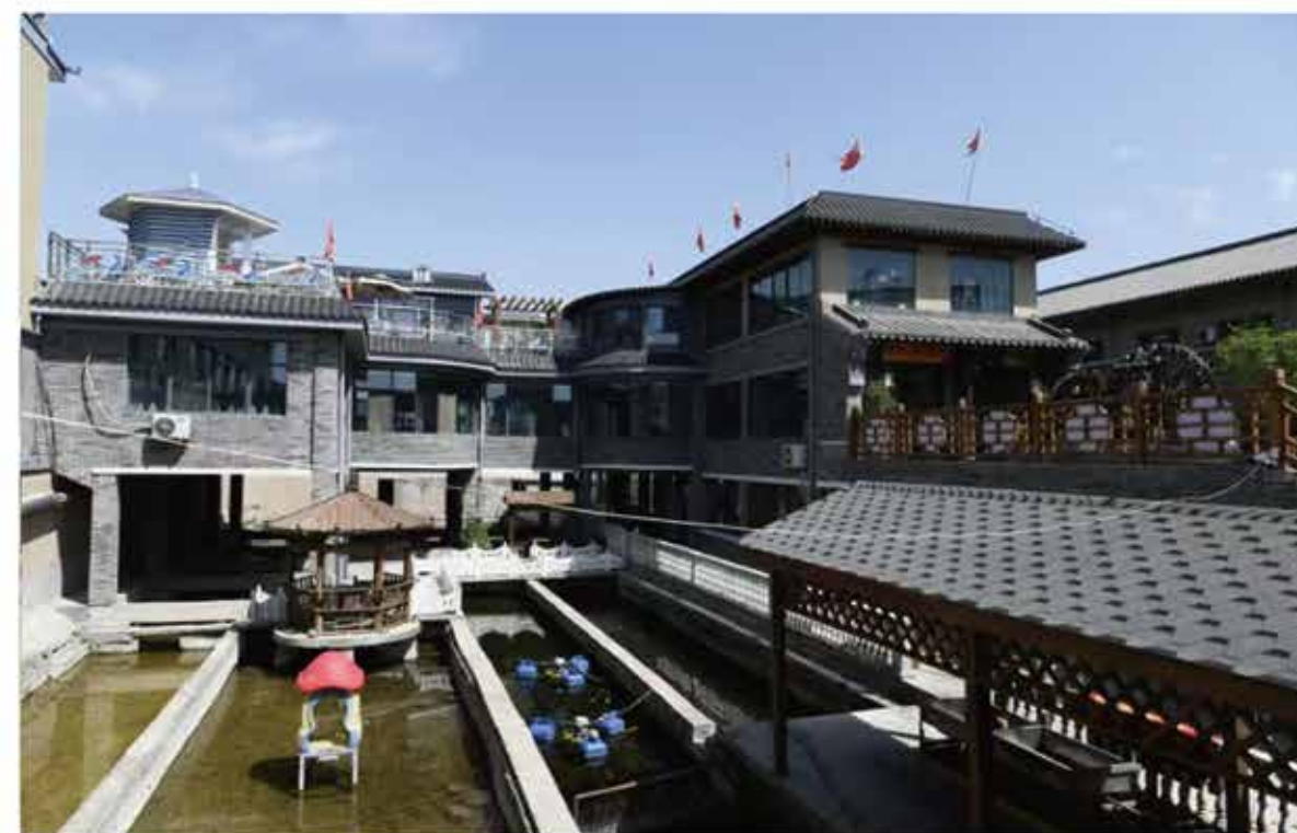
2024年6月，永登县满城渔村改造工程投入使用