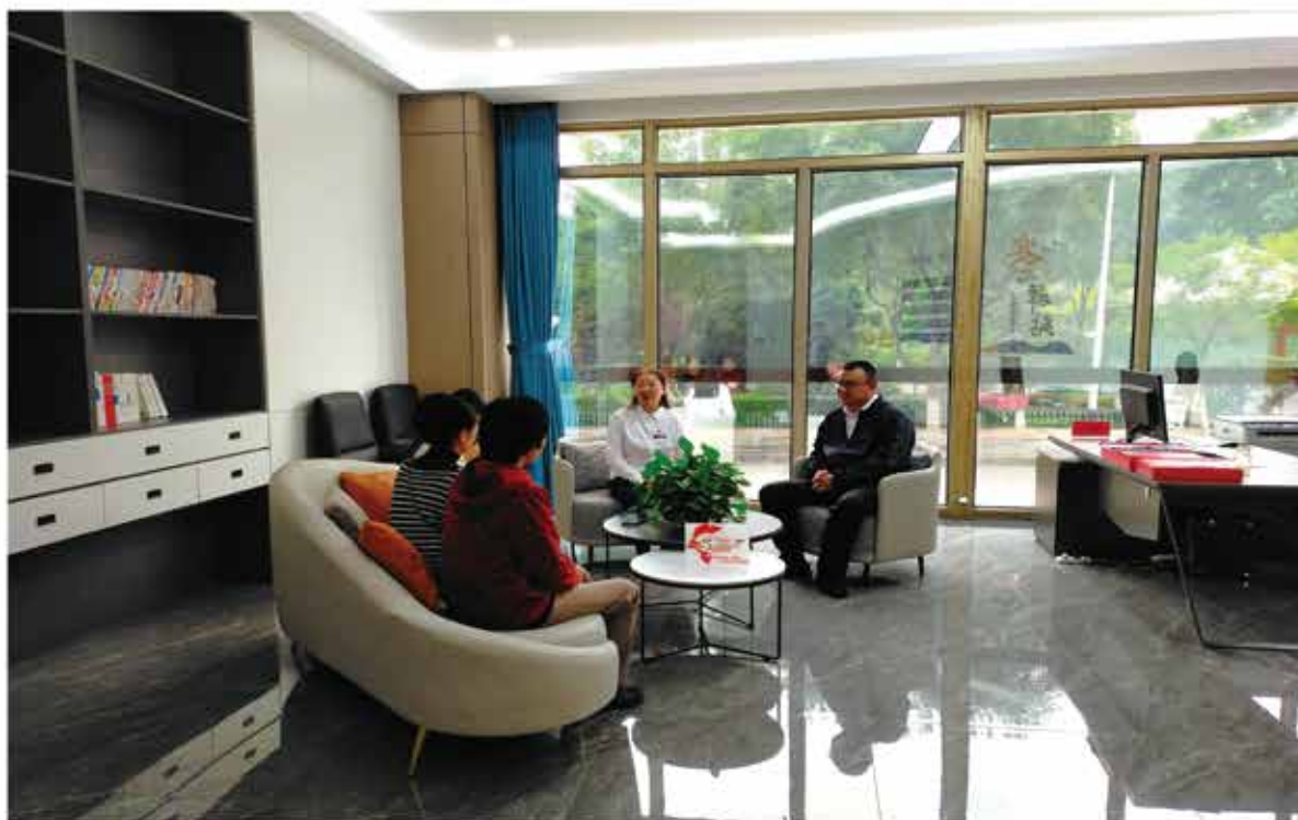
2024年10月，县综治中心开展心理咨询服务