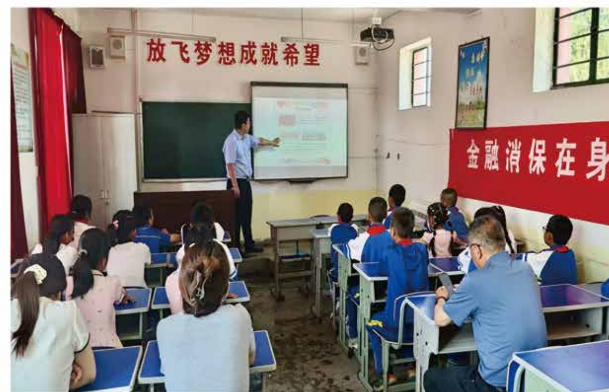
2024年6月，金融知识“五进入”宣教活动