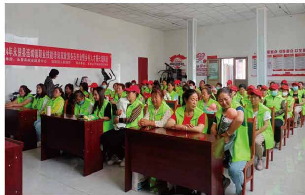
2024年永登县职业技能培训