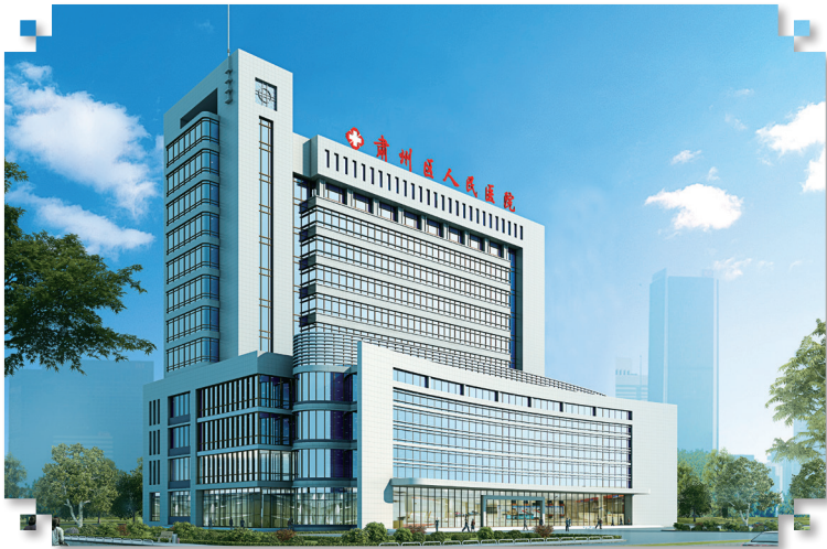
肃州区人民医院效果图