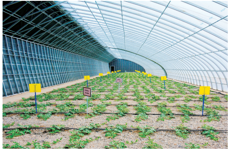
东洞戈壁农业产业园