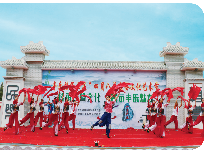
丰乐镇四月八文化艺术节节目表演