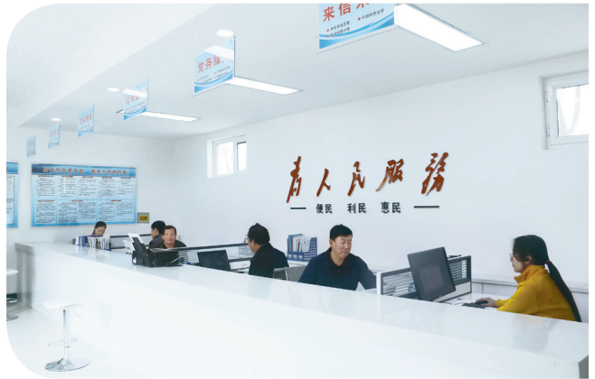
上坝镇营尔村党员群众服务中心