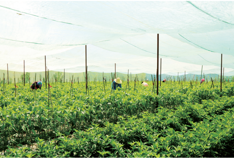
果园镇高效网室制种