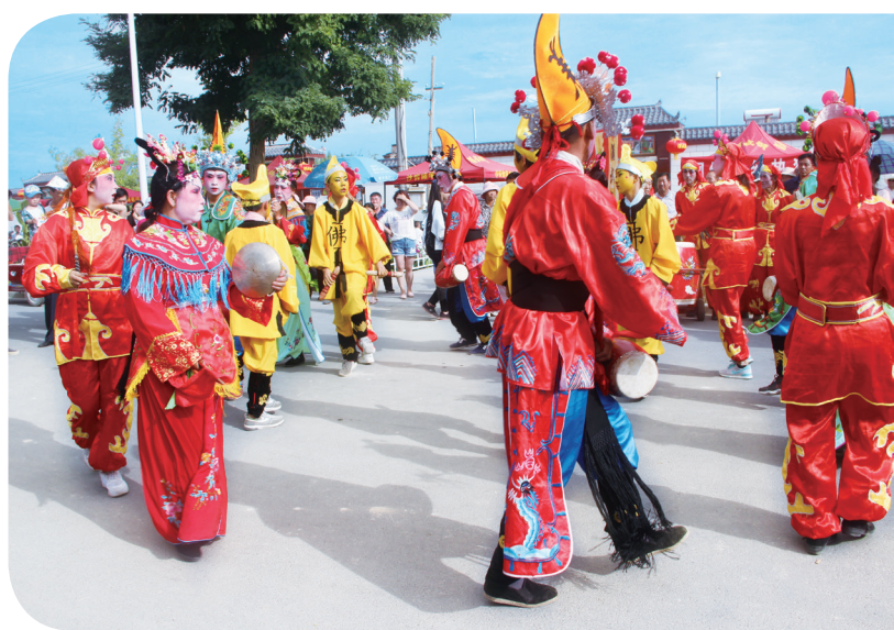
果园镇第四届生态文化艺术节