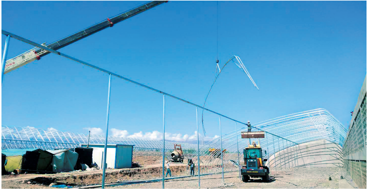
东洞戈壁农业产业园