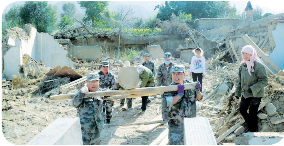
丰乐镇灾后镇村党员干部帮助灾民清理倒塌房屋