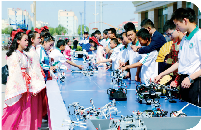
庆六一机器人展示活动