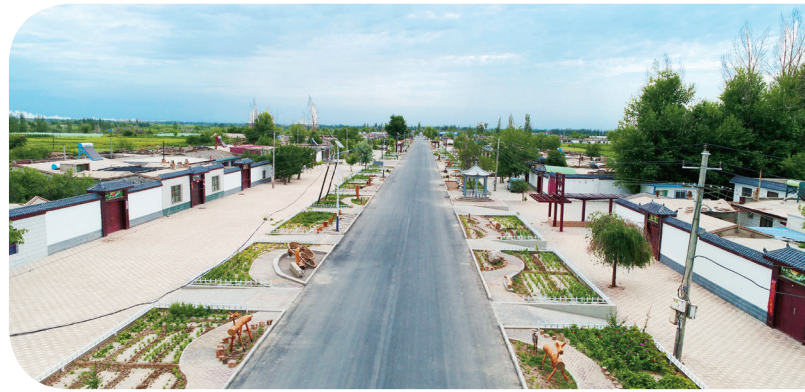
果园中所沟新农村建设