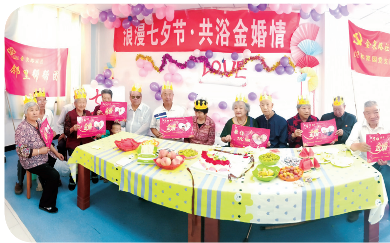
金泉路社区为辖区老人庆祝金婚纪念日