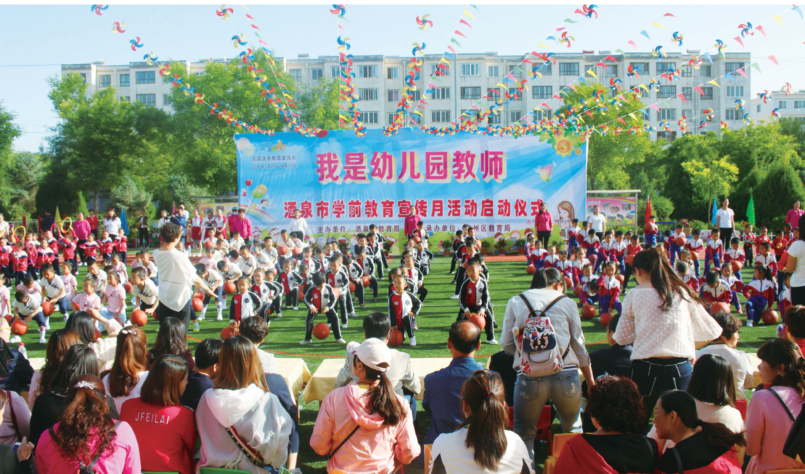
学前教育宣传月启动仪式