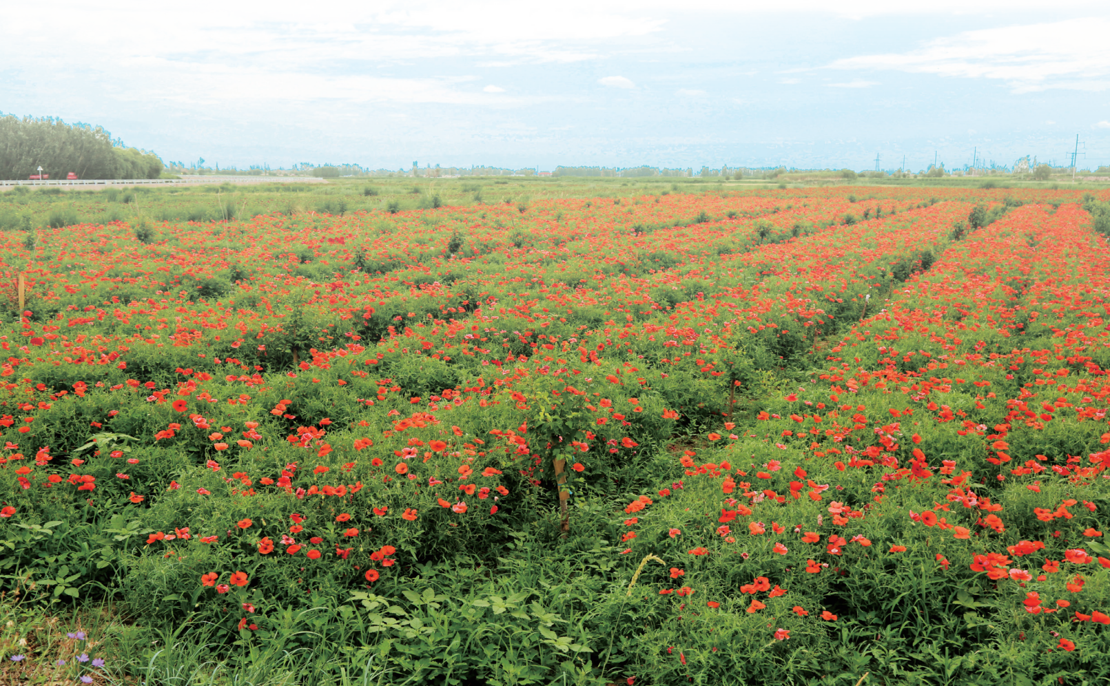
果园镇湿地大道沿线花卉小区