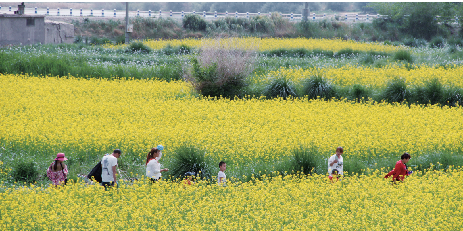
湿地大道沿线万亩油菜花