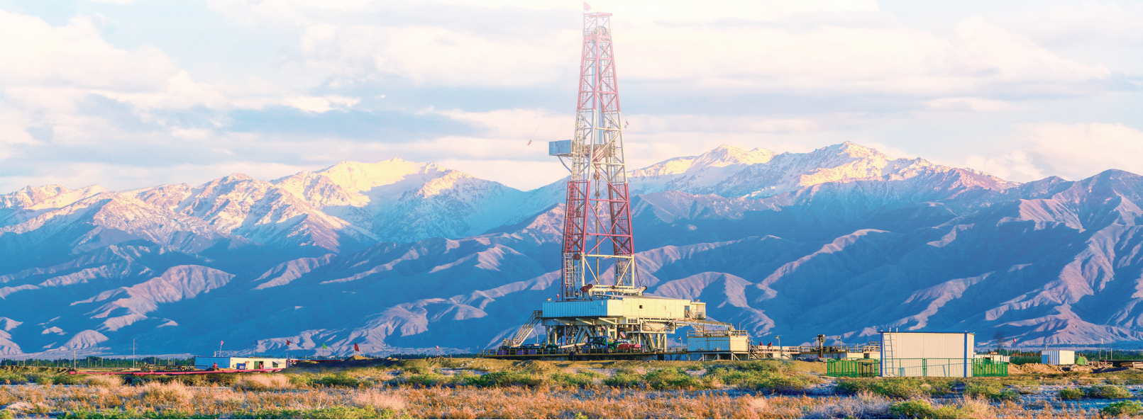
金佛寺镇酒东油田油井