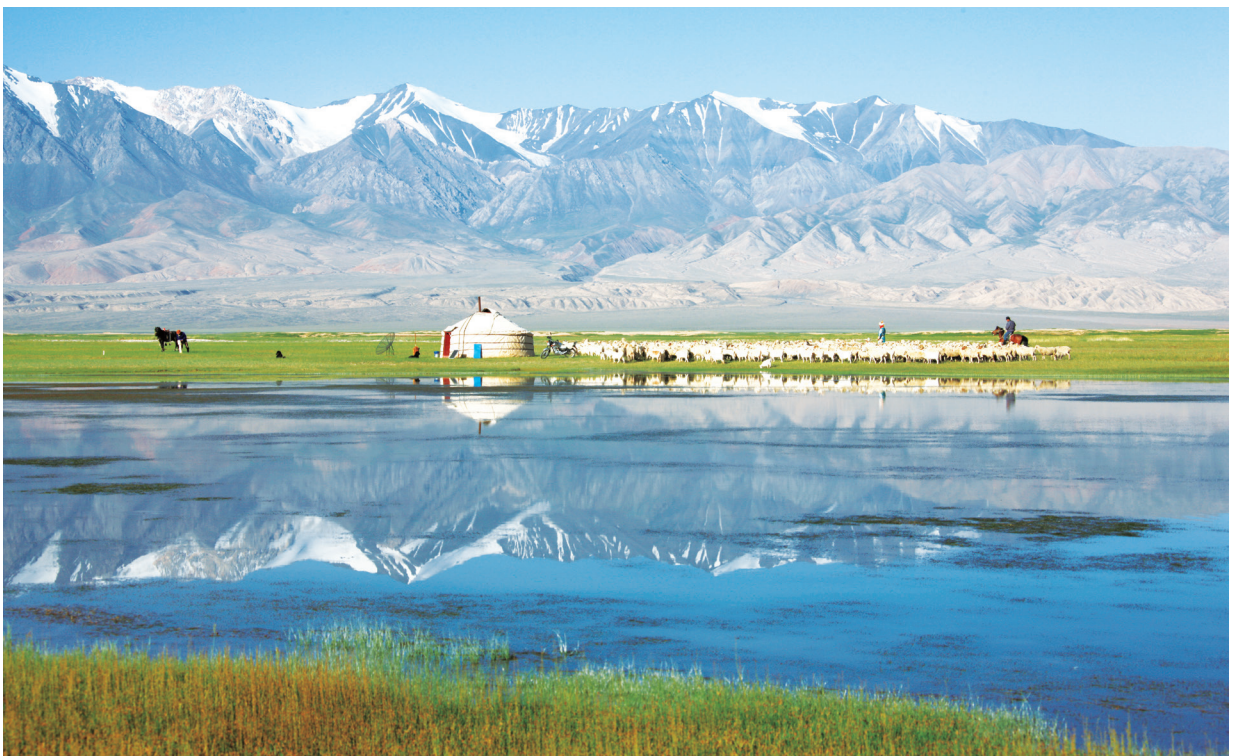
肃北县盐池湾湿地