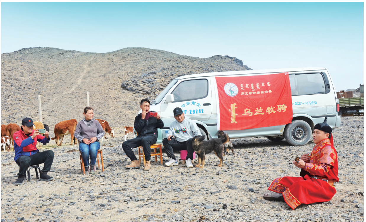
2021年9月，肃北县乌兰牧骑在牧区演出。