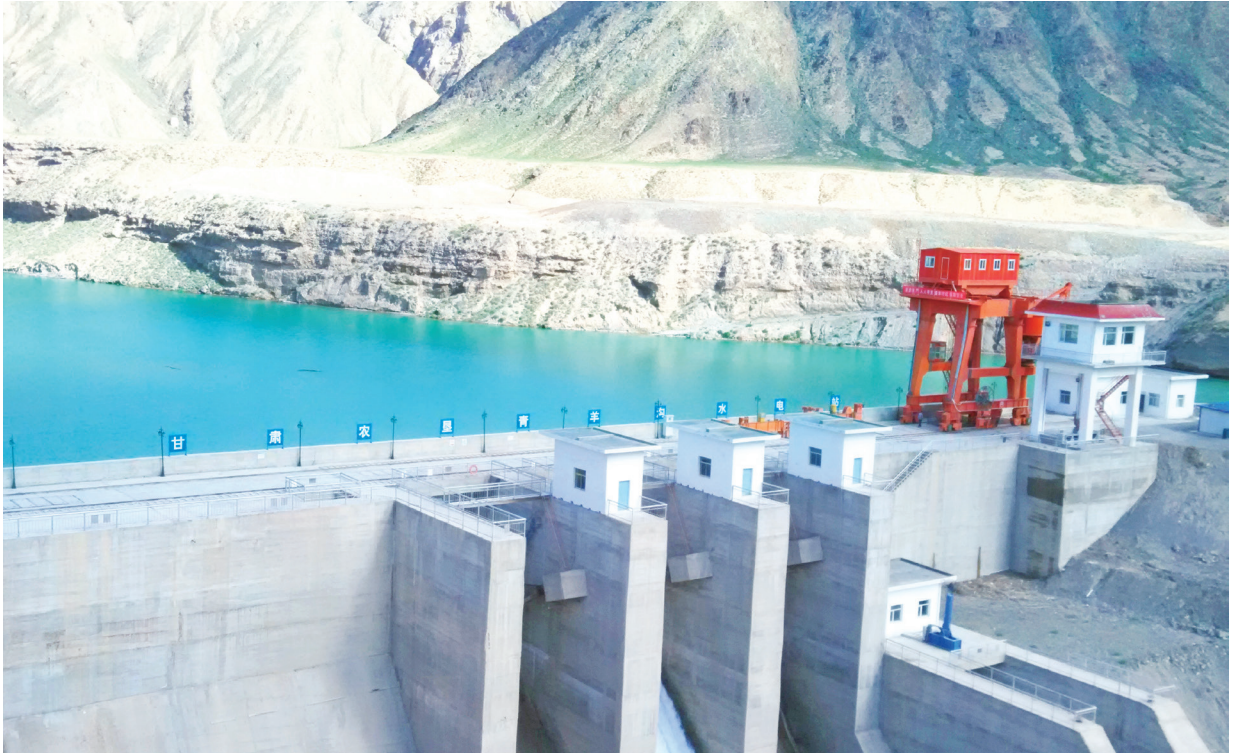
肃北县青羊沟电站。