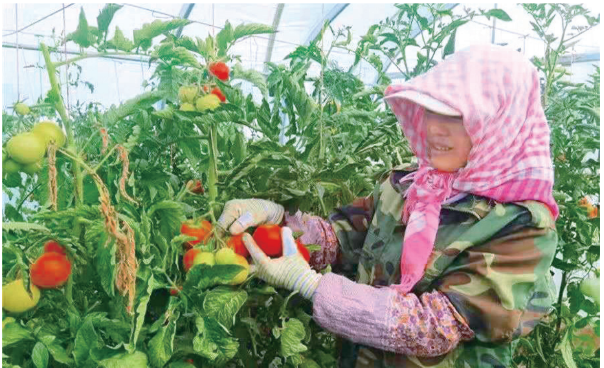
肃北县党城湾镇温棚种植。