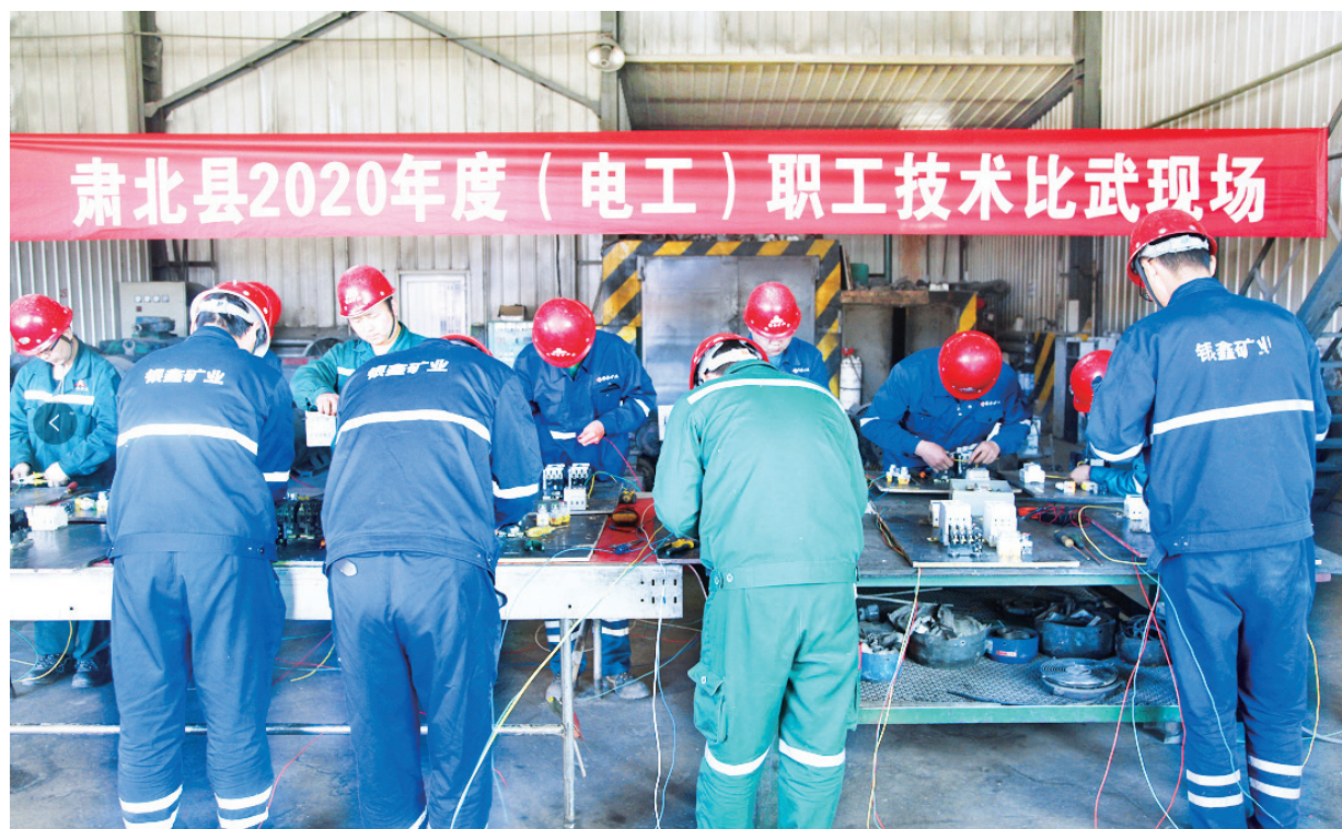
2020年8月23日，肃北博伦公司开展电工岗位练兵活动。