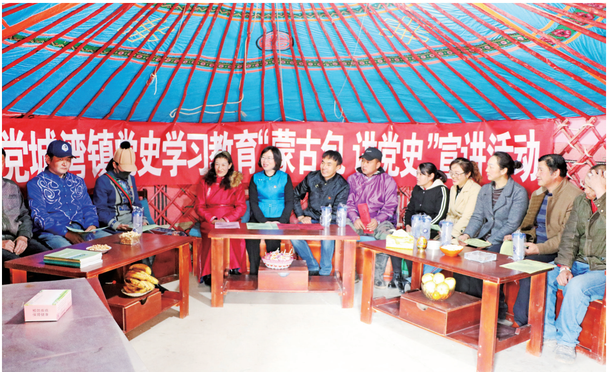
党史教育进牧区，蒙古包里颂党恩。