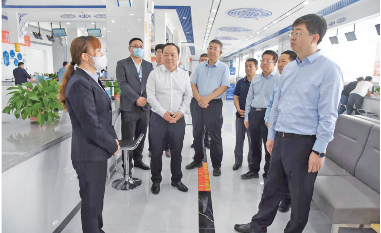
2021年8月3日，中共酒泉市委书记王立奇（右1）在肃北县市民中心调研。