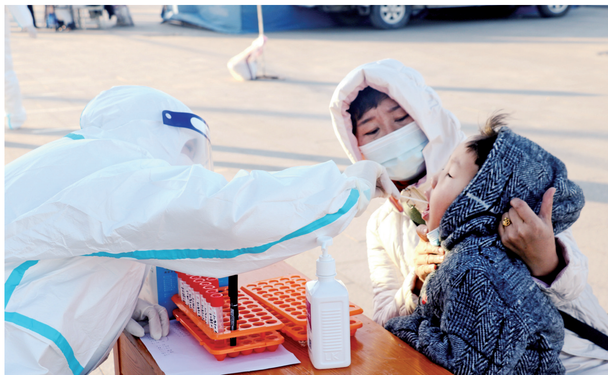
2021年10月23日，肃北县开启全员新冠病毒核酸检测。