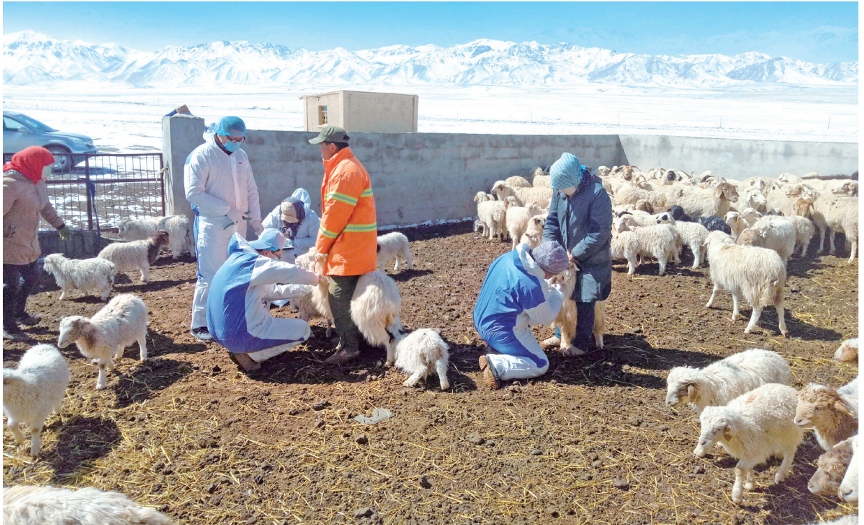
肃北县畜牧兽医技术服务中心开展春季集中免疫。