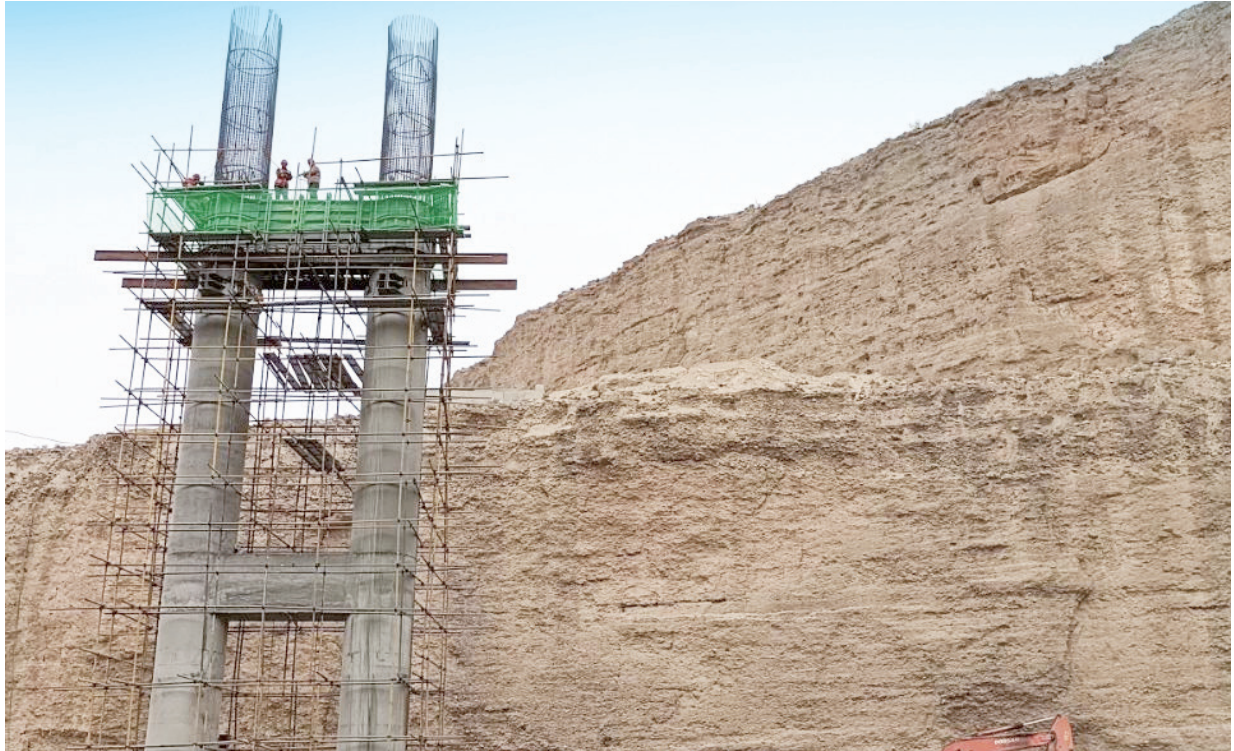
肃北县疏勒河大桥施工现场。