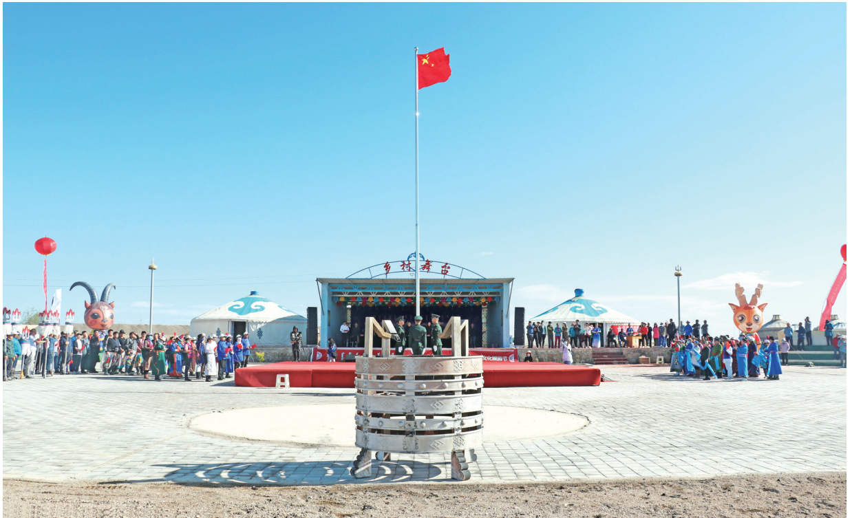
2021年6月23日至24日，马鬃山镇第四届夏季文化旅游节在巴音布勒格特色村寨举行。