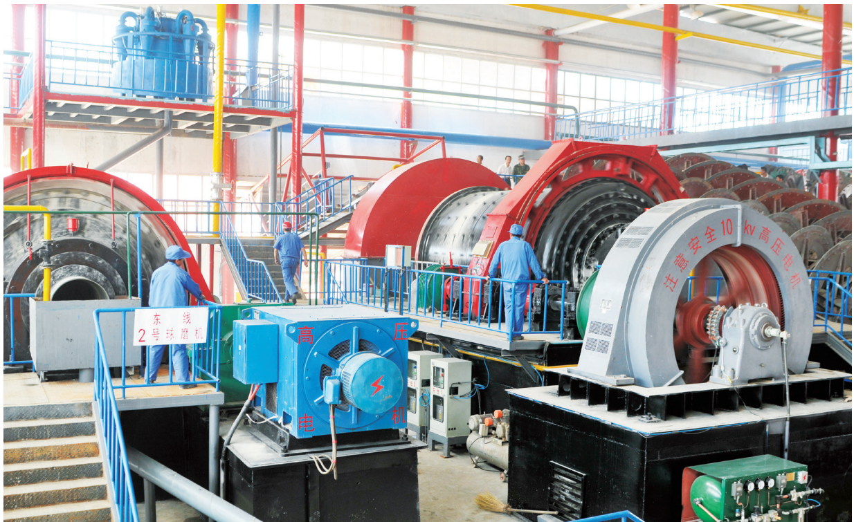
肃北县浙商矿业生产车间一角。