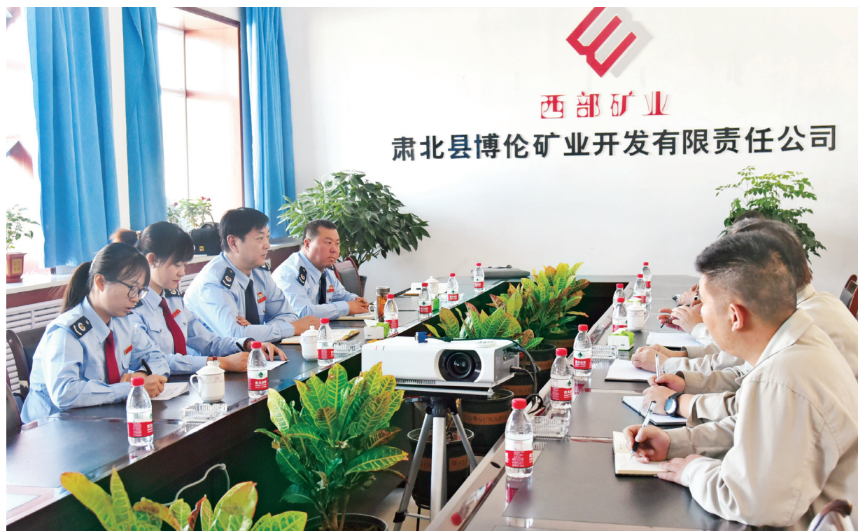
肃北县税务局开展“我为纳税人缴费人办实事”实践活动。