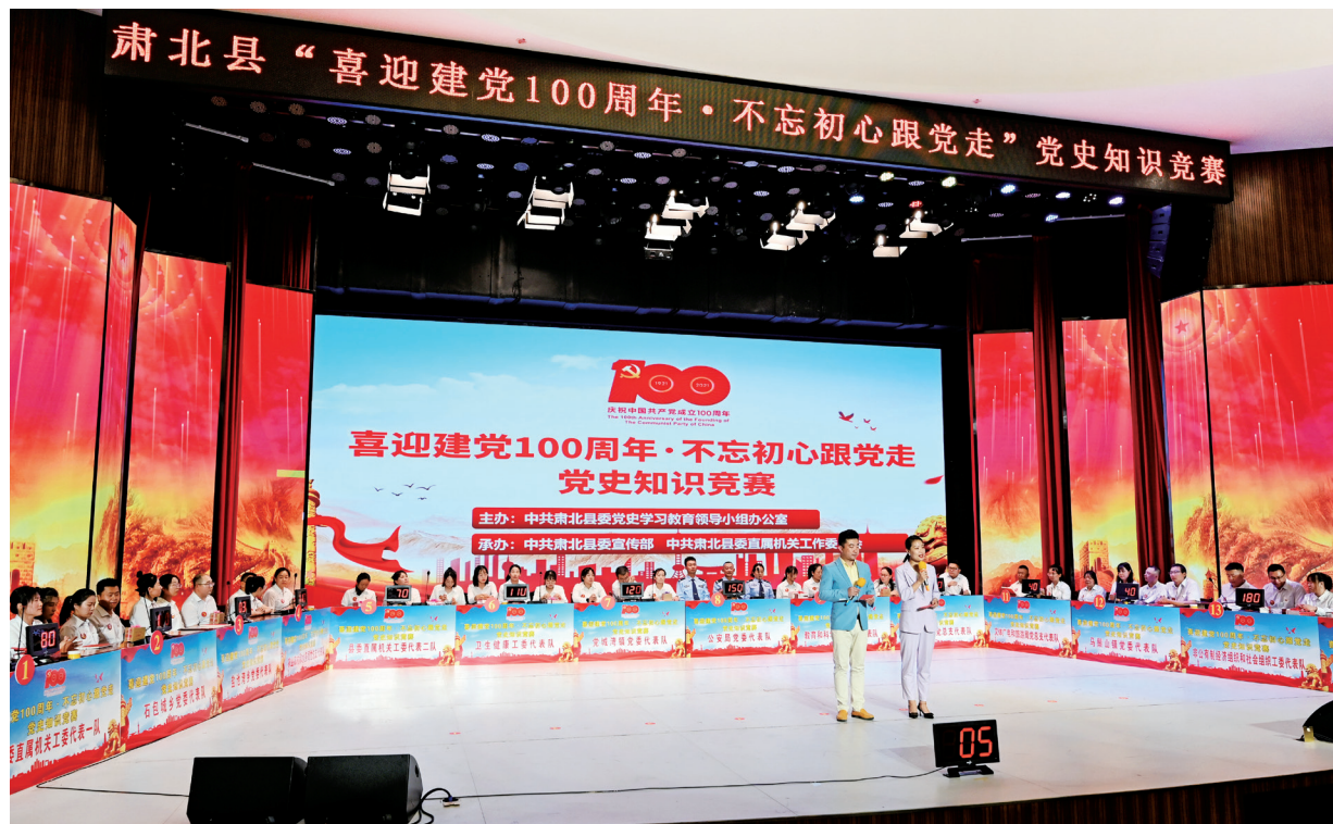
肃北县举办“喜迎建党100周年·不忘初心跟党走”党史知识竞赛。