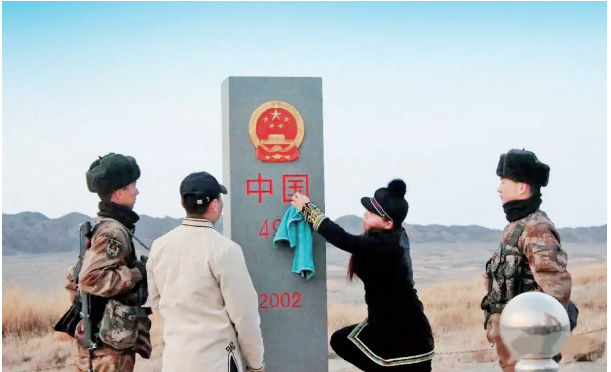
肃北县军民擦亮国界界碑。