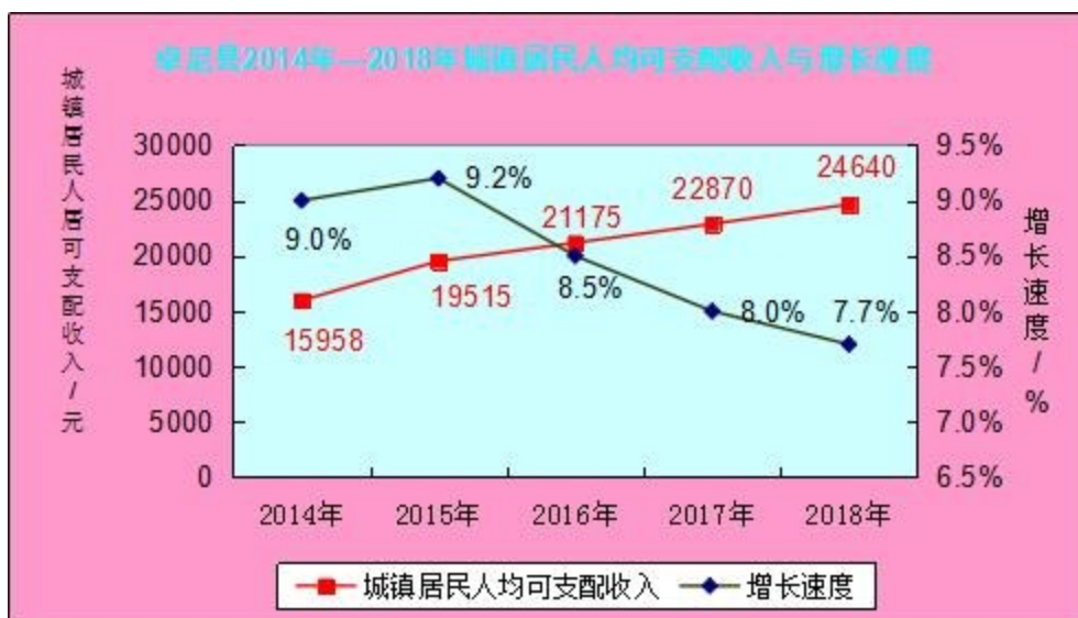
卓尼县 2018 年城镇居民生活消费支出表