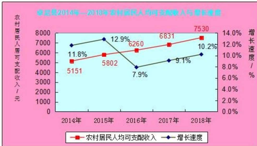
卓尼县 2018 年农村居民生活消费支出表