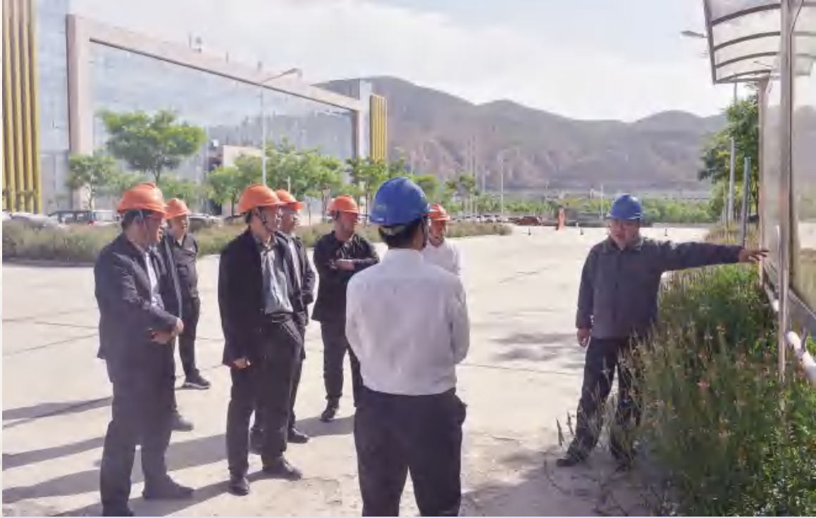
5月31日,市应急委安全生产提升工作指导组进驻安定区蹲点指导安全生产提升工作