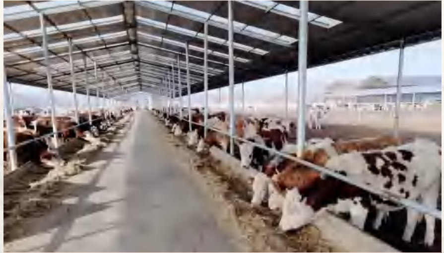
香泉镇肉牛繁育基地