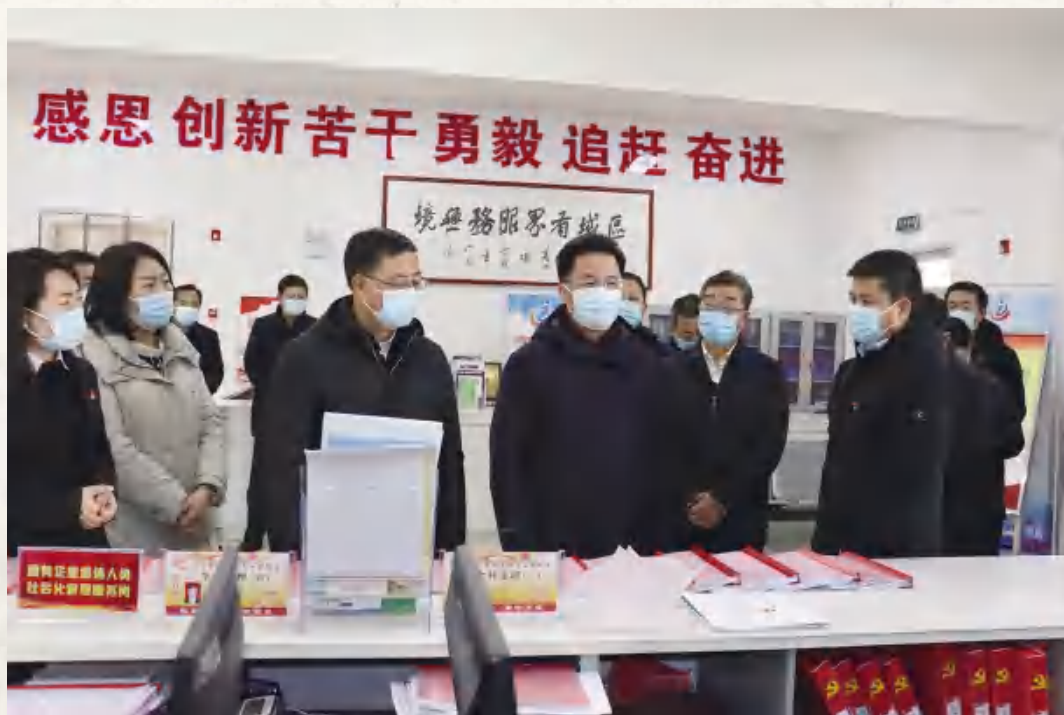
1月28日,市委书记戴超(右三),市委副书记、市长汪尚学(右四)春节前夕在福台路街道东湖社区调研指导工作