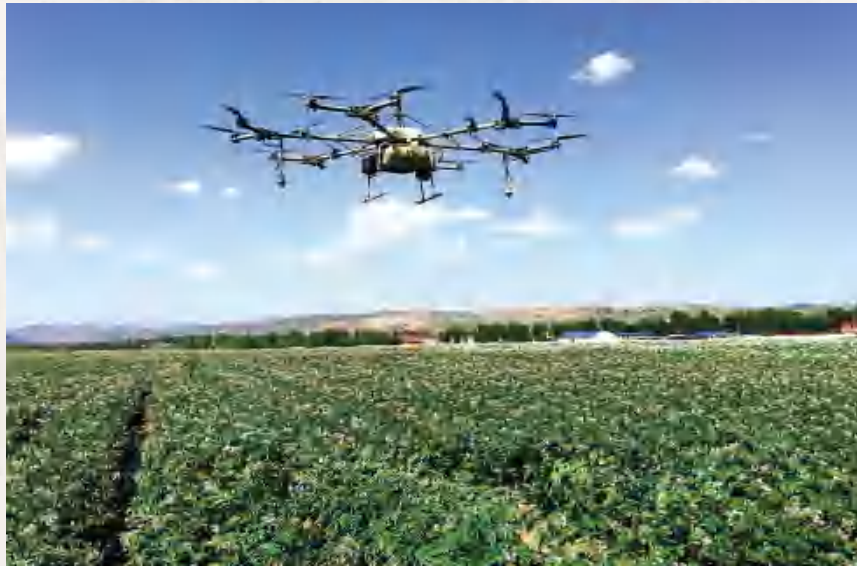
香泉镇马铃薯基地无人 人机统防统治