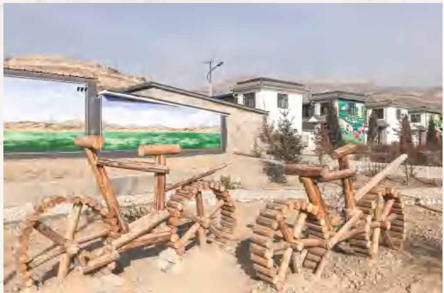
【基础设施建设】鲁家沟镇台安新村实施风貌改造,完成省级示范村创建