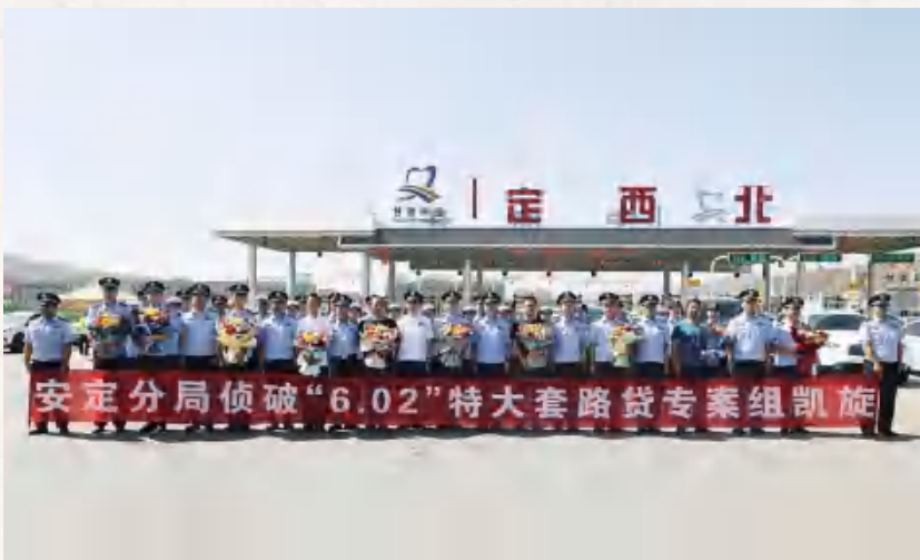
7月7日,在定西北高速公路出口举行“6·02”特大套路贷诈骗案凯旋仪式