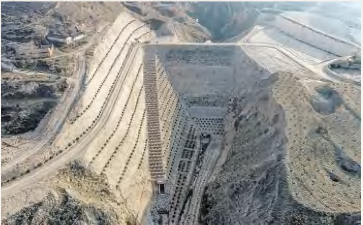
岷口镇张家湾村范家庄新建淤地坝