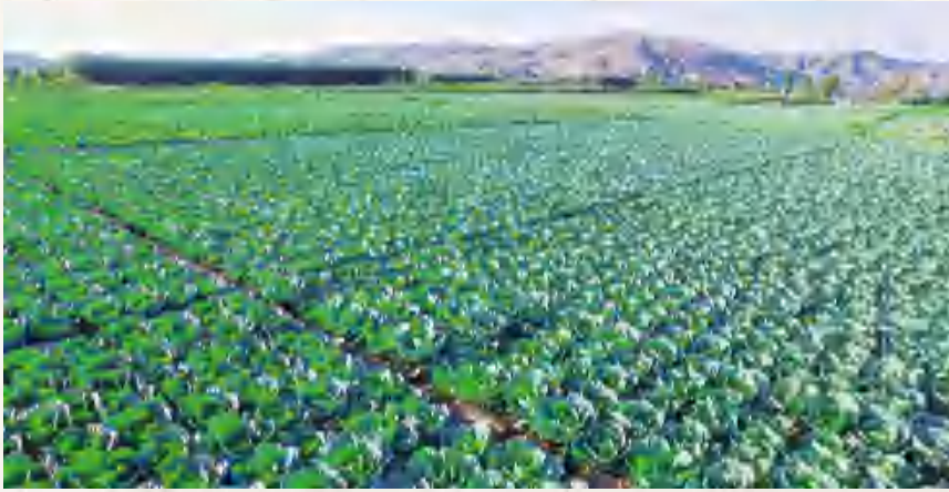
内官营镇高原夏菜种植基地