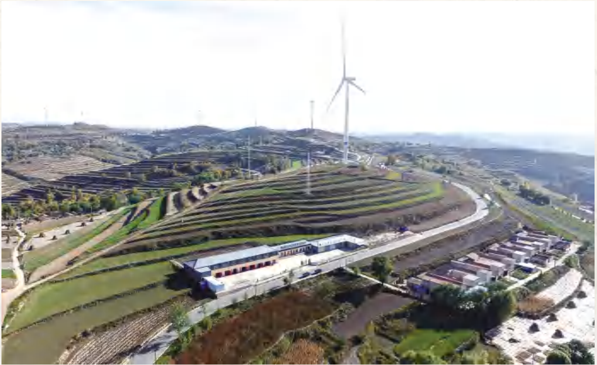
风力发电(石泉乡中寺村)