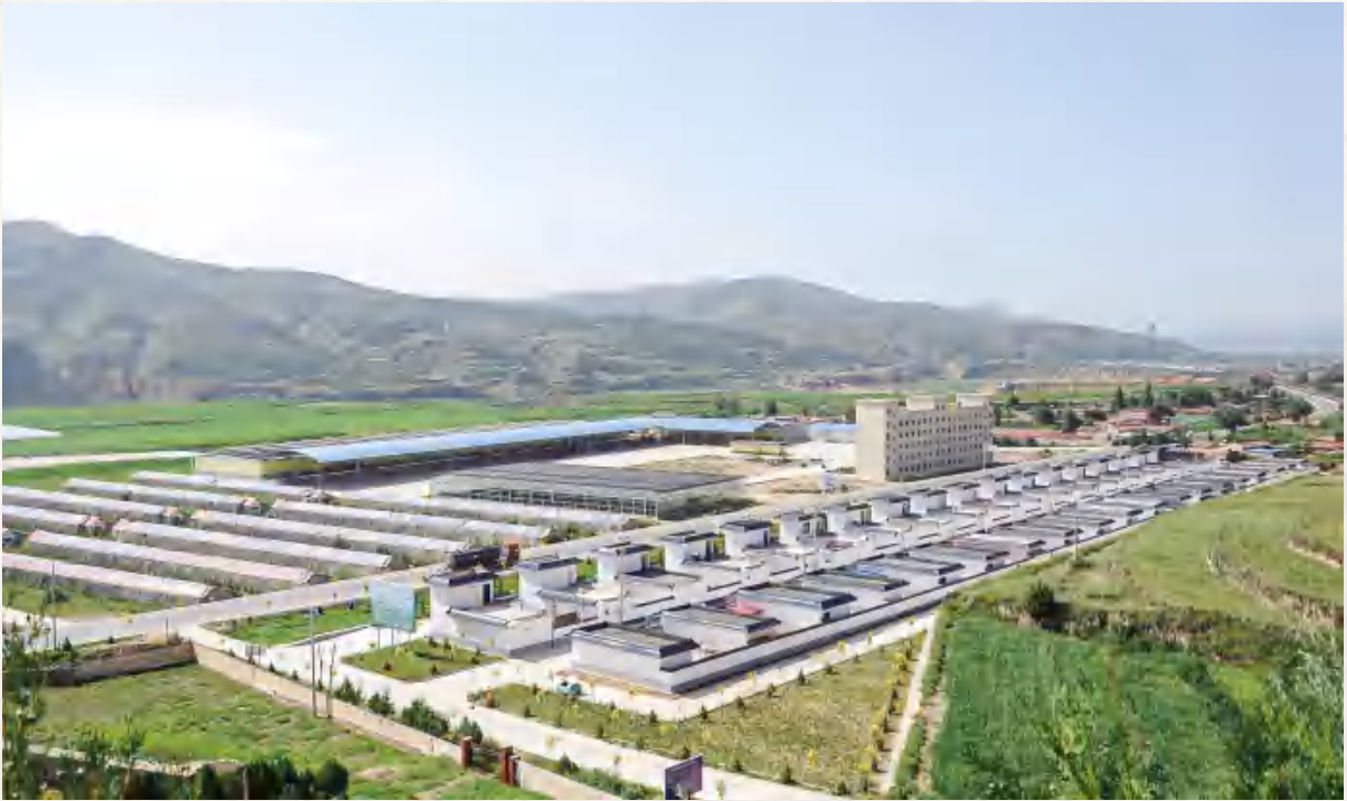
安定区鲁家沟镇将台村搬迁点,精准定位抓规划——聚焦分类指导、突出优势特色,谋划乡村建设新模式