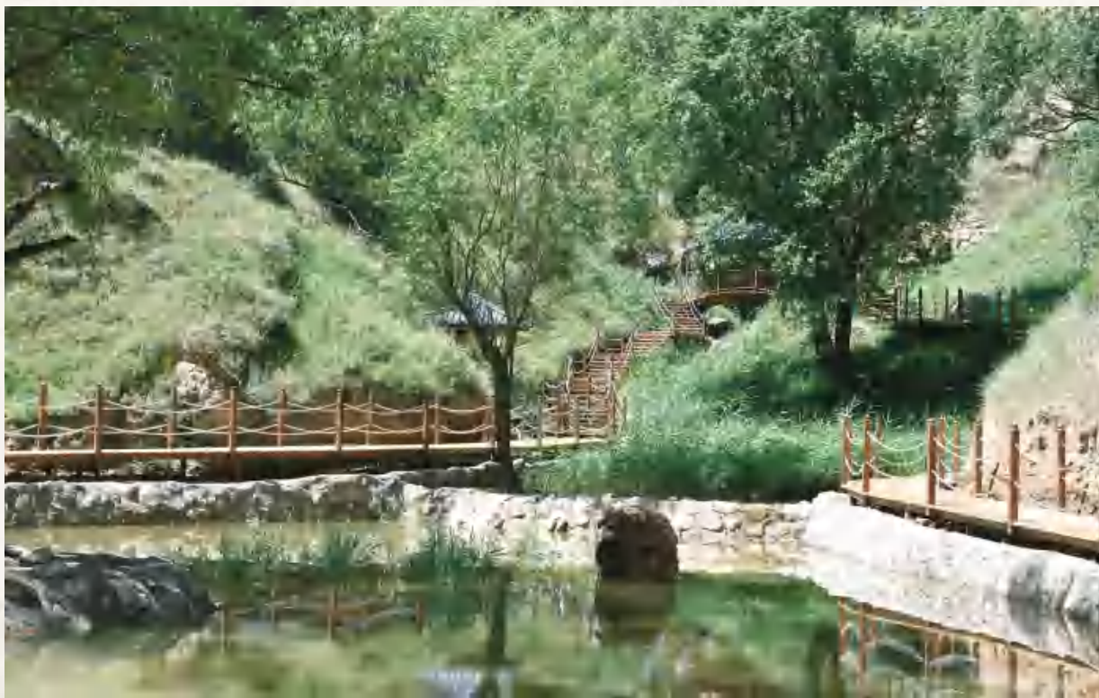
香泉镇池沟村二郎泉公园