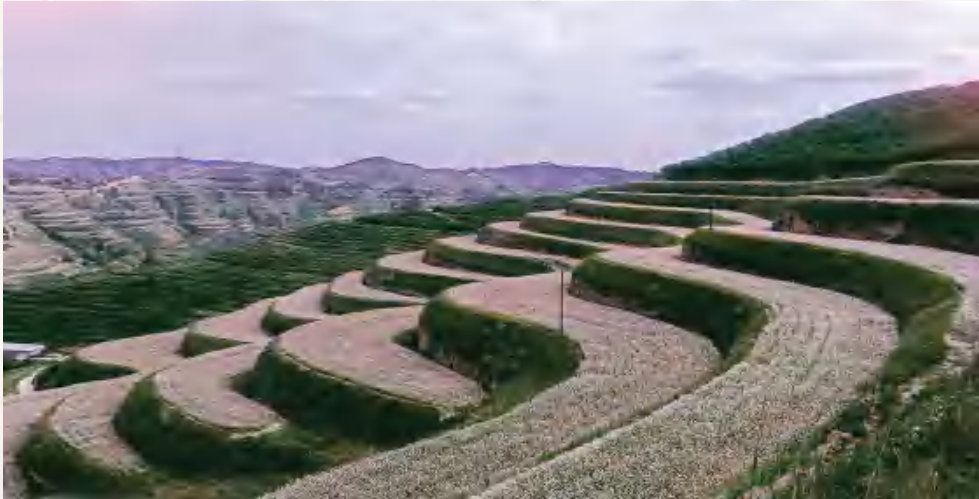
葛家岔镇黄家湾村荞麦种植基地