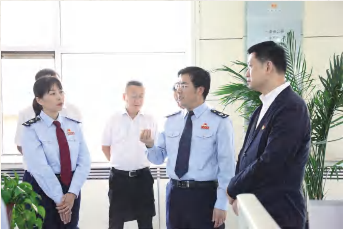
6月9日,甘肃省税务局党委书记、局长郑钢(右一)来安定区税务局调研