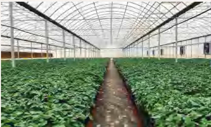
香泉镇定西市马铃薯 研究所