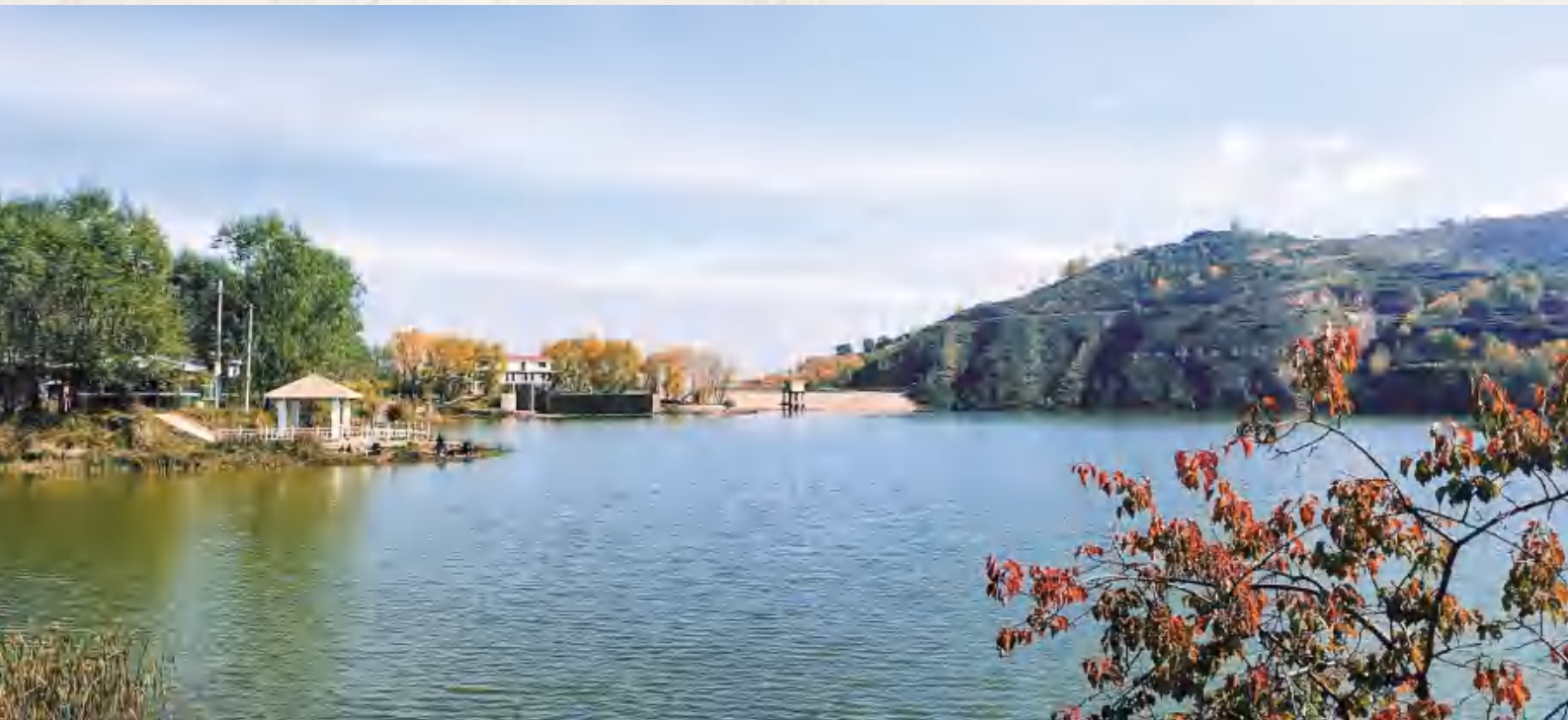
符家川镇石门水库秋景