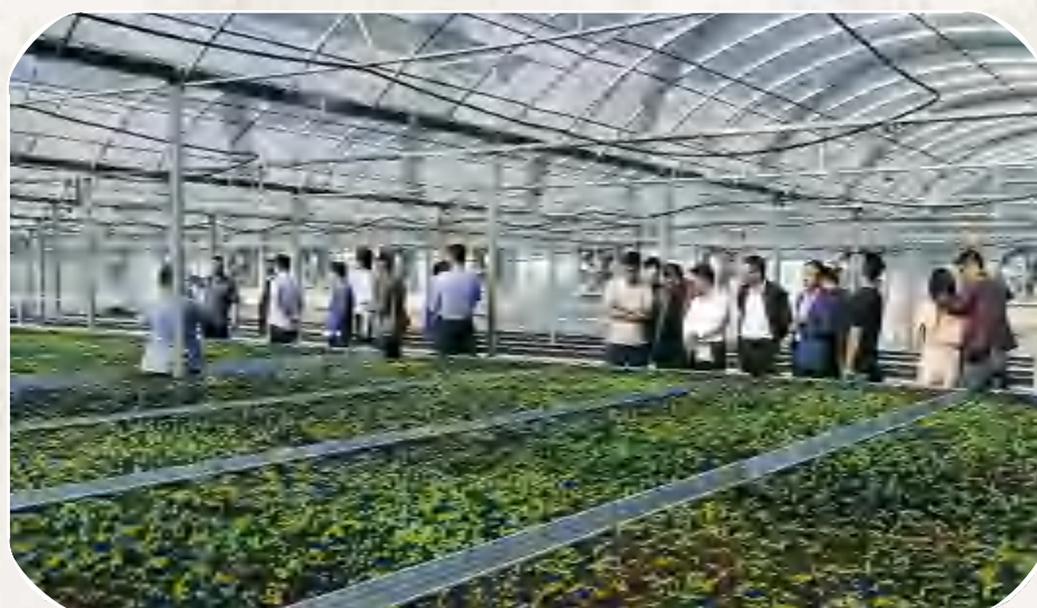
内官营镇中部 产业园马铃薯原原种 扩繁基地