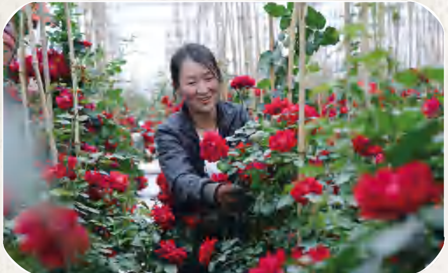
安定区鲁家沟镇花卉产业