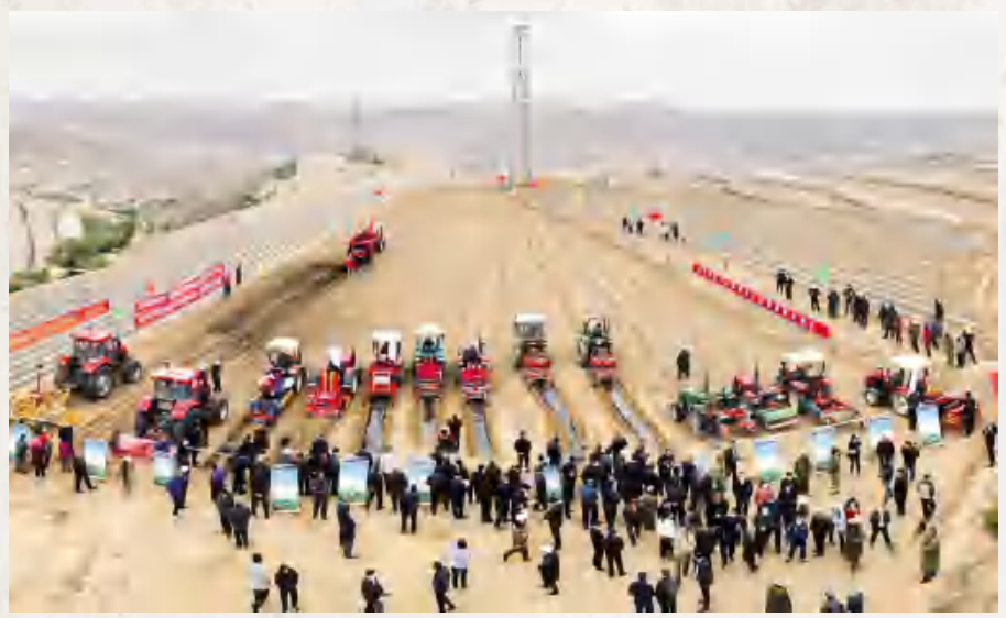
2022年，西巩驿 镇安乐村承办全省高 标准农田建设现场会