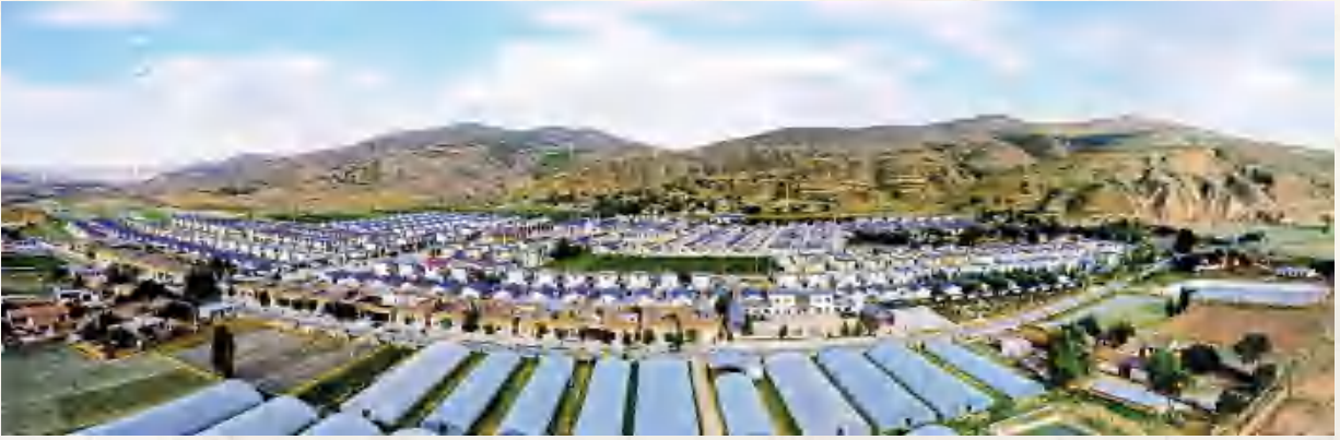
安定区鲁家沟镇将台村易地搬迁安置点