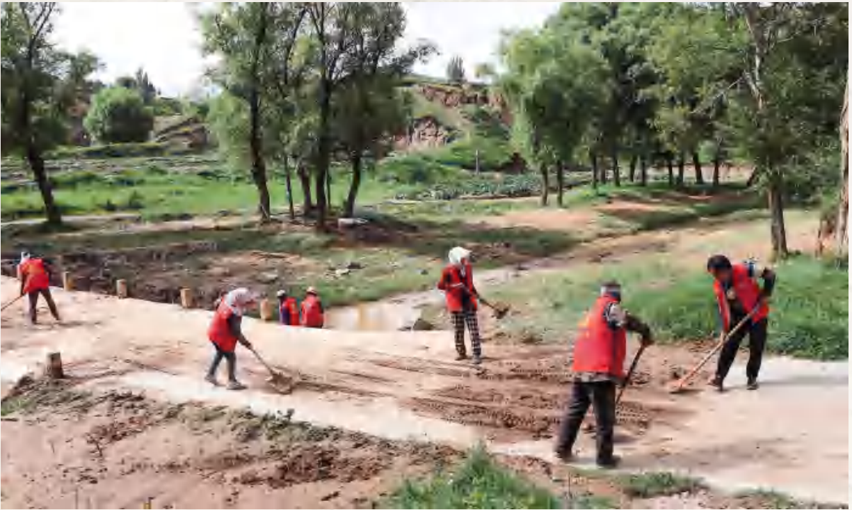
符家川镇及时组织人员维修水毁道路保障群众出行