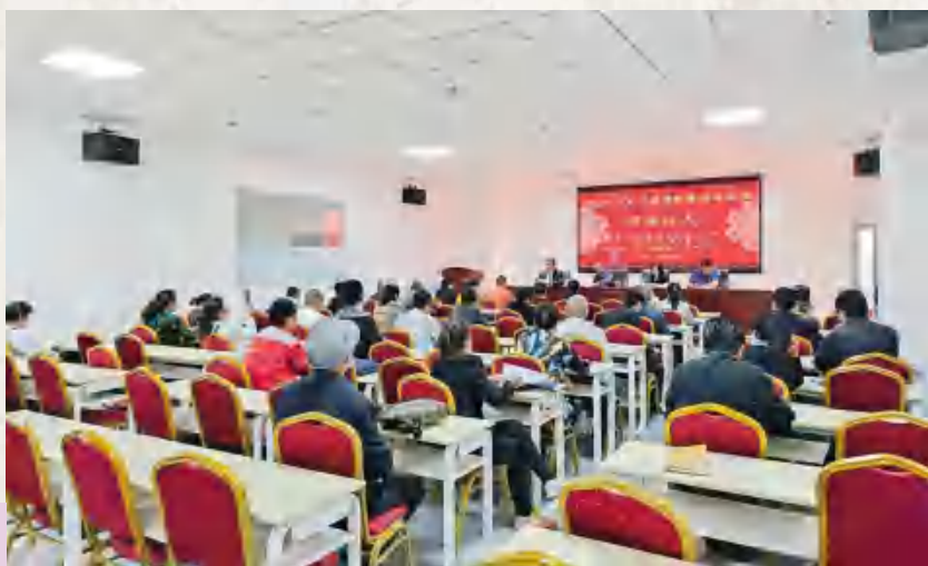
保健按摩师培训班