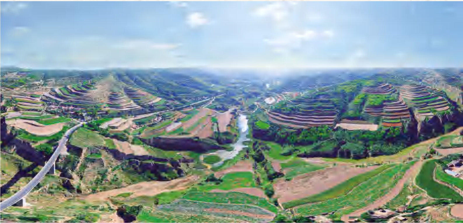
安定区官兴岔流域