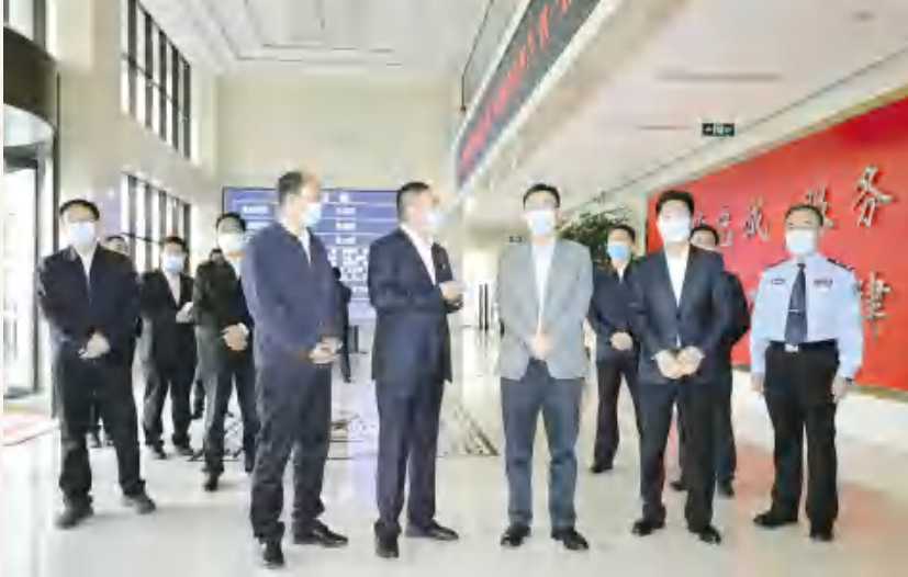
9月21日,省委常委、副省长程晓波(右三)检查定西市公安局安定分局工作