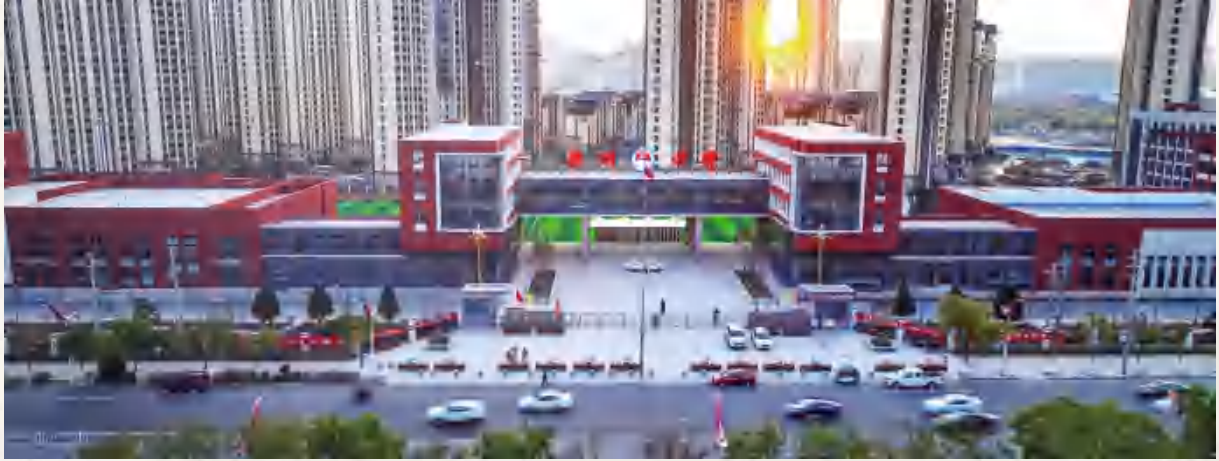
定西市安定区关川中学