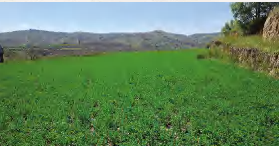
安定区紫花苜蓿种植