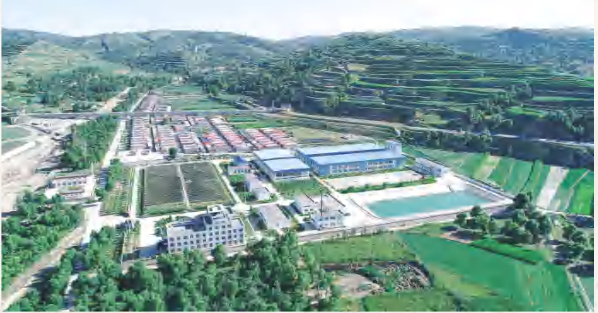
引洮供水一期工程内官水厂