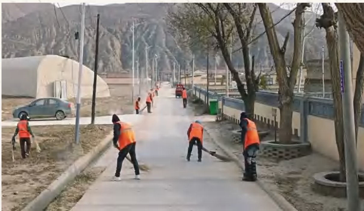
常态化开展人居环境整治