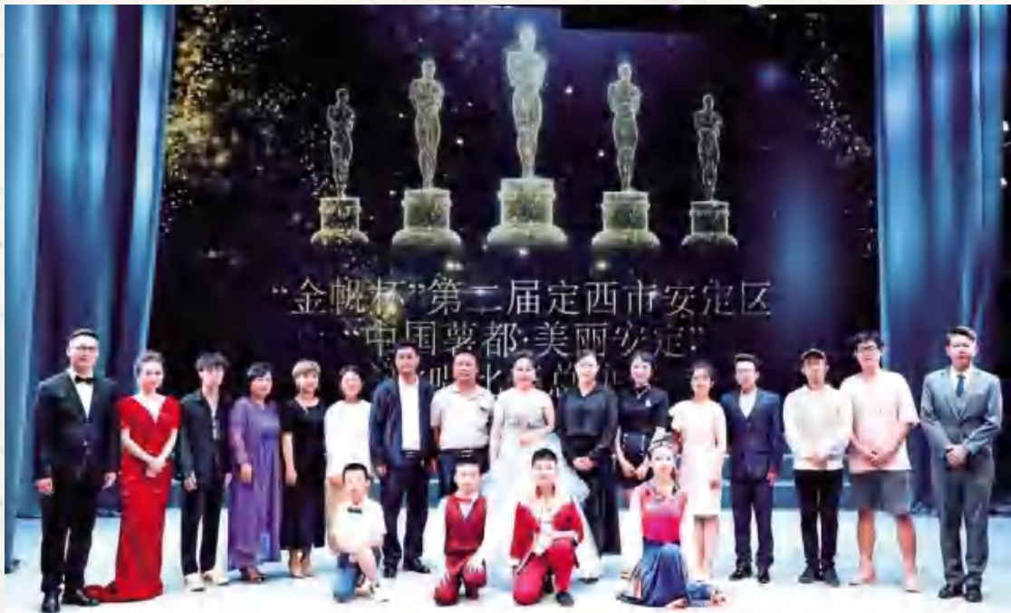
“金帆杯”第二届定西市安定区“中国薯都·美丽安定”歌唱比赛