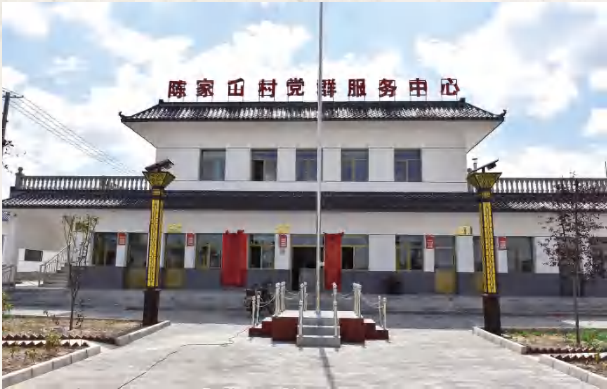
香泉镇陈家山村新党群服务中心