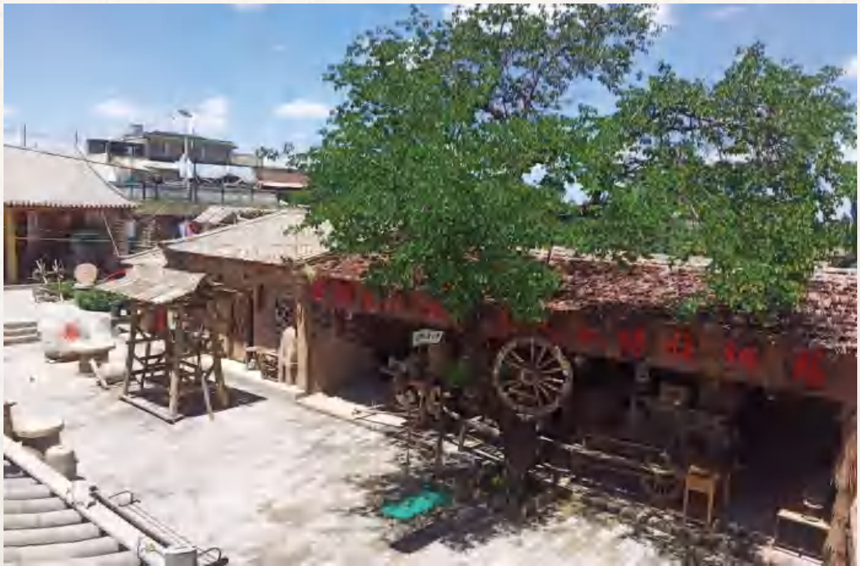
香泉镇陈家山为民民俗馆