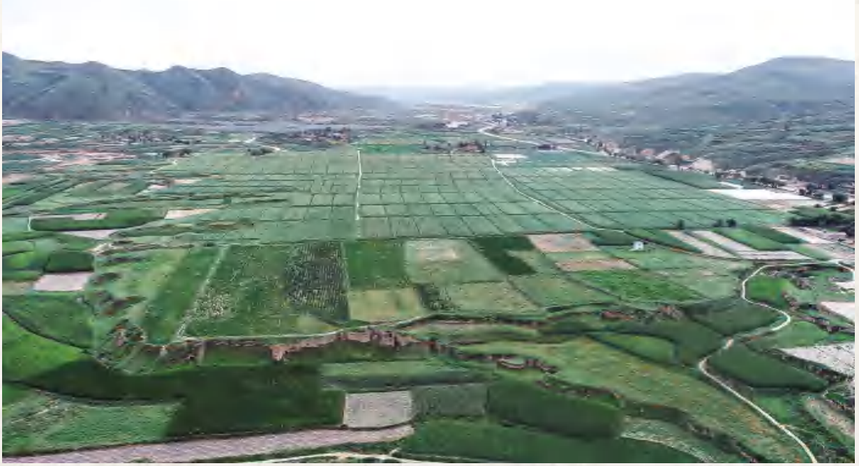
鲁家沟镇着力推动马铃薯标准化规模化经营