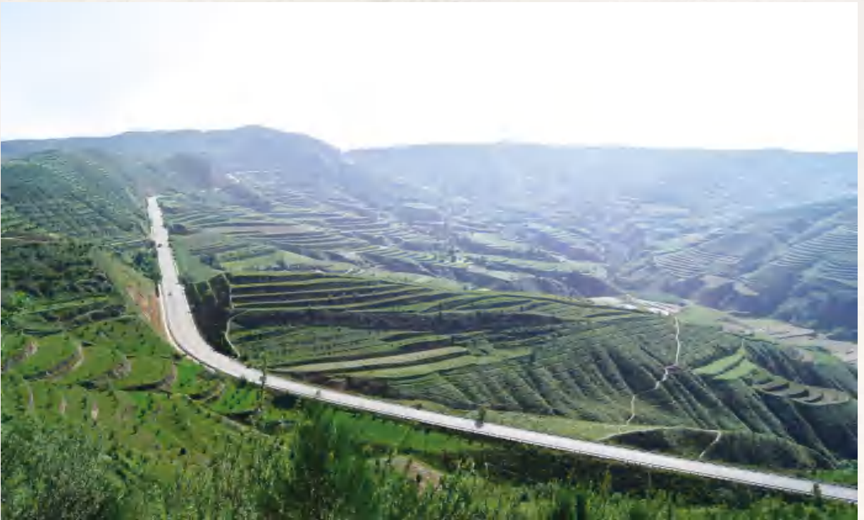
国道 312 线 (青岚山乡花岔村)