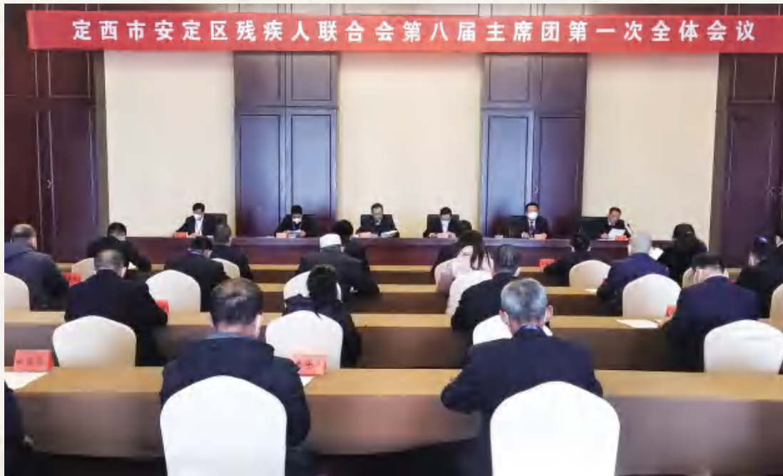
区残联第八届主席团第一次全体会议