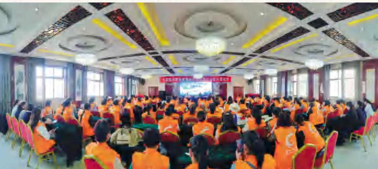
安定区妇联 家政服务职业技能 培训现场