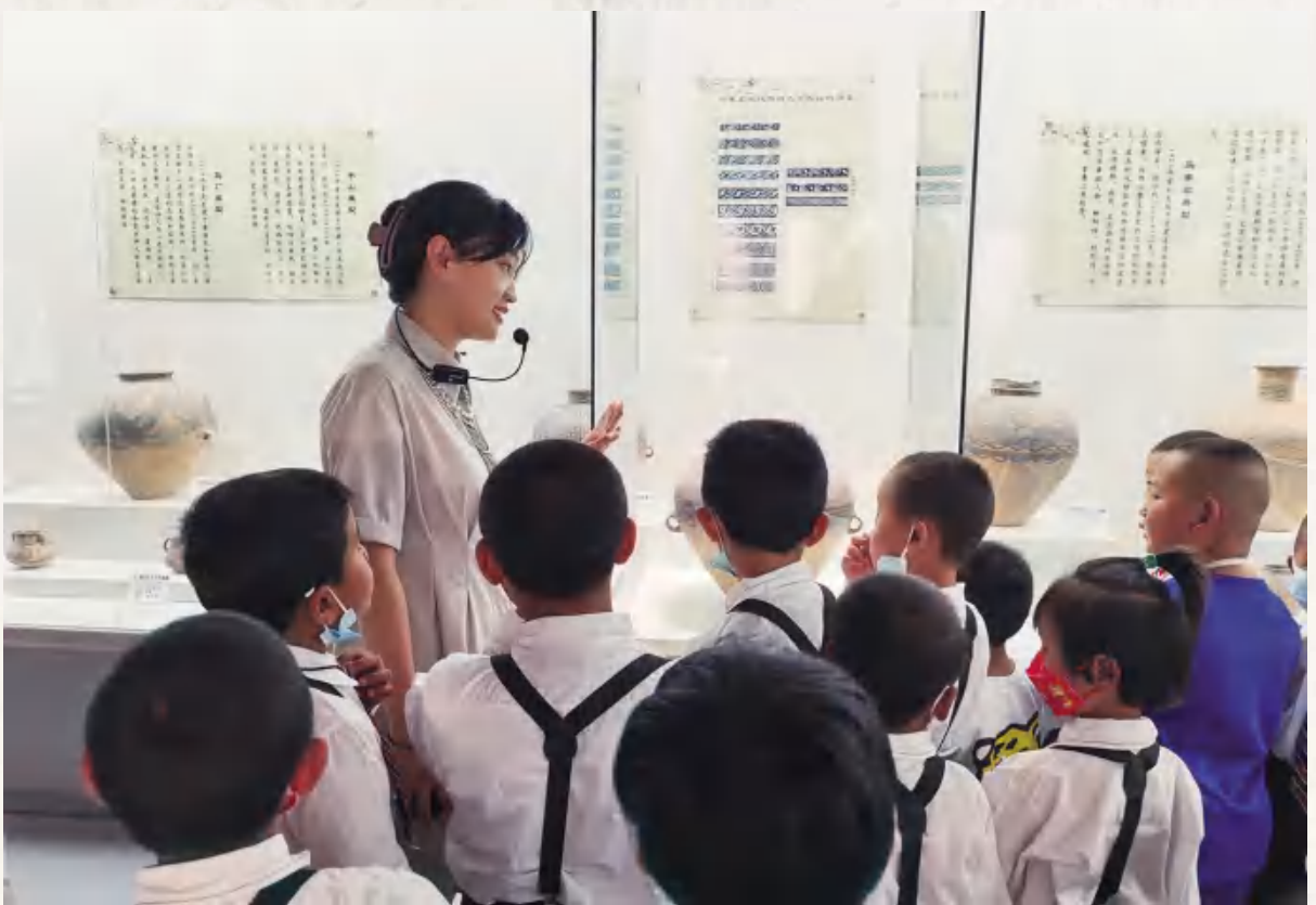
6月29日,高泉幼儿园参观安定区博物馆