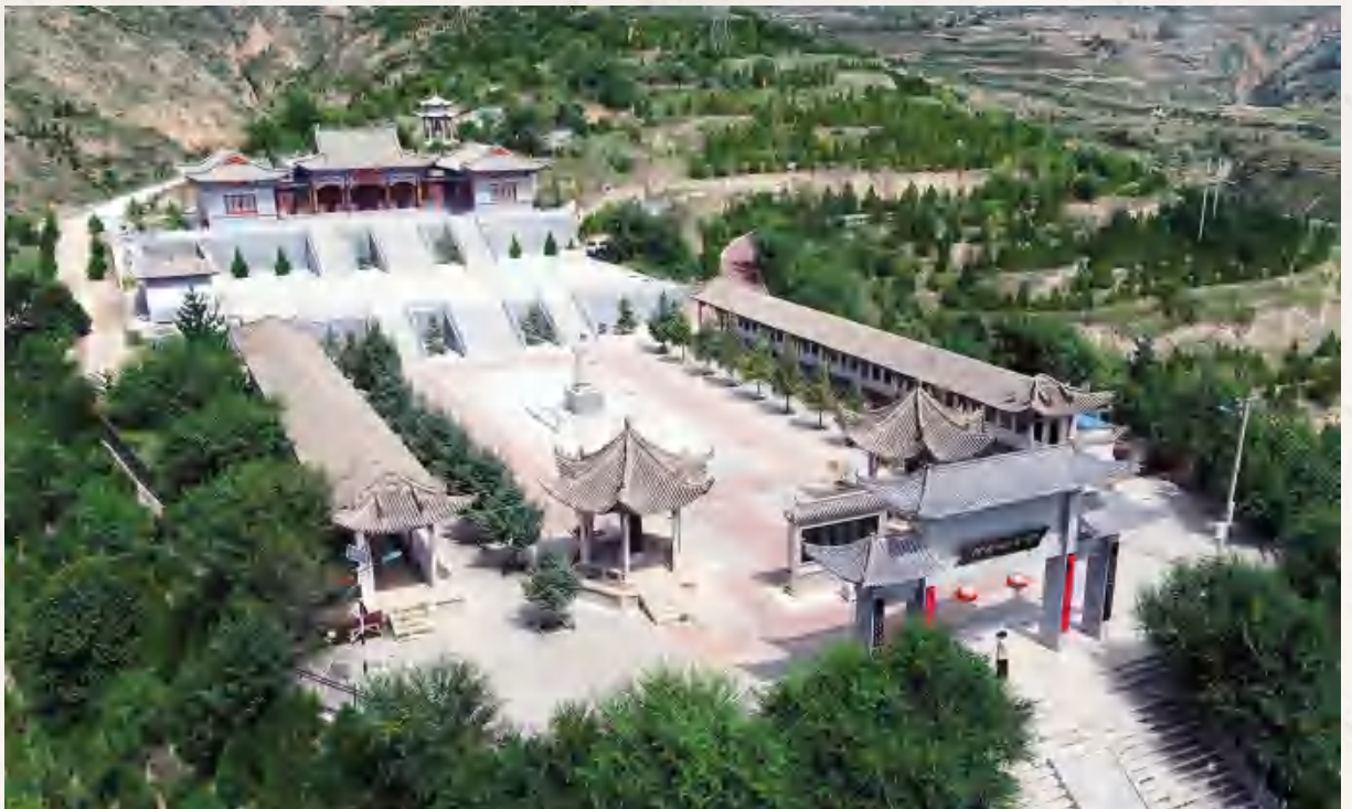
安定区廉政文化教育基地许公纪念馆