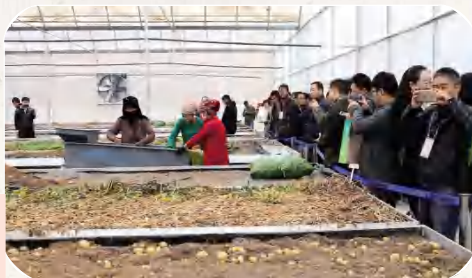
香泉镇定西马 铃薯研究所原原种 离地栽培