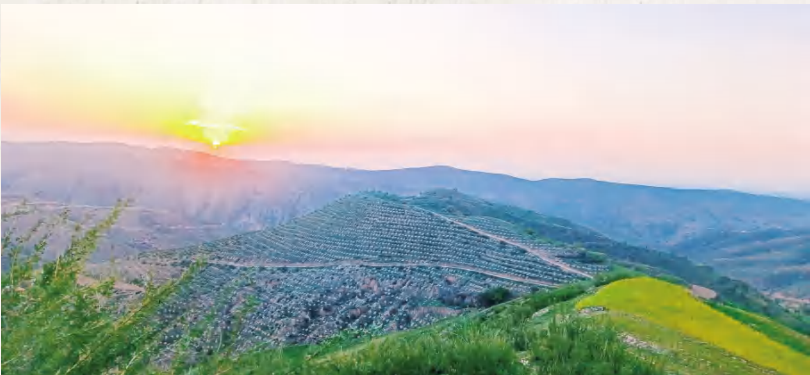
葛家岔镇北坪村水保梯田