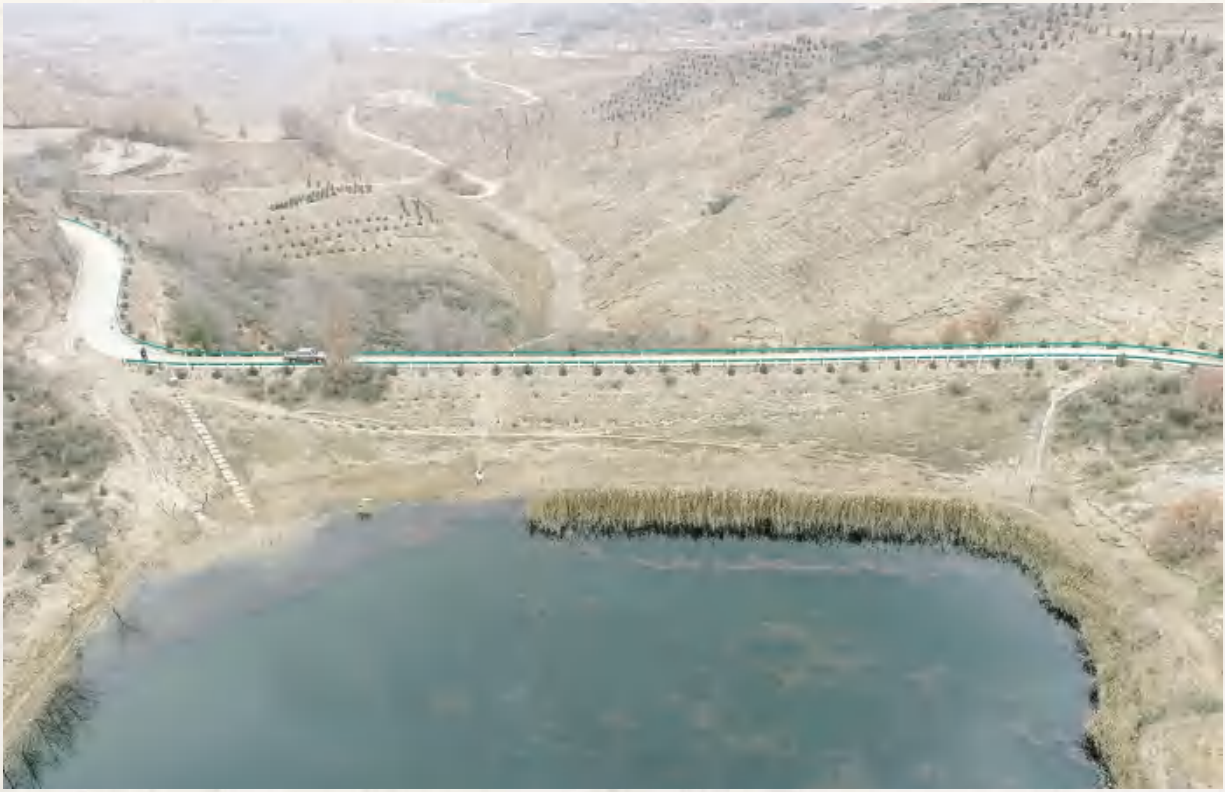
安定区李家堡镇张湾村柴家坪骨干坝治理工程