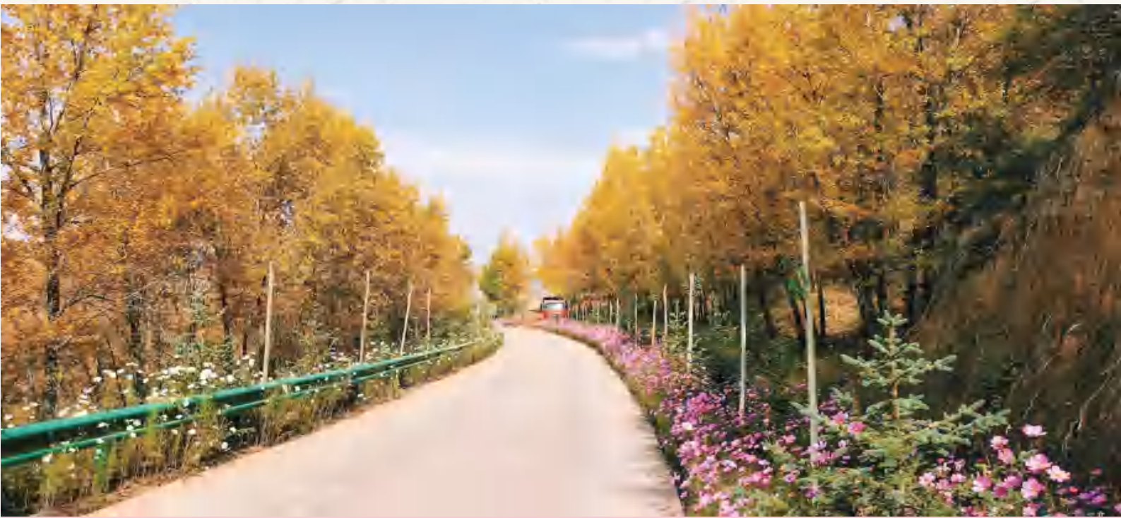
符家川镇人居环境整治“花海长廊”