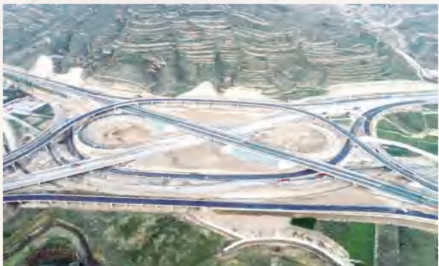
正在建设中的景家 口枢纽立交