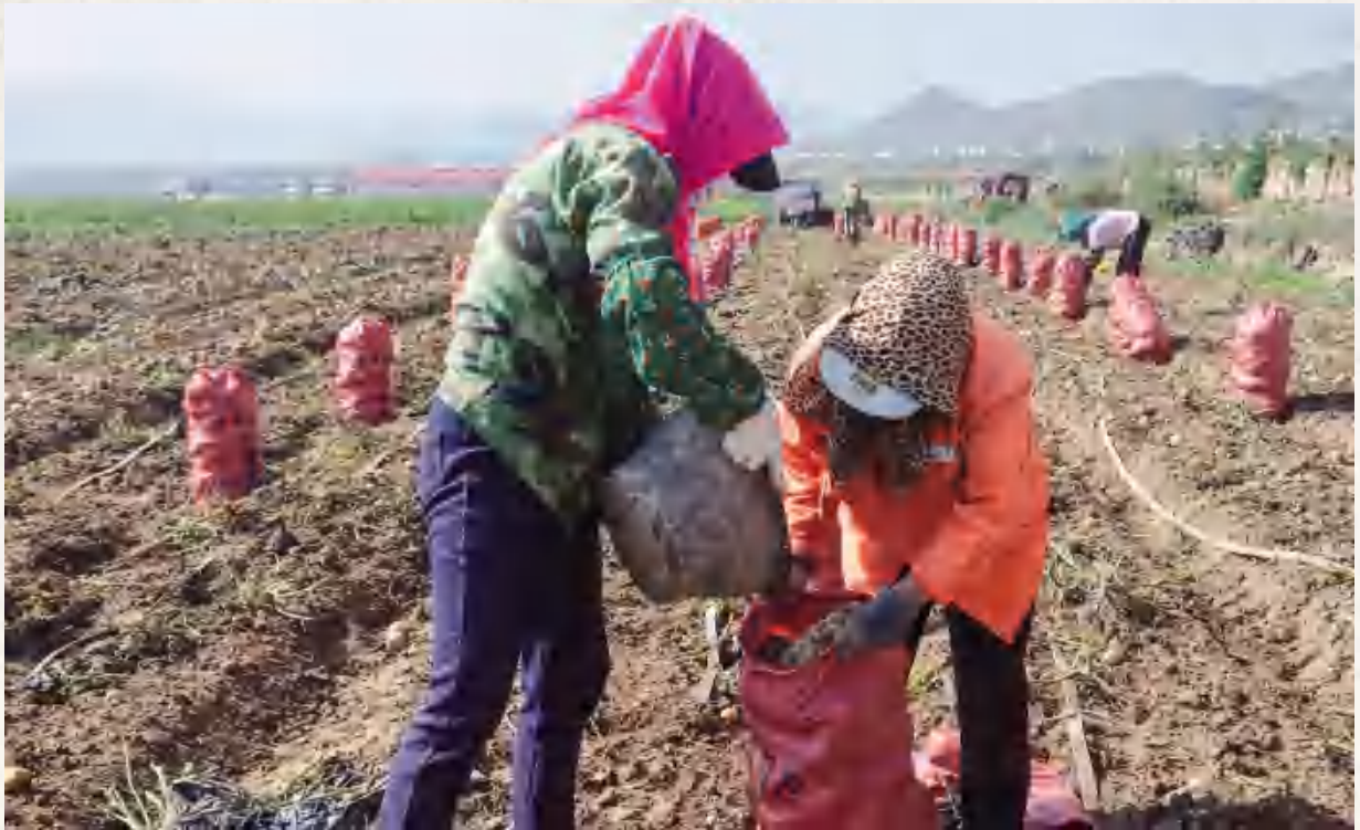
鲁家沟镇标准化规模化种植马铃薯采挖