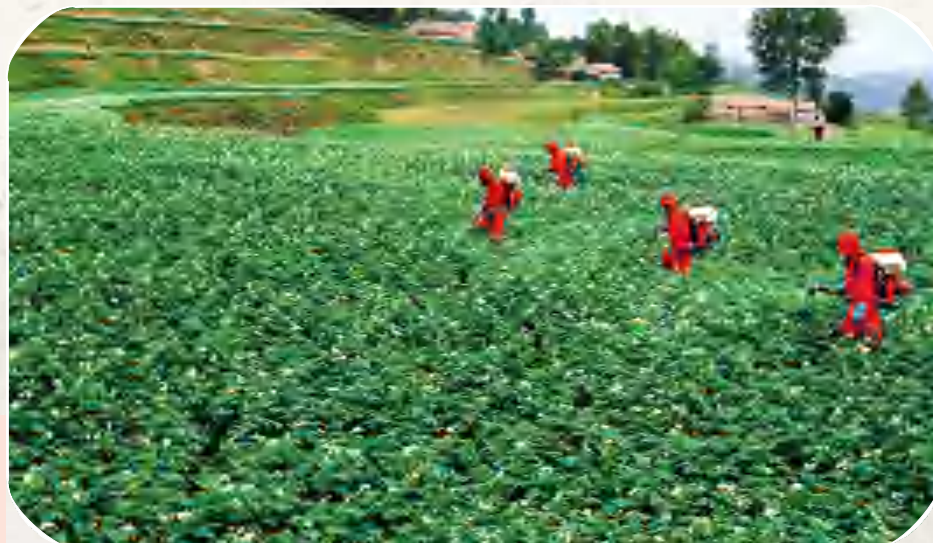
高峰乡马铃薯 晚疫病防治