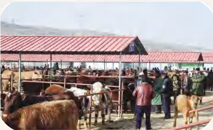
安定区李家堡镇畜禽交易市场