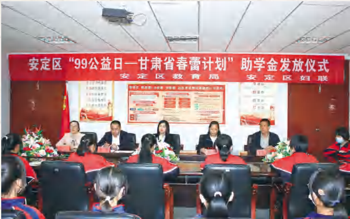
区教育局、区妇联举行“99 公益日——甘肃省春蕾计划”助学金发放仪式