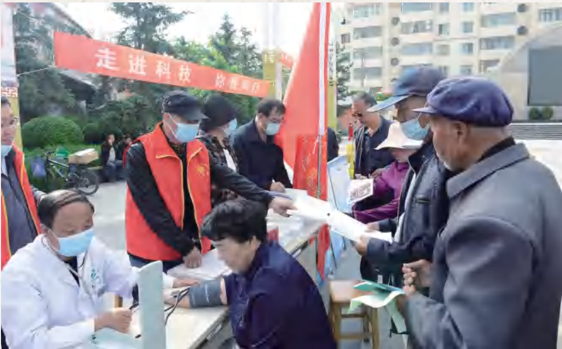
5月21日,科技活动周在立交桥广场举办