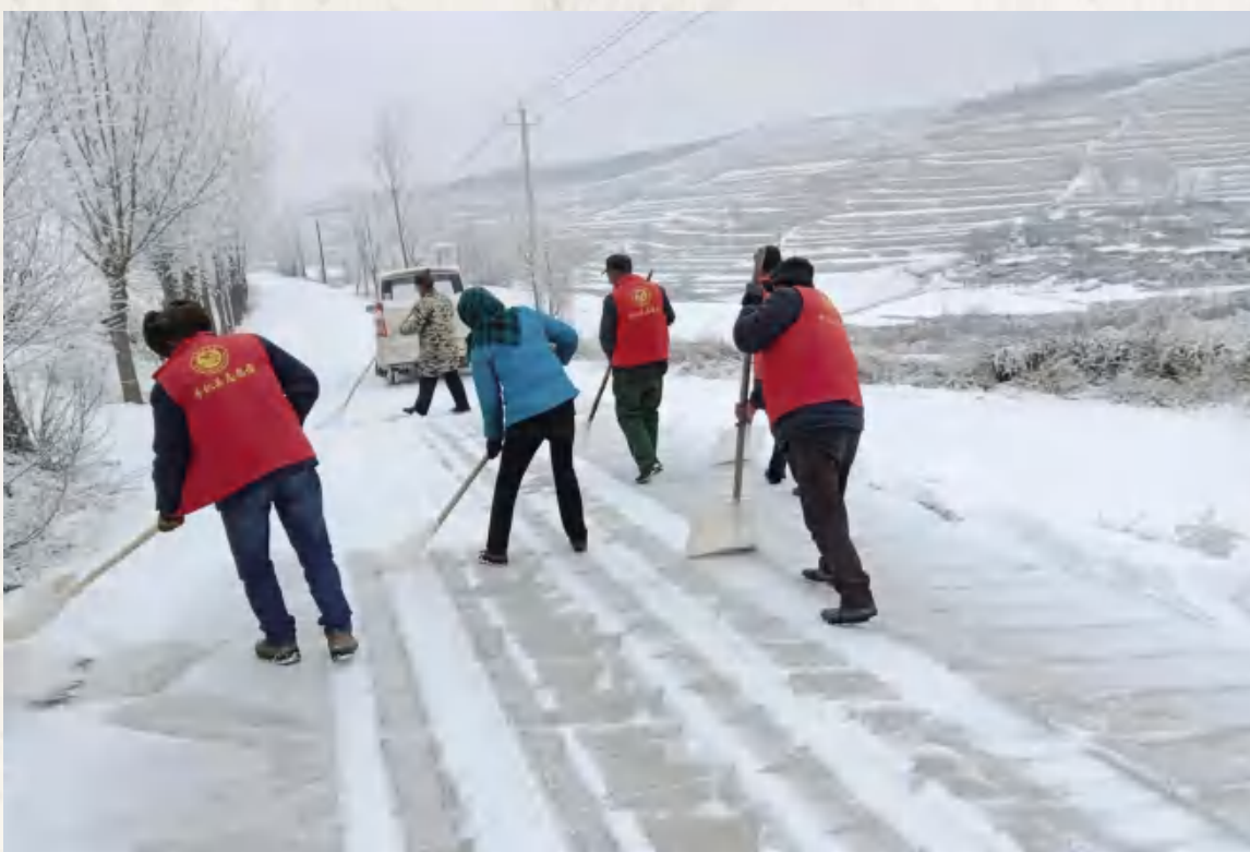
1月27日,杏园新时代文明实践志愿者服务队清理道路积雪