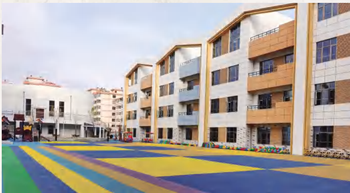
定西市安定区实验幼儿园