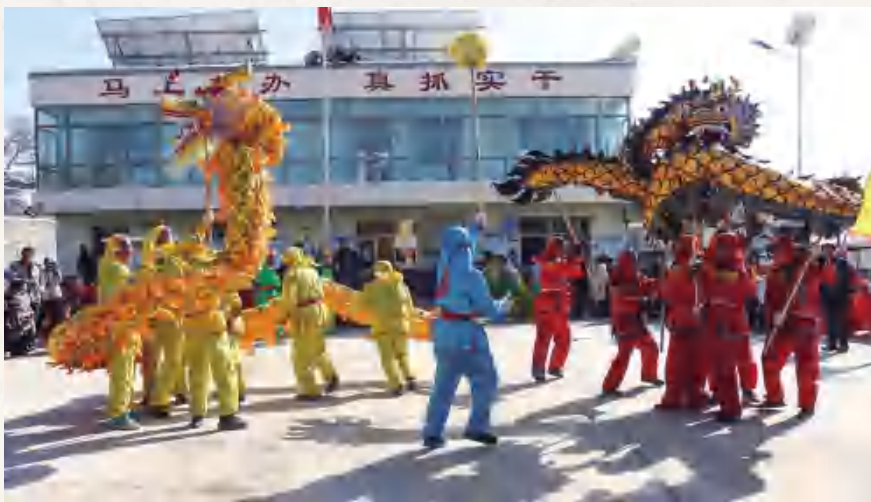
2月15日,杏园乡蟾慕山牛营老庙秧歌队在牛营村文化广场演出