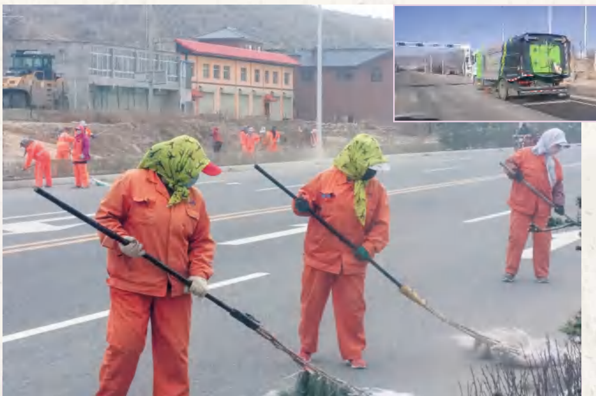
全域无垃圾集中整治