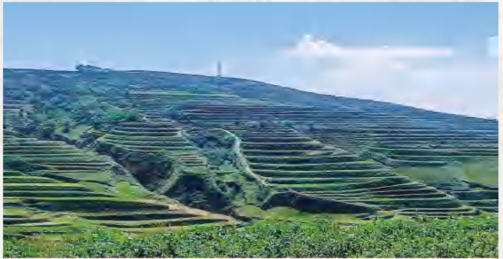
葛家岔镇鹿坪村马铃薯种植基地