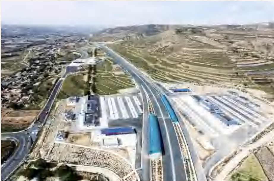
正在建设中的 通定高速公路宁远 红土服务区