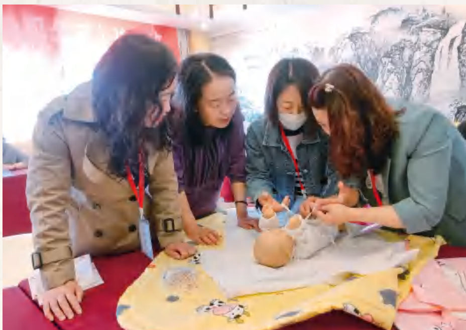
5月13日， 定西市安定区唐 声职业培训学校 家政服务员婴儿 护理实训课