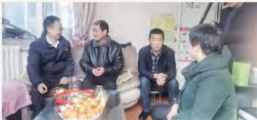
副区长赵剑波(左一)慰问人工耳蜗植入患者

7月8日,区市场监督管理局在内官营镇市场监督管理所开展现场学习观摩会,局党组班子成员、各所正副所长、执法队正副队长,各股室股长60余人参加