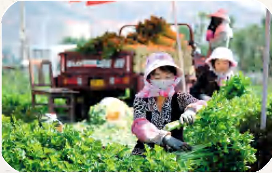
安定区把发展蔬菜产业作为农民增收的支柱产业来抓，通过引导农民种植芹菜、甘蓝等高原夏菜增收