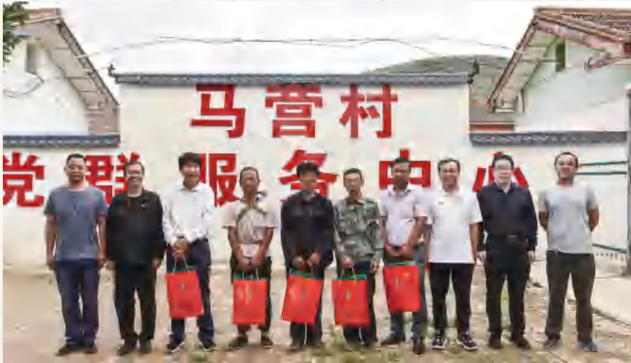
八一前夕，区退役军人事务局组织慰问 退役军人及现役军人 家属