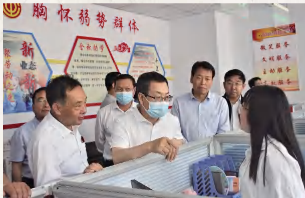
6月10日,甘肃省工会宣传教育工作在定西市召开,与会人员安定区新就业形态行业工会联合会观摩