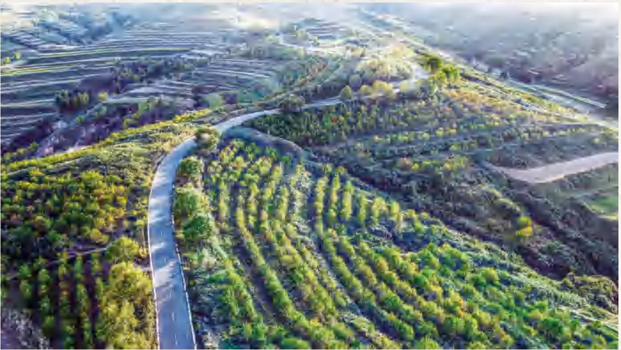
定(西)渭(源)公路 (香泉镇青岗村)