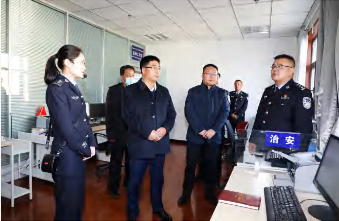
3月2日,区委副书记、区长贾文举调研定西市公安局安定分局工作