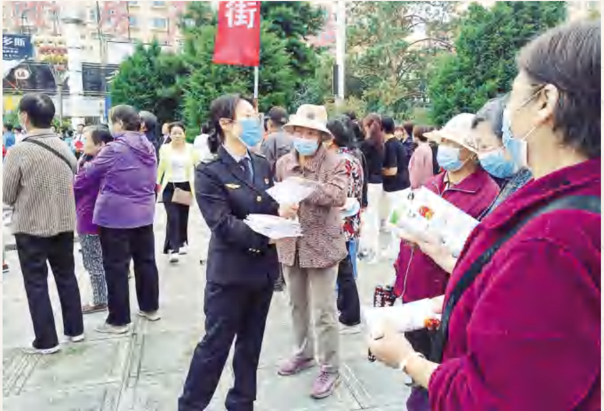
安定区市场监管局执法人员开展网络电信诈骗现场宣传活动