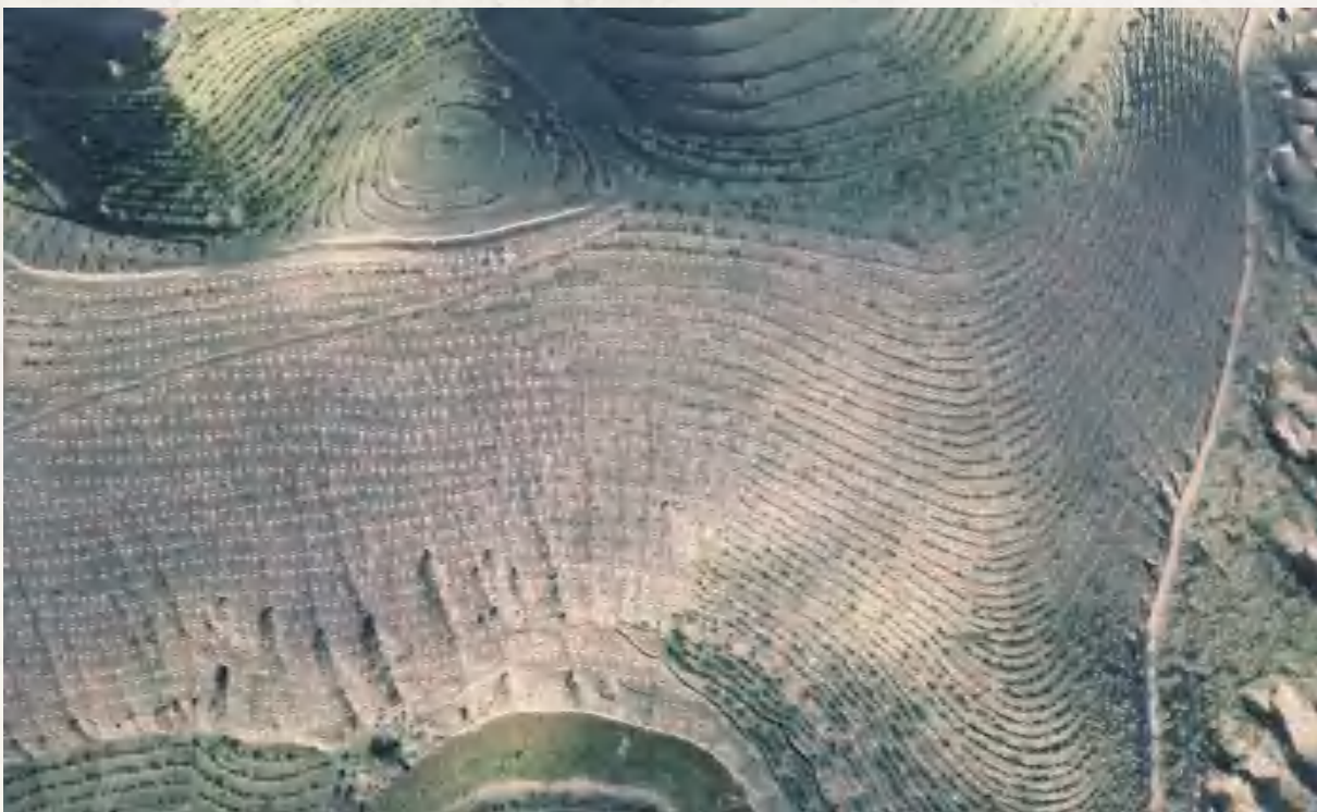
2022年坡耕地项目水保林鸟瞰一角