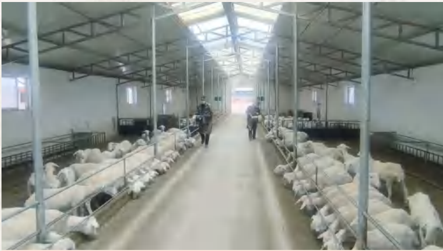
香泉镇肉羊繁育基地