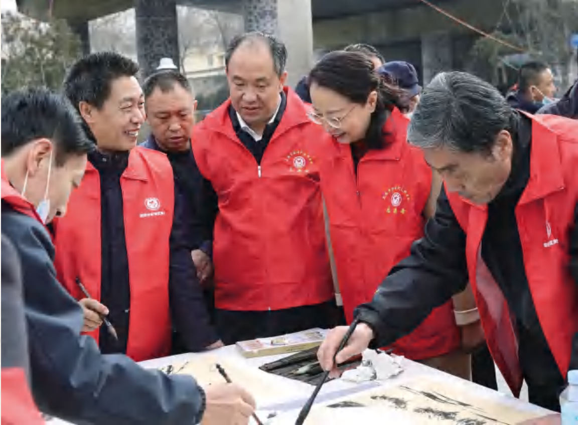
3月5日,区美协在立交桥广场开展义写义画活动,市委常委、宣传部部长马文玫(右二), 区委常委、宣传部部长苟建军(右三)出席活动