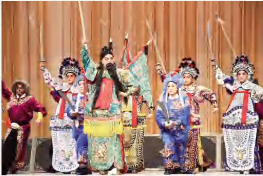
安定区秦腔剧《潞安州》剧照