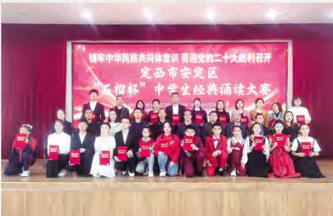
9月24日,安定区举办“石榴杯”中学生经典诵读比赛活动