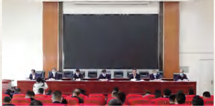
2022年机关党建工作会议暨党组织书记培训班开班式