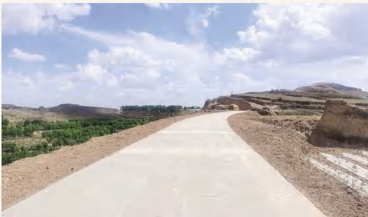
葛家岔镇葛家岔村岷口梁社通社硬化路