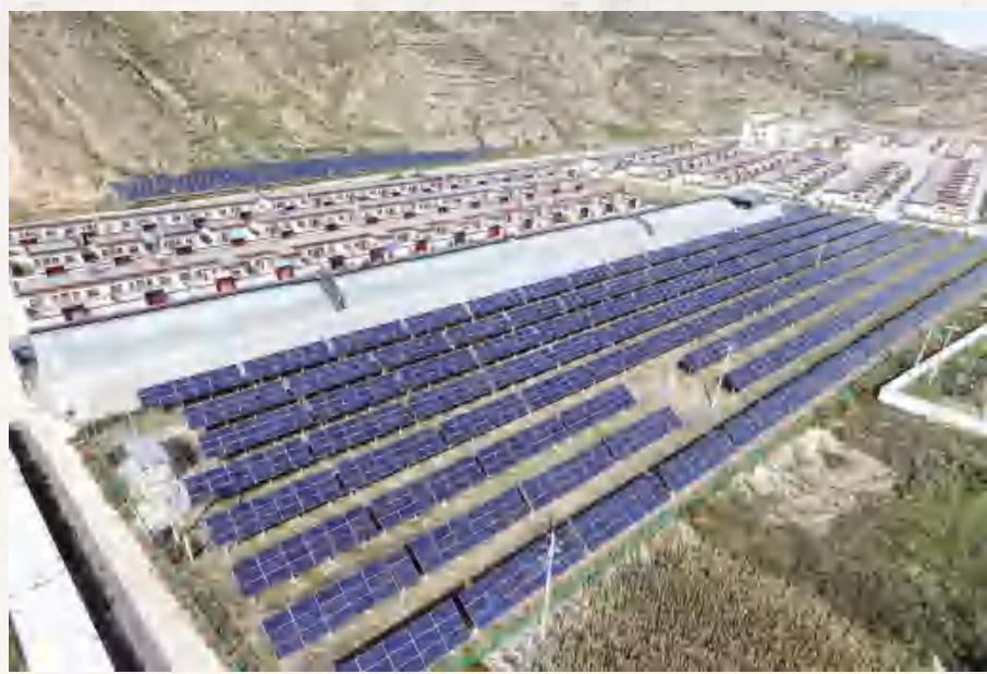
宁远镇宁远村联 村电站