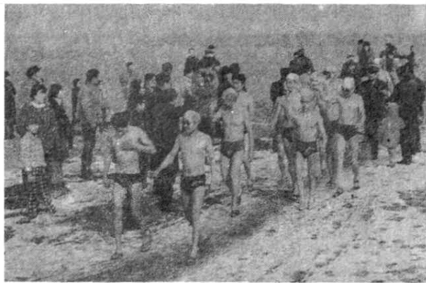
图 11 兰州市冬泳爱好者自发组织在黄河进行冬泳活动