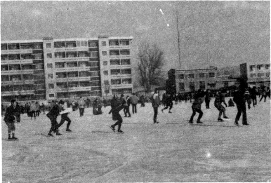
图12 兰州市滑冰爱好者在雁滩游泳池冰场开展滑冰活动

同年，五泉山公园、铁路文化宫、西北师范大学等七个单位浇灌冰场，每天早、晚约有7000余名爱好者参加滑冰活动。