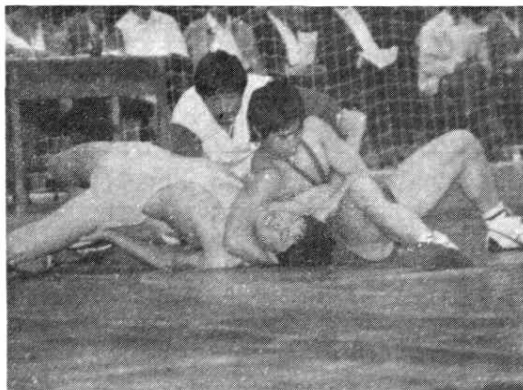
图 9 1988 年，甘肃省青少年运动会中兰州市运动员在进行摔跤比赛

同年 11 月，市委、市政府授予兰州市摔跤队金城角力士称号。共青团兰州市委授予兰州市摔跤队新长征突击队称号。省体委授予兰州市摔跤队 1988 年度思想政治工作先进集体。