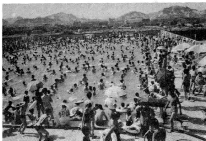
图 7 群众在鸭嘴滩体育基地游泳池开展游泳活动