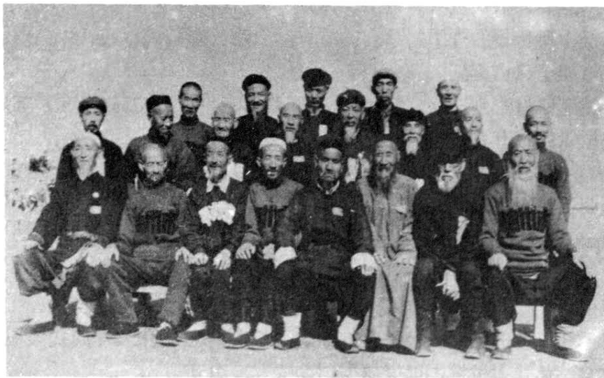
图1 1953年，兰州市参加甘肃省民族形式运动大会的兰州老拳师合影