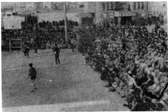
图 8 1952 年，兰州市体育爱好者组织红队男子篮球队，经常在兰园体育场进行比赛

12 月至 1951 年 9 月，兰州市体育工作者和运动员在兰州举行球类义赛，为抗美援朝运动捐款 11321600 元（旧币）。