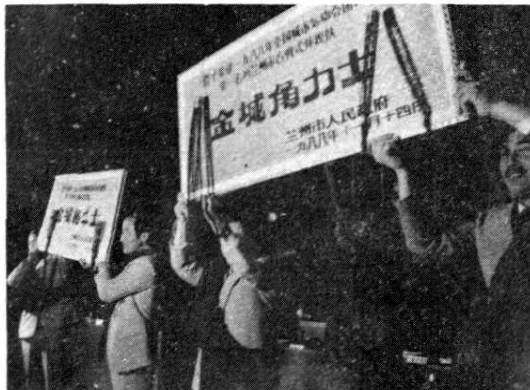
图 10 市委、市政府为在首届城运会上获得殊荣的兰州市柔道队、古典跤队颁发金城格斗士、金城角斗士匾额